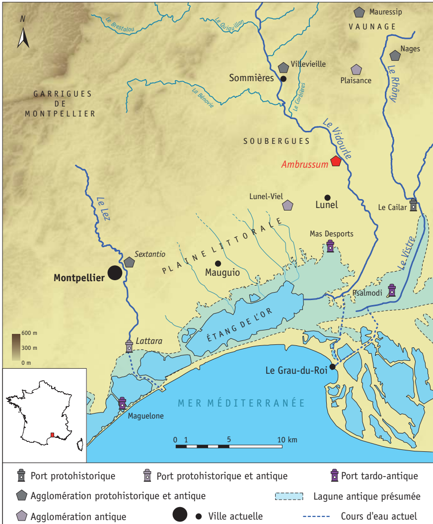
Figure 1 - Localisation de l'agglomération d'Ambrussum (MNT : S. Sanz ; SIG et DAO : M. Scrinzi).

autonomie au milieu du 1 er siècle av. J.-C., en raison de son statut d' oppidum Latinum , il semble qu'un déclassement comme oppidum attribué à Nîmes en 22 av. J.-C. a été effectué, vu le développement des équipements urbains 3 . Mais cette hypothèse reste à confirmer.