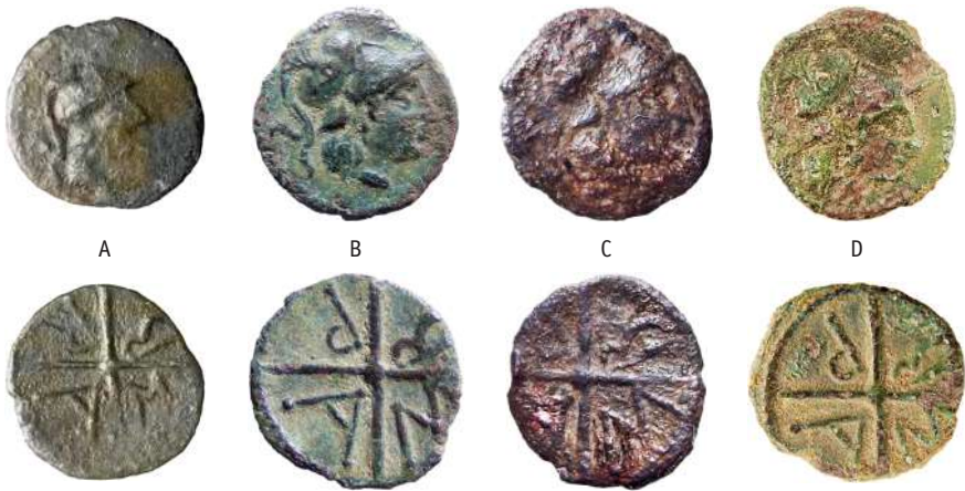
Figure 3 - Ambrussum , monnaies AMBP. A : D19 – 0,65 g, 12 mm ; B : OPPI-2018-n° 43 – 0,66 g, 13 mm ; C : 119 – 0,67 g, 11 mm ; D : OPPI-2019-n° 63 – 0,95 g, 11 mm (agrand. × 2).

R/ AMBP (A et M, bouletées), dans les cantons d'une roue à quatre rayons.