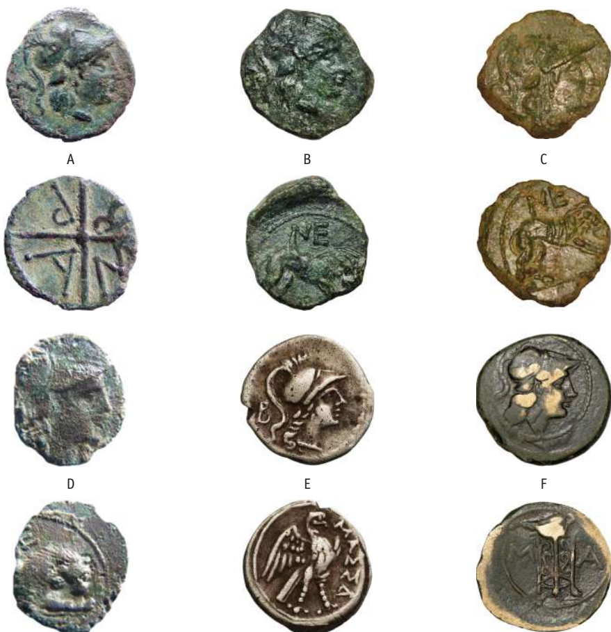
Figure 4 - Exemples comparatifs. A : petit bronze AMBP, OPPI-2018-n° 43 ; B : petit bronze NE au lion, environs de Nîmes (Gard) ; C : petit bronze NE au lion, Saint-Gilles (Gard) ; D : petit bronze NE au lion, Nîmes (Gard) ; E : Diobole à l'aigle, type DOM-56 ; F : grand bronze au trépiéd type GBM-23-27 (© A : Ch. Gourillon ; B : collection privée ; C-D : CHAZEL, BERTHOD 2012 ; E-F : www.cgb.fr).

plutôt appartenir à la seconde moitié du II e siècle av. J.-C., et plus particulièrement au dernier quart du II e siècle av. J.-C., période qui connaît une multiplication d'émissions locales, à caractère notamment identitaire, après la création de la province de Transalpine 8 .