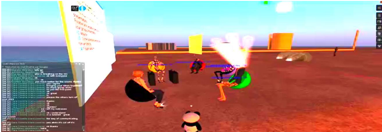
Figure 2. Capture d'écran du moment de l'interaction dans le monde synthétique

La Figure 3 offre un exemple de structuration dans le <body> des interactions multimodales synchrones du sous-corpus ARCHI21 . Trois participants sont en train d'interagir dans le monde synthétique : le premier intervient via l'audio, le second à travers les actes de son avatar et le troisième dans l'espace de clavardage. Nous comprenons qu'il s'agit d'une interaction entre trois participants et non pas d'un seul participant interagissant sous des alias différents, car les identifiants uniques sont distincts. Le participant cmr-archi21-slrefl-es-j3-1-a191 , sous son nom alias (@who) tingrabu prend la parole par le mode audio. Son tour de parole est décrit dans la balise <u> et les informations concernant le temps de début et de fin de son tour sont encodées. Lors de son tour de parole, l'avatar d'un autre participant, id="cmr-archi21-slrefl-es-j3-1-a192" , sous son alias romeorez , fait l'acte de manger du popcorn décrit avec l'élément enfant <prod> (mode non verbal). Nous pouvons voir, grâce aux balises temporelles que cette interaction non verbale se chevauche avec le tour de parole de tingrabu . Juste après, toujours en même temps que tingrabu parle dans le mode audio, le participant