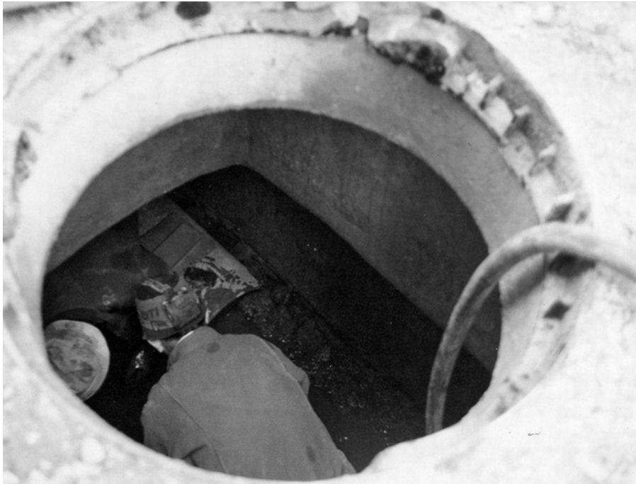
■ Les égoutiers travaillent avant tout avec les yeux et le nez.

En premier lieu, en collaboration avec des neurolinguistes, il serait intéressant de tester une thèse récente sur le lexique mental, soutenant qu'il faut considérer les mots comme des stimuli dont la signification réside dans les effets causaux qu'ils ont sur les états mentaux. Les propriétés phonologiques, syntaxiques et sémantiques d'un mot seraient révélées par les effets de ce mot sur ces états du cerveau (Elman 2004). Ce phénomène est-il plus ou moins prononcé, et plus ou moins partagé, selon qu'on se situe sur le versant positif ou négatif de l'espace hédonique? Par ailleurs, quels sont les effets proprement sensoriels de certains mots eux-mêmes? Dans d'autres registres de l'expérience sensorielle, ces effets sont évidents: que l'on songe par exemple à des noms déverbaux comme «bruissement», «grésillement» ou à des mots comme «roucouler», «râpeux», etc. Il n'est pas absurde de supposer que certains descripteurs olfactifs puissent également remplir ce rôle de stimuli sensoriels. Reste, bien entendu, à savoir lesquels.