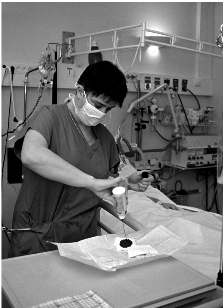
■ Pose de pansement en chambre de réanimation, hôpital Lariboisière, 1999 (photo P. Simon / AP-HP).

du corps..., mais qu'il n'y a pas eu d'hypermédicalisation ou de traitement médical, vous sentez..., l'enfant sent bon. L'enfant sent..., l'enfant ça a une bonne odeur. Un enfant ça sent bon. Ça sent pas mauvais, un enfant. Déjà, il se dégrade moins vite qu'un adulte. La rigidité cadavérique varie dans le temps. On dit que douze heures après le décès, la rigidité cadavérique intervient, et qu'ensuite elle tombe. Il y a une production d'acide lactique et là, chez les