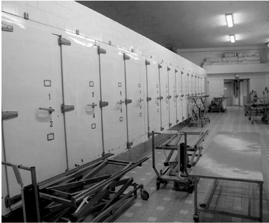
■ Armoires frigorifiques à la morgue.

Les odeurs peuvent ainsi nourrir les représentations des clivages professionnels, sociaux, nationaux ou raciaux et contribuer du même coup aux discriminations entre groupes qui se pensent ou se perçoivent olfactivement différents, moyen commode de naturaliser l'altérité. Sans doute touche-t-on là également à ce que David Le Breton appelle un « imaginaire de mélange des corps » (1998 : 12), l'idée d'être traversé par les odeurs de l'autre pouvant soit éveiller le plaisir, soit inspirer le dégoût comme c'est le cas dans les exemples présentés ici. On vérifie à nouveau que, dans le registre olfactif, la frontière entre soi et les autres est éminemment poreuse. Les limites corporelles sont ébranlées et questionnées dans le même temps que les frontières entre le soi et le non-soi, la vie et la mort. Il n'est dès lors pas étonnant de constater que, pour tous nos informateurs, les odeurs les plus terribles sont celles qui ont pour source la mort et les cadavres.