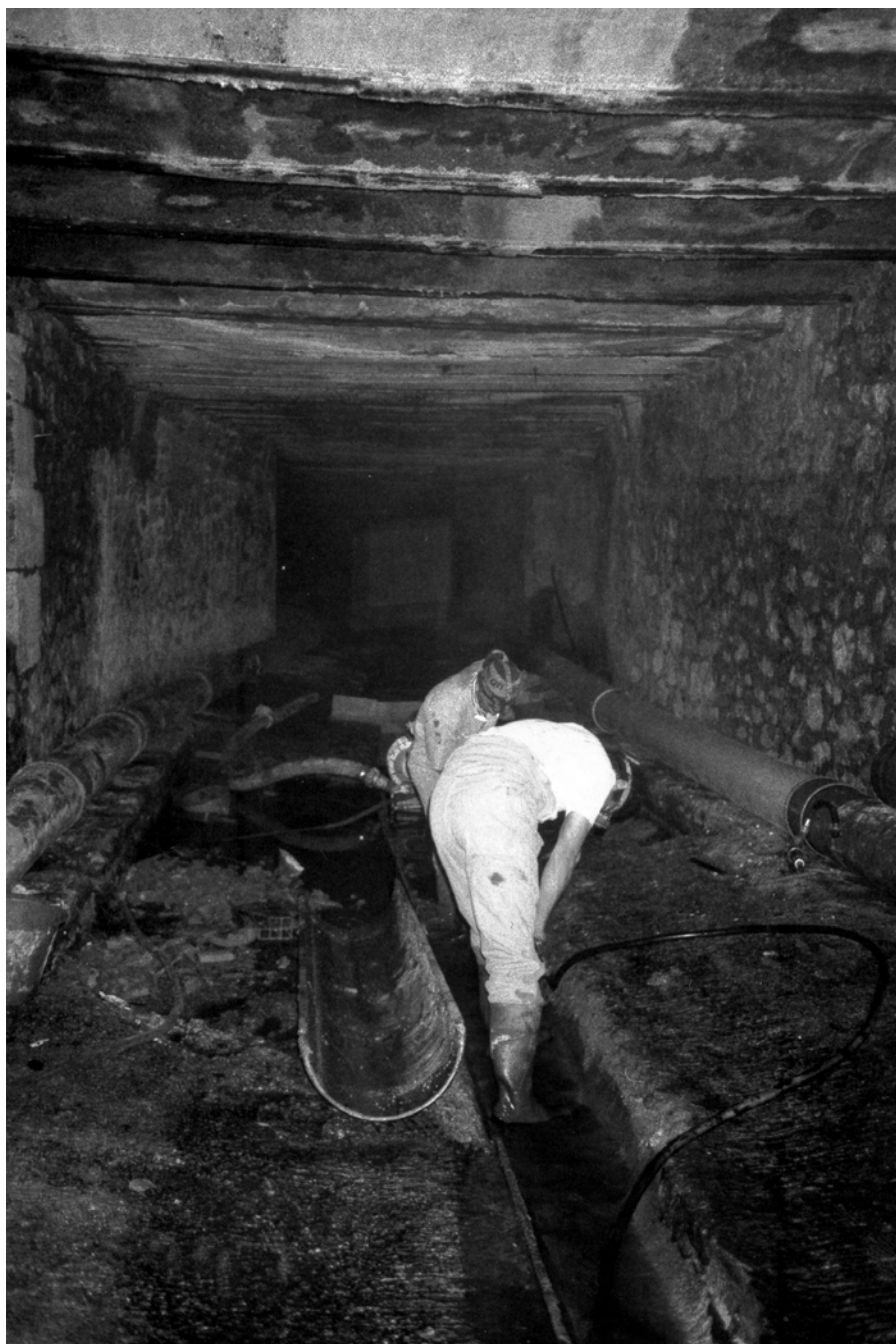
■ Petit à petit, les égoutiers ont appris à repérer et à identifier les odeurs ou leur absence, parfois signe de forte toxicité.

expérience parvient à faire l'objet d'un partage. Cette hypothèse est banale, mais elle est congruente avec ce que l'on sait de l'apprentissage et de l'usage du langage : en situation de communication, il consiste à rechercher puis à produire les mots qu'il faut dans les circonstances adéquates de telle sorte que leur énonciation suscite l'approbation d'un groupe de locuteurs 4 . Or, peu ou prou, cette recherche et cette tentative de production des « mots qu'il faut » doivent être renouvelées lors de chacune de nos expériences olfactives.