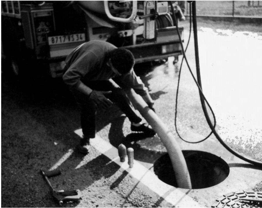
■ Pour être égoutier, il faut « supporter l'odeur »..

professionnelle : « Les égouts pour y travailler, il y a ceux qui supportent l'odeur et ceux qui ne supportent pas, c'est physiologique. Il y a ceux qui restent et ceux qui abandonnent le boulot dès le premier jour... On en voit passer ici des gens qui ne restent pas, qui ne peuvent pas supporter les odeurs. C'est physiologique. On est fait comme ça 15 . » D'autres considèrent que leur absence de répulsion provient d'une accoutumance. Leur travail les aurait en quelque sorte transformés, leur activité professionnelle aurait une influence sur leur physiologie : « Alors la personne qui va la [l'odeur d'égout] sentir la première fois, c'est certain, là ça va être écoeurant [...]. Là c'est oups, c'est dur, il faut avoir le cœur bien accroché. Parce que c'est l'odeur qui... ce n'est pas tant la vision de ce que l'on voit qui nous gêne, c'est plutôt l'odeur pour la première fois. Après on y est habitué. Après, quand vous y êtes habitué, vous ne les sentez plus ces odeurs 16 . » Ces propos confirment le constat de Béguin (1993 : 63) selon lequel la mise en œuvre d'une expertise olfactive repousserait la dimension hédonique au second plan du juge-