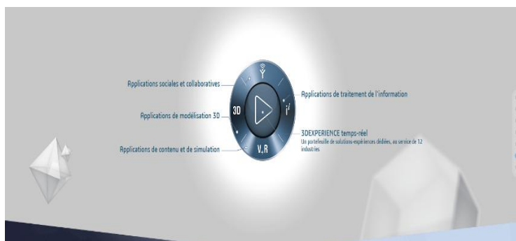
Figure 2 – Le PLM développé par Dassault Systèmes

Le PLM répond à l'objectif de maîtrise de la totalité des opérations d'élaboration de la valeur offerte au client. Il utilise pour cela toutes les technologies disponibles afin de rendre compatibles les bases de données relatives aux produits/services et aux méthodes. Le PLM se présente ainsi comme une méthode d'intégration des informations gérées par une ou plusieurs organisations afin de réduire les temps de collecte et de traitement de l'information. Il supporte donc la gestion de projet afin de réduire les temps de conception et de production (Paraponaris & alii., 2018). Désormais, les processus industriels de conception se déroulent massivement via des suites logicielles de conception numériques qui sont devenues indispensables pour la réalisation de la quasi-totalité des produits manufacturés. La diffusion de ces outils a été facilitée par la démocratisation des ordinateurs associée à l'accroissement de leurs performances (Bozdoc, 2004). « La puissance des suites de conception Product Lifecycle Management (PLM) et Product Data Management (PDM) permet de gérer numériquement des étapes clés telles que la conception d'usines, la commande de matière premières ou encore la gestion de la maintenance du produit au sein d'un unique environnement logiciel (Daloiz, 2010, Tornincasa et Di Monaco, 2010) ».