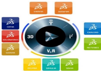
Figure 1 – L'offre logicielle de Dassault Systèmes

Dassault Systèmes assure sa forte croissance au cours des années 90 avec sa suite logicielle (plus de 10 systèmes) qui s'adresse à la totalité de l'industrie et une partie des services (figure 1). Cette offre consiste à mettre à disposition des moyens numériques pour aider ou faciliter : l'idée et la spécification du produit ; la conception grâce aux premiers modèles en 3D jusqu'à la réalisation de maquettes numériques complètes ; la simulation de l'utilisation des produits ; l'industrialisation virtuelle et la gestion des opérations de production ; la planification et l'optimisation des opérations ; le marketing numérique ; l'expérience d'achat des produits.