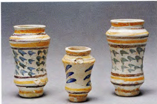
Fig. 6. Piluliers en émail polychrome rejetés dans les dépotoirs de l'atelier Favier, première moitié du XVII e s.