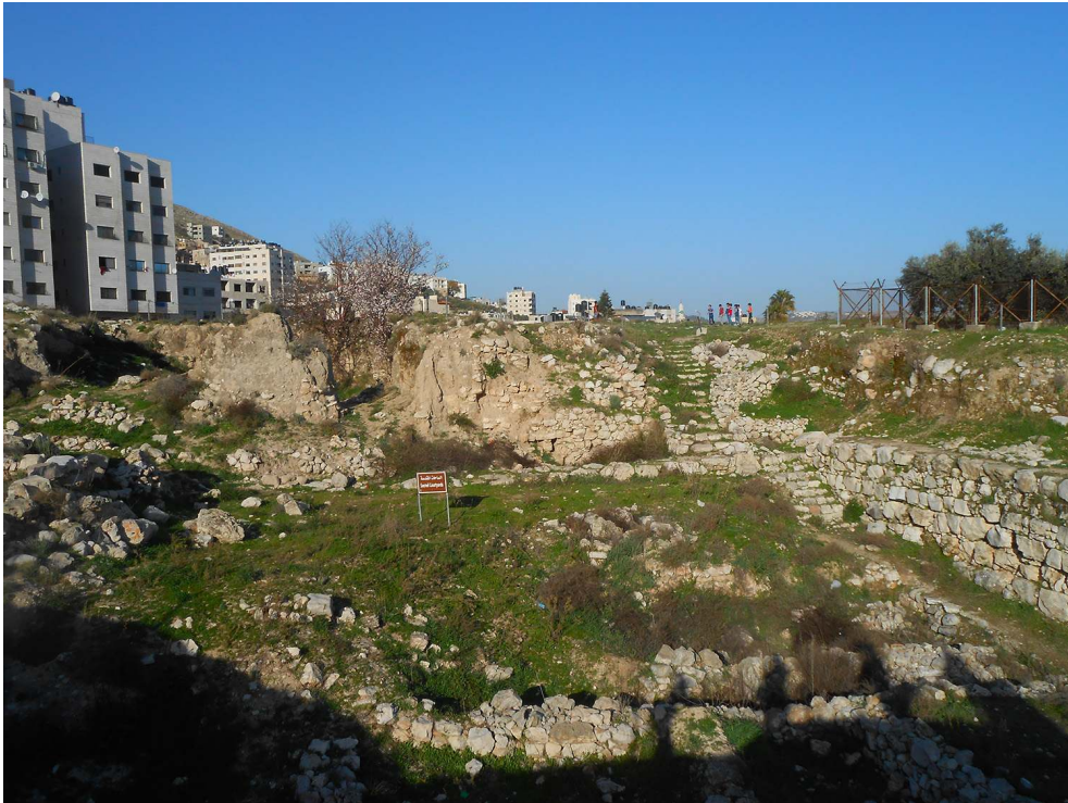
Figure 10 : Maison de la famille Masri en dehors de la vieille ville (Marie-Thérèse Grégoris, 2017)