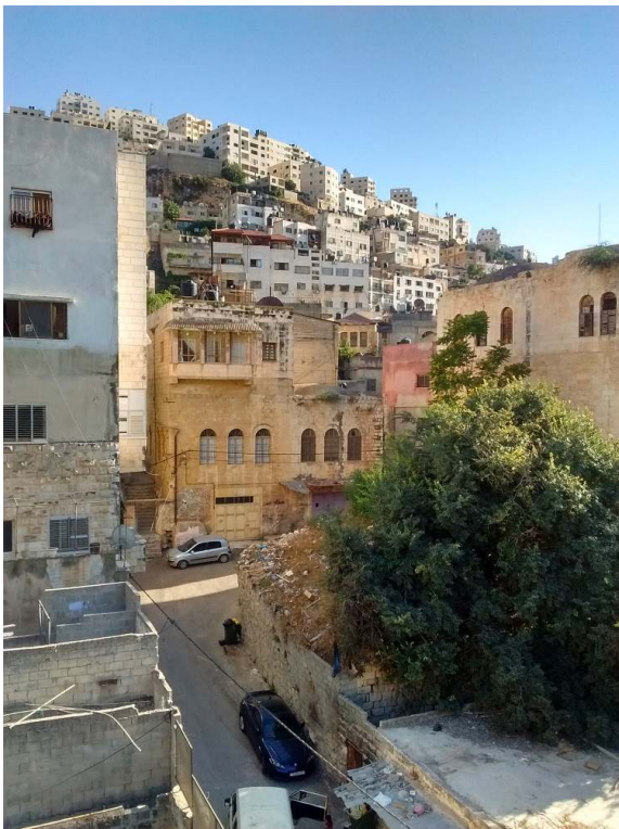
Figure 12 : L'urbanisation à Naplouse, grignotant le flan des montagnes (Elsa Bergery, 2017)