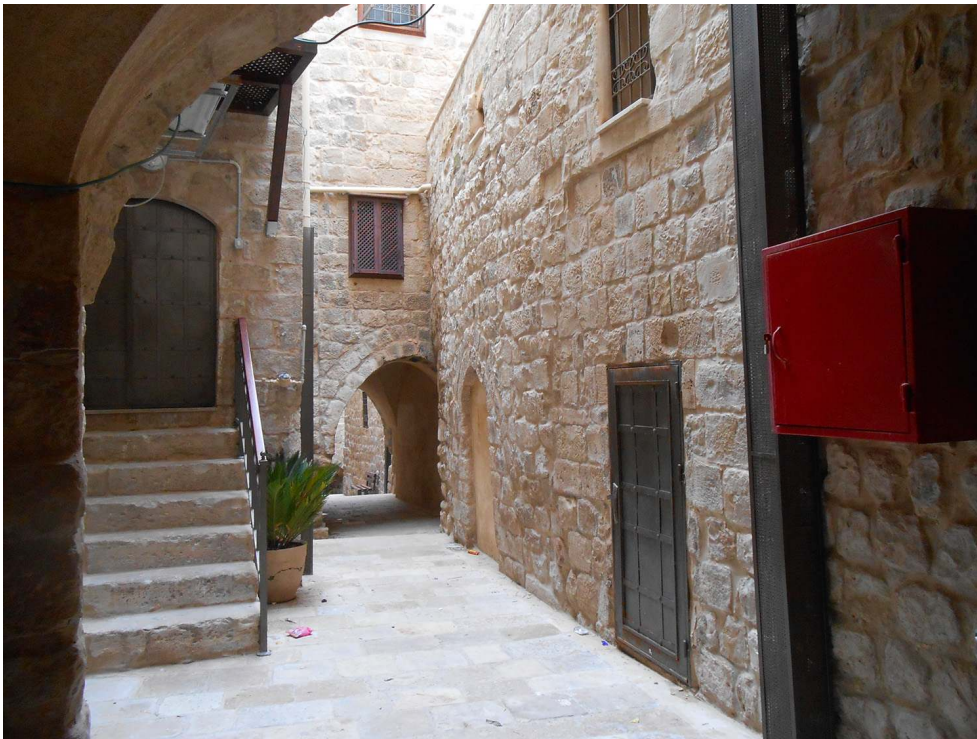
Figure 8 : Hawsh Al Atout-Al Fakhorah restaurés entre 2012 et 2014 (Marie-Thérèse Grégoris, 2017)