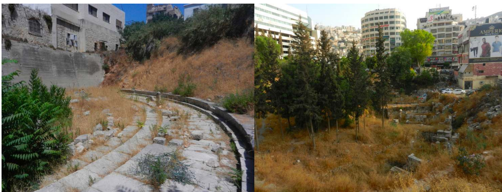
Figure 11 A-B : Les ruines du théâtre romain, à gauche, et de l'hippodrome, à droite, laissées à l'abandon et envahies par l'urbanisation (Elsa Bergery, 2017)