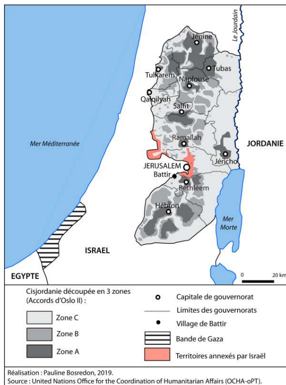
Figure 1 : Localisation de Naplouse en Cisjordanie

l'amélioration de son fonctionnement, notamment ce qui concerne la circulation automobile, l'extension du bâti résidentiel et commercial, la sauvegarde et la réhabilitation de la vieille ville. Le patrimoine – sa désignation et sa protection – est à peu près partout dans le monde un domaine éminemment régalien (même s'il est aujourd'hui concerné par la décentralisation, comme c'est le cas en France par exemple). Dans le contexte palestinien, l'Etat n'existe pas (encore ?), mais ce qui le préfigure – l'Autorité palestinienne – s'appuie en partie sur la construction d'objets patrimoniaux palestiniens pour légitimer et renforcer son existence et la cohésion d'une nation palestinienne. Les candidatures de plusieurs sites palestiniens à l'inscription sur la liste du patrimoine mondial – dont trois ont aujourd'hui abouti – sont un exemple de cette action patrimoniale de l'AP, permise par la récente reconnaissance de la Palestine comme Etat par l'UNESCO 1 .