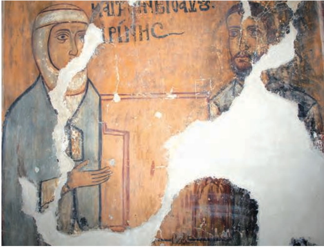
Figure 2. Portrait dédicatoire du ktitor Ioannis Gerakiotis, 1280. Détail.