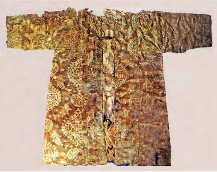
Figure 9. Robe d'enfant en damas de soie provenant du sultanat mamelouk, XIV e siècle. Musée d'Art Islamique du Caire. D'après Sardi 2016, p. 255, fig. 2.