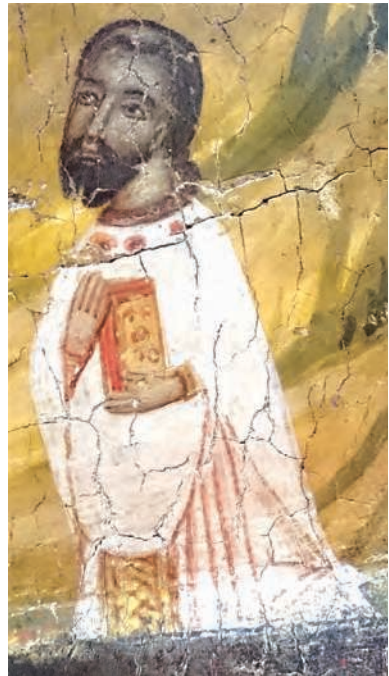
Figure 1. Icône de l'Ascension d'Élie provenant de l'église du Prophète-Élie, XIII e siècle. Détail.

Les Grecs, qui constituent toujours la majorité de la population insulaire, préservent leur identité et ne cessent de se considérer comme des membres de l'œkoumène byzantin. Ils conservent leur langue, leur culture écrite, leur foi et leurs pratiques cultuelles. Leur manière de se vêtir s'inscrit dans la tradition byzantine 9 , même si, comme nous le verrons plus loin, elle évolue au contact des autres cultures présentes dans le royaume.