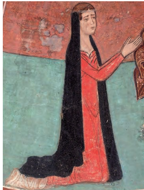
Figure 4. Femme en prière aux pieds de la Vierge de Miséricorde, vers 1300. Narthex de l'église de la Panagia Phorbiotissa à Asinou.

Musée de la Fondation Makarios III à Nicosie. D'après Durand, Giovannoni 2012, p. 289 cat. n° 126.