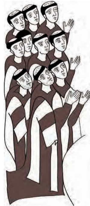
Figure 6. Retable de la Vierge des Carmes provenant probablement du couvent carmélitain ou de la cathédrale Sainte-Sophie de Nicosie, fin XIII e siècle. Musée de la Fondation Makarios III.

retire son casque en signe de respect correspond à une coutume latine contemporaine qui apparaît sur différentes sortes de supports en Occident 39 et à Chypre 40 .