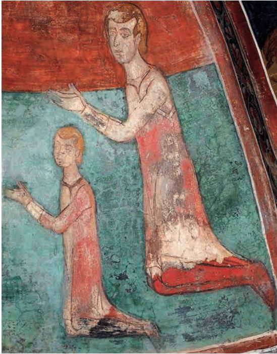
Figure 5. Jeune garçon et jeune homme en prière aux pieds de la Vierge de Miséricorde, vers 1300. Narthex de l'église de la Panagia Phorbiotissa à Asinou.