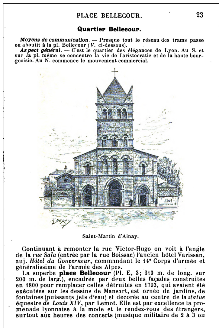
Figure 2 : A. Deroy, La façade de l'église Saint-Martin d'Ainay, gravure, extrait du guide Lyon et ses environs , 1905, p. 23 ( Bibliothèque municipale de Lyon, fonds ancien, inv. 374254 ).