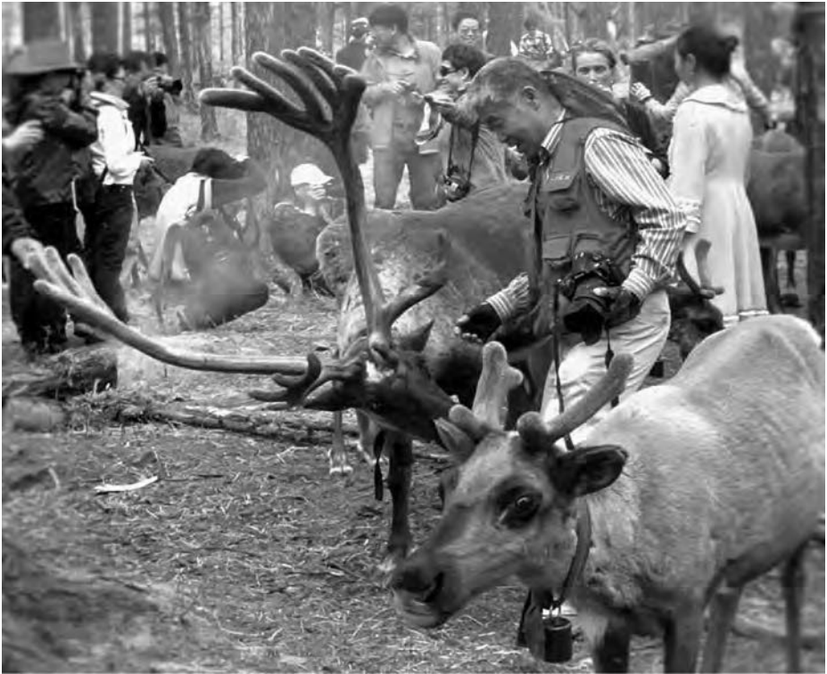
Figure 2 – Touristes sur un campement