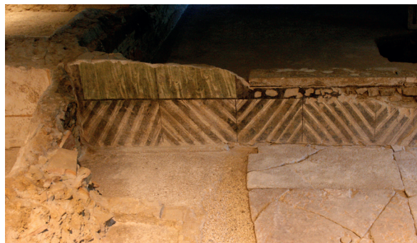
Fig. 4. Brescia, domus delle Fontane, décor de la cour 7 (cliché: auteur; sur concession du Ministero per i Beni e le Attività Culturali-Soprintendenza per i Beni Archeologici della Lombardia).

Cette hypothèse doit toutefois être validée à l'échelle d'une zone géographique étendue, en dépassant les études de cas, qui apportent des réponses pertinentes mais isolées. Le problème est d'autant plus aigu que, pour l'Italie septentrionale, rares sont les édifices ayant conservé leur plan complet et leurs élévations. Pour pallier ces difficultés, nous proposons de raisonner à partir de la confrontation systématique d'un panel d'informations, dont certaines sont disponibles même dans des contextes très perturbés. A ainsi été réalisée une base de données 15 qui permet de croiser différents éléments et, notamment, de mettre en relation décor et caractéristiques spatiales d'un espace - forme, dimensions, position dans le plan (centrale, sur un axe structurant, secondaire), accessibilité (nombre et dimensions des portes, présence d'un système de fermeture), luminosité (présence de baies donnant ou non sur l'extérieur, type et taille de ces baies) et visibilité depuis l'extérieur (depuis la rue, depuis un espace commun ou seulement depuis la maison). La fonction de la pièce est également prise en compte quand on peut la déterminer à partir de critères fiables comme certaines formes architecturales caractéristiques, 16 la forme du pavement 17 ou la présence de mobilier ou de structures associés à des usages précis.