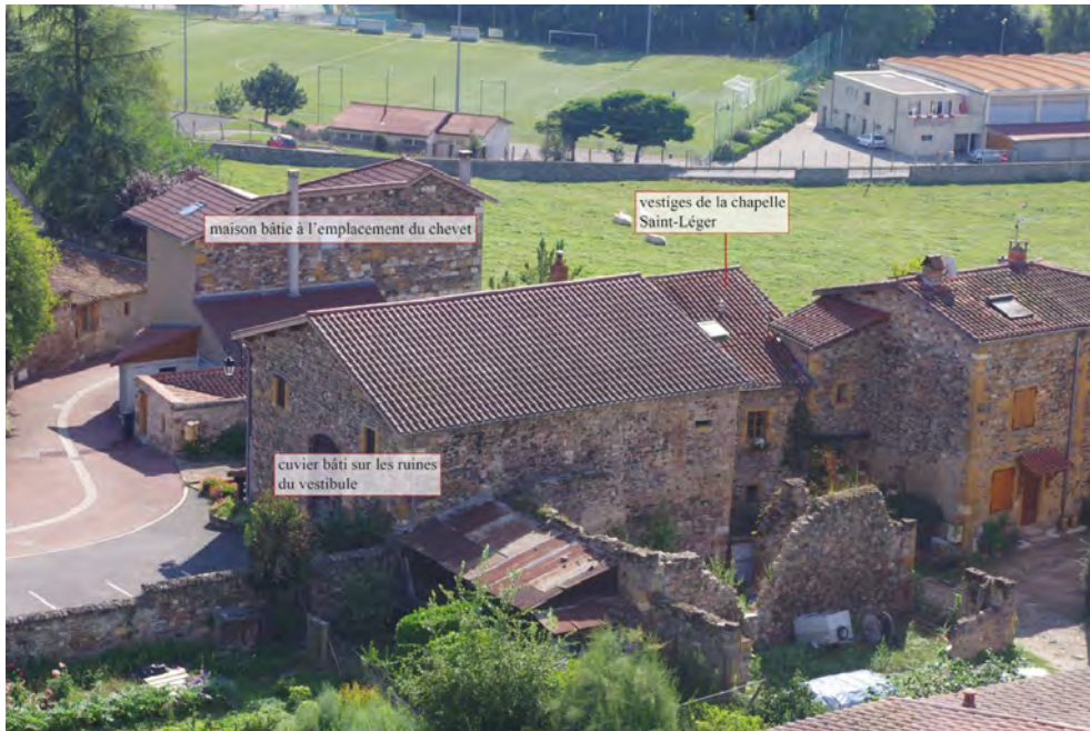
Figure 6. Vue actuelle des vestiges de l'église Sainte-Marie prise depuis l'ancienne tour d'entrée de l'abbaye.