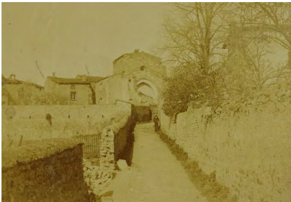
Figure 7. Vue ancienne des vestiges de l'église Sainte-Marie prise depuis l'est par Amédée Cateland (avant 1914).

Crédits : Musée historique de Lyon, Hôtel Gadagne (non inventorié).