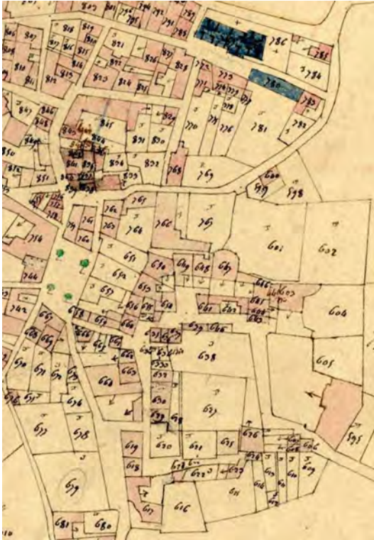
Figure 3. Plan cadastral napoléonien levé en 1830.

Aujourd'hui, leurs vestiges sont, pour la plupart, localisés dans des propriétés privées, donc masqués aux regards ; il est très difficile de les percevoir dans le paysage actuel (fig. 4).