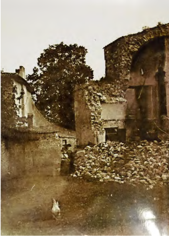
Figure 9. Vue ancienne des vestiges de l'église Sainte-Marie prise depuis l'ouest par Amédée Cateland (avant 1914).

Les ruines correspondent à la maison nord qui, en 1830, appartenait à Guillaume Chenevière.