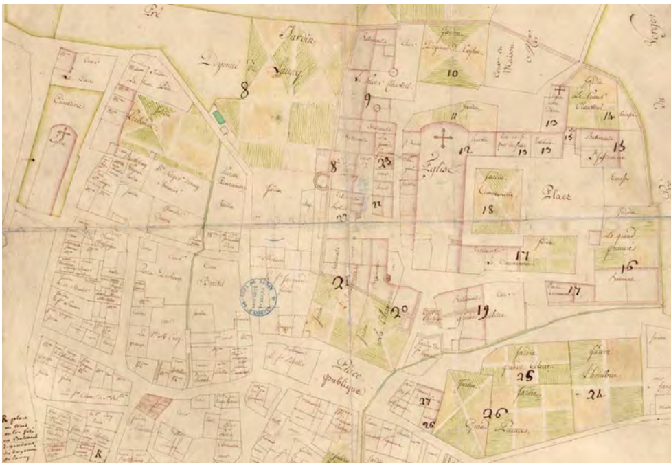
Figure 2. Plan parcellaire levé vers 1795 à l'occasion de la vente des bâtiments comme biens nationaux.

Les trois églises qui subsistaient à Savigny au XVIII e siècle sont représentées de manière schématique et se distinguent des autres bâtiments par une grande croix, qui orne l'emplacement de leurs sanctuaires respectifs. De gauche à droite, apparaissent ainsi la paroissiale Saint-André, puis l'abbatiale Saint-Martin et enfin l'église Sainte-Marie.