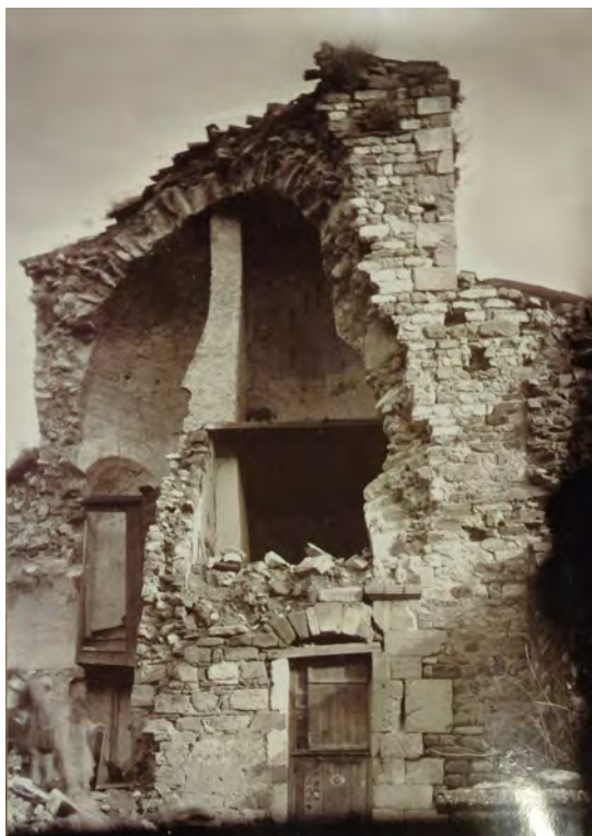
Figure 8. Vue ancienne des vestiges de l'église Sainte-Marie prise depuis le sud-ouest par Amédée Cateland (avant 1914).

La porte visible correspond à la maison sud qui, en 1830, appartenait à la veuve Delorme.