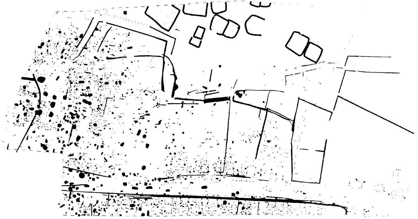
La Tène finale