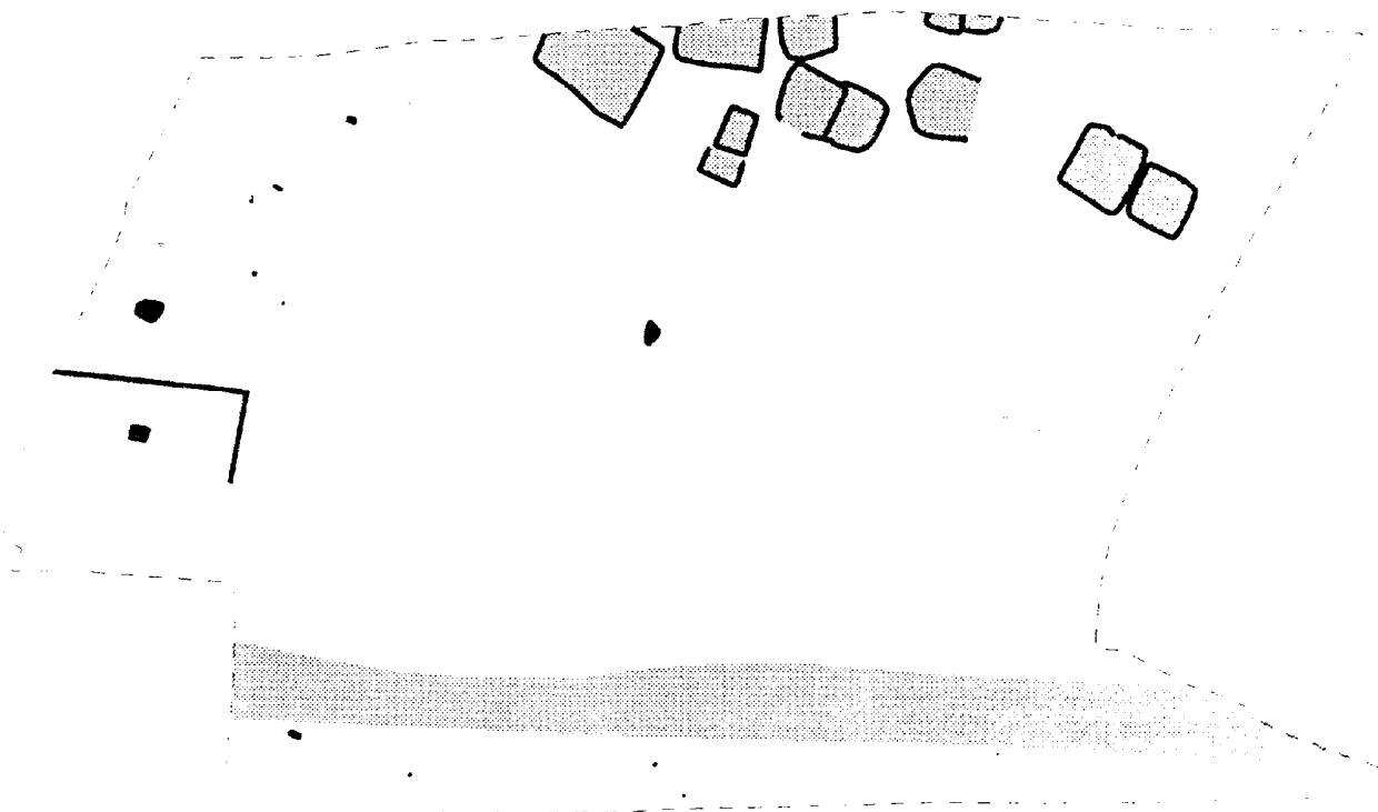
La Tène moyenne