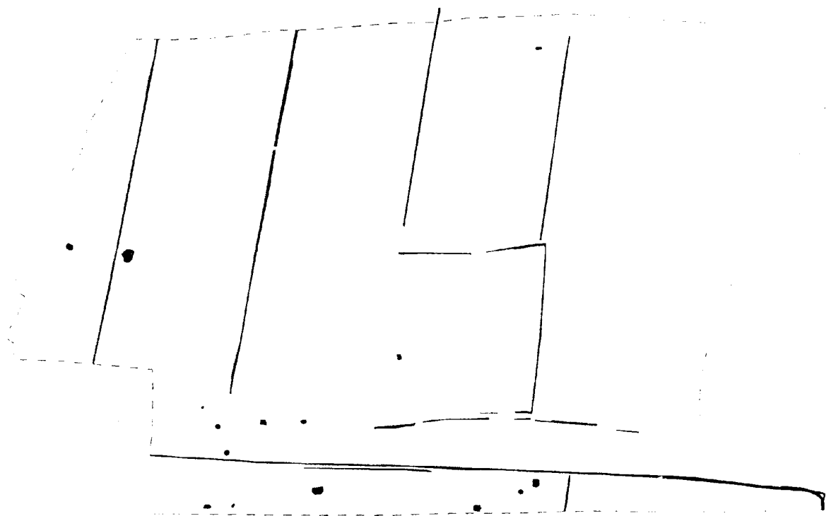
Début du 1er Siècle après J.C.

Saumeray "Le Bas-des-Touches" (Eure-et-Loir)