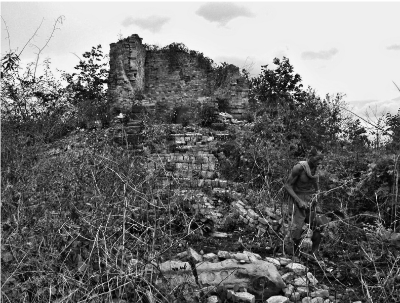
FIG. 3. – Photographie, prise par Bruno Bruguier le 5 mai 2003, du sanctuaire en ruine qui abrite l'inscription K. 1236.