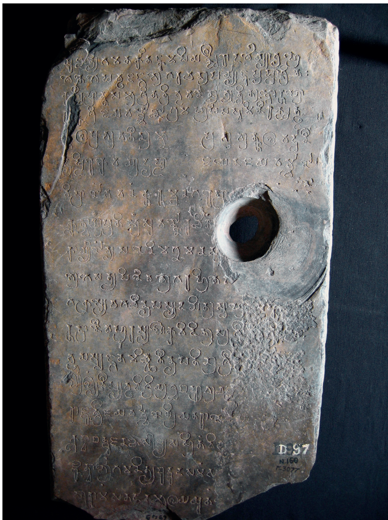
FIG. 1. – La dalle en schiste sur laquelle est gravée l’inscription K. 875.