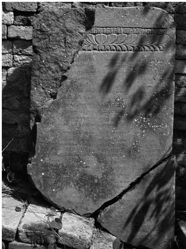
FIG. 5. – Photographie, [1745_14.jpg] prise par Bruno Bruguier le 5 mai 2003, de l'inscription K. 1236, estampée en 2004 par des prospecteurs de l'Inventaire des sites archéologiques du Cambodge (EFEO / ministère de la Culture et des Beaux-Arts) (estampages de l'EFEO n. 1765, n. 1766, n. 1767).

L'inscription se termine avec la mention de l'acte que l'inscription commémore, à savoir l'installation en 763 de notre ère d'une statue de Śiva portant le nom de Jayaikanātha. Pour ceux qui connaissent bien l'épigraphie cambodgienne, cette date va surprendre, car elle tombe au milieu d'une période obscure. Un grand nombre d'inscriptions datent du septième siècle et sont qualifiées de pré-angkoriennes