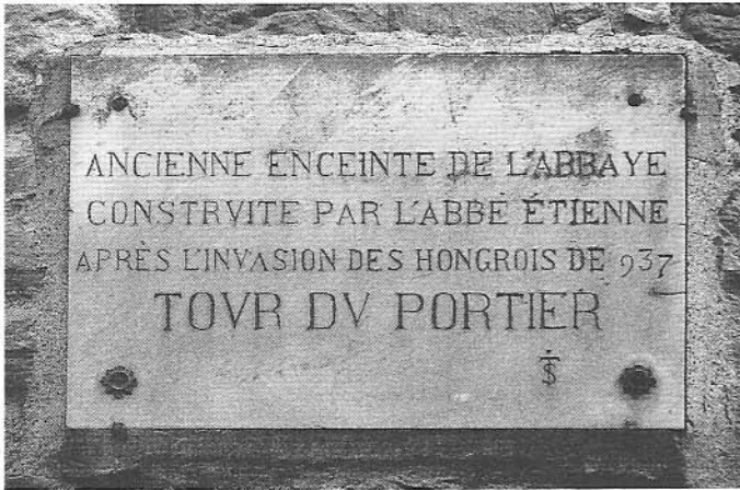
Ill. 3 : plaque commémorative sur les murailles de Tournus.