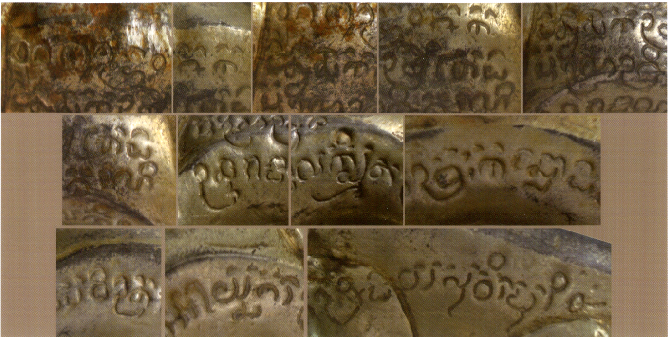
Fig. 12 : Inscription K. 1277.

effet une inscription de quatre lignes en khmer angkorien dont voici le texte :