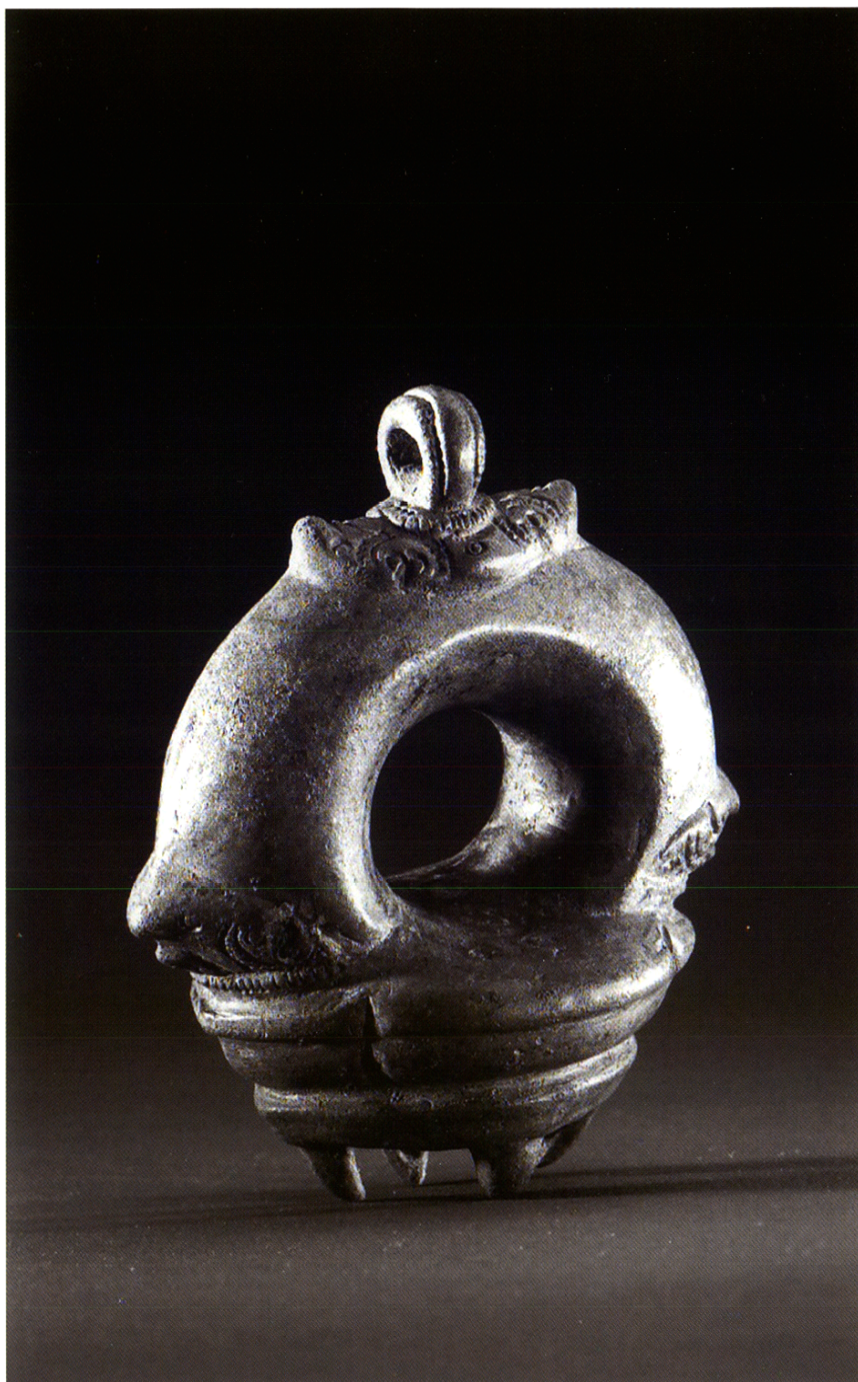
Fig. 3 : Pendentif conservé au musée Guimet (MA 5985) : bronze (fonte à la cire perdue) ; 7,5 × 7,5 × 4,5 cm ; XII e -XIII e siècle.

Bien que quelques rares autres exemples en soient connus – comme le modèle en bronze conservé au musée Guimet (fig. 3 ; LE BONHEUR 1994, p. 94-95), ou ceux du Vat Bo de Siem Reap (n° 2007-1-2128 et 2007-1-2031) –, la forme de ce bijou semble d'abord assez inattendue, en particulier pour un pendentif de cette taille et de ce poids. Cependant, l'observation des bas-reliefs d'Angkor Vat permet de