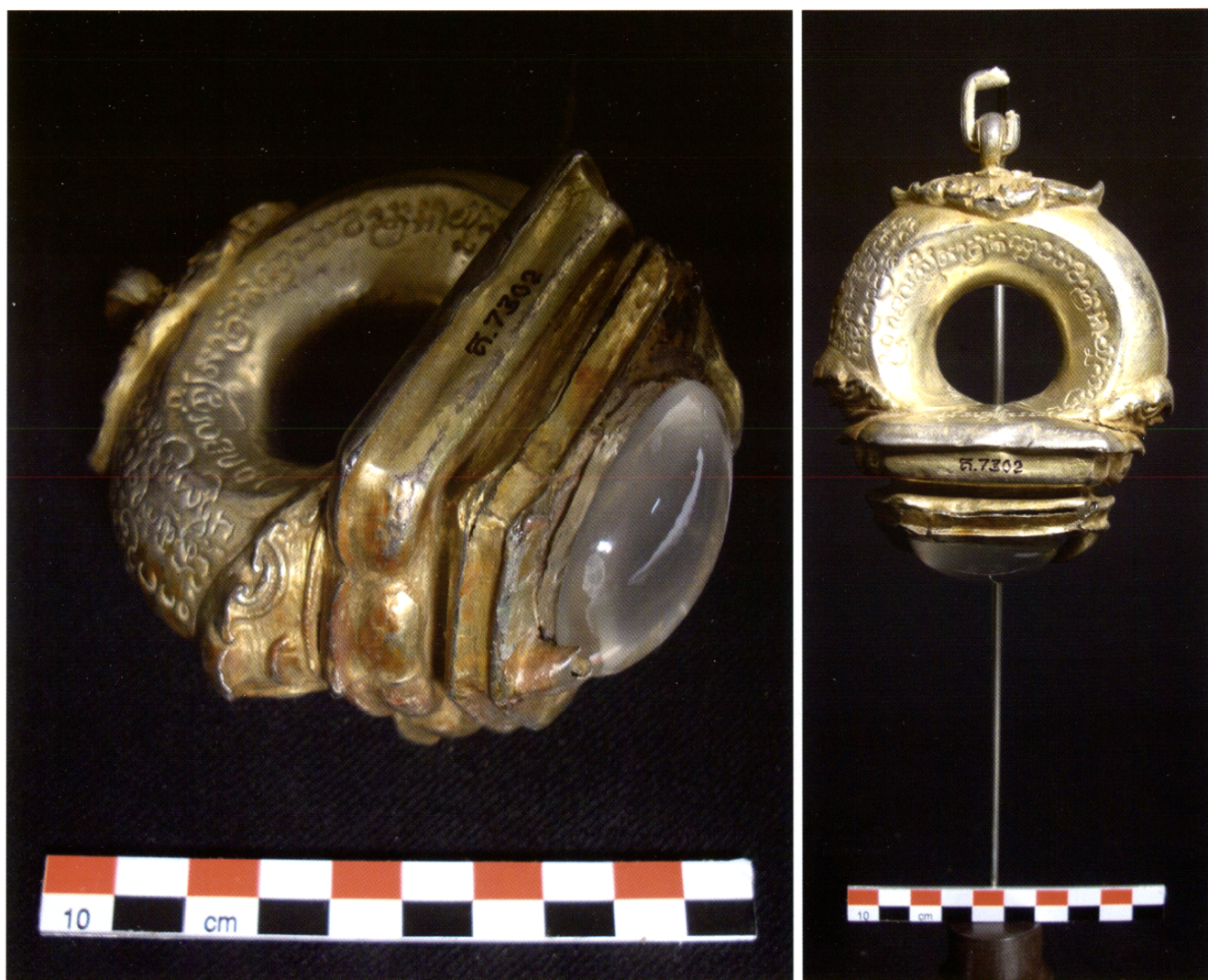
Fig. 1 et 2 : Pendentif inscrit conservé au musée national du Cambodge (ka 7302 ; inscription K. 1277) ; argent plaqué or et cabochon de quartz ; 10,8 × 9,2 × 5,9 cm ; XIII e siècle, (photos : Dominique Soutif).