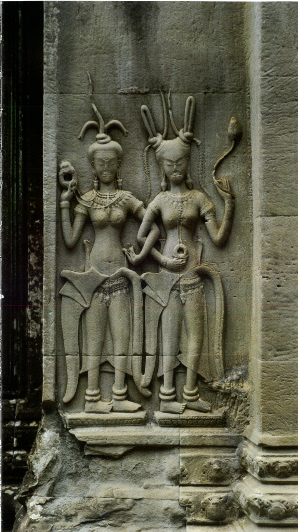
Fig. 4 : Devatā en bas-relief de la troisième enceinte d'Angkor Vat : première moitié du XI e siècle. (photo : Dominique Soutif).

constater que ce type de pendentif est loin d'être inhabituel et semble même avoir eu une importance particulière à cette époque. Il est en effet porté par une large proportion des devatā de ce temple, et parfois même clairement mis en avant par celles qui le portent (fig. 4) 2 .