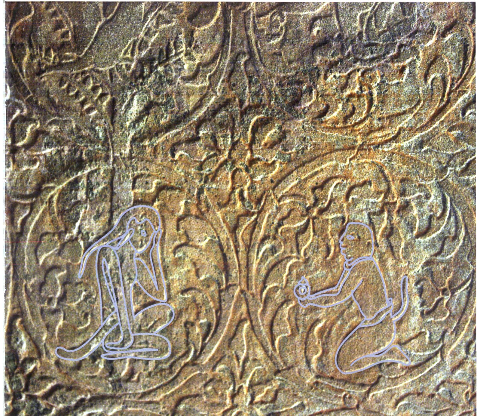
Fig. 10 : Rencontre entre Hanumân et Sîtâ, Angkor Vat. « motif de tapisserie » de la porte intérieure nord de la tour centrale ; première moitié du XI e siècle (vectorisation : Dominique Soutif).