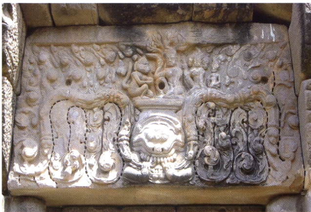
Fig. 5 : Rencontre entre Hanumân et Sītâ, Angkor Vat, pavillon d'angle nord-ouest de la troisième enceinte ; première moitié du XI e siècle.