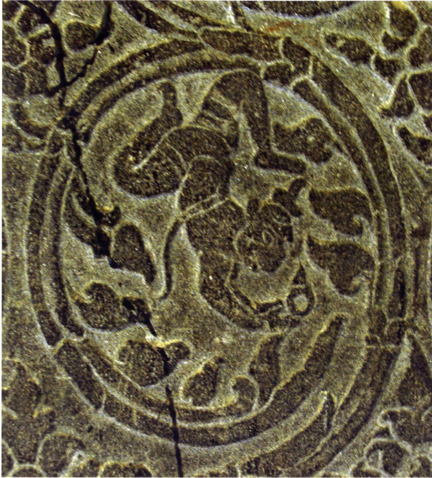
Fig. 9 : Hanumân bondissant au-dessus de l'Océan, Angkor Vat, « motif de tapisserie » de la porte ouest de la salle centrale du gopura extérieur ouest : première moitié du XI e siècle.

de ses vêtements, sans doute parce qu'il y était caché. Mais ce passage aurait pu amener à supposer qu'il s'agissait d'un ornement porté – et non dissimulé – dans le vêtement et donc contre la poitrine de Sītā et à interpréter alors le composé cūḍamaṇi comme un « joyau [de qualité] 'supérieure' » de torse, c'est-à-dire un pendentif (Dominic Goodall, communication personnelle, cf. Rāmāyaṇa 5.36.52 à 5.36.54).