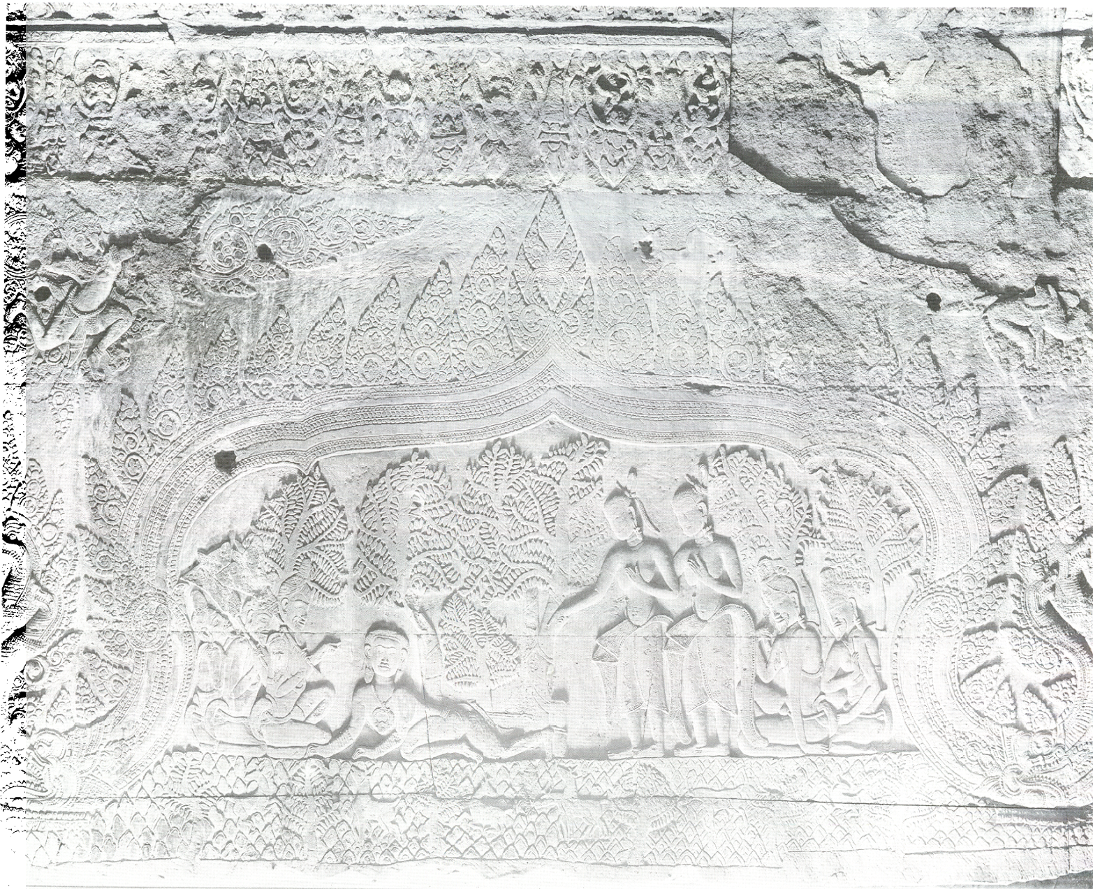
Fig. 11 : Kr̥ṣṇa renversant les deux arbres arjuna , Angkor Vat, pavillon d'angle sud-ouest de la troisième enceinte : première moitié du XII e siècle.

cette scène qu'avait proposée George Cœdès (1911, p. 192-193), il faut donc admettre qu'il s'agissait également d'une parure masculine. Mais ce qui est particulièrement troublant, c'est qu'ici, ce pendentif est porté par une autre incarnation de Viṣṇu. Faut-il alors supposer qu'il s'agit d'un joyau spécifiquement associé à cette divinité ? Si tel était le cas, on peut alors proposer que les devatā d'Angkor Vat portent ce pendentif comme un rappel de la confession vishnouite de ce sanctuaire. Il semble d'ailleurs qu'aucune des devatā du temple bouddhique du Bayon ne soit parée d'un pendentif de ce type, alors que, comme nous le verrons, la date inscrite