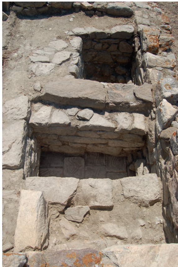
5. La pièce 48 et son dépotoir au premier plan, vus du nord.

Enfin, la fouille de 2014 nous a également permis de reprendre le mystérieux dossier des squelettes découverts par Chr. Le Roy en 1961 dans le bothros évacuant notamment les latrines de la maison. Afin de trouver le départ de la canalisation c, qui passe sous le mur 60 de la pièce 48, nous avons effectué un sondage dans l'angle nord-ouest de la pièce, à l'endroit où Chr. Le Roy avait identifié un dispositif de « table » aujourd'hui démonté et pour lequel nous ne disposons pas de photographie ancienne. Le sondage profond a révélé l'existence d'une canalisation d'1,50 m de profondeur et d'une largeur de 0,50 m, soigneusement maçonnée sur trois côtés, dallée de plaques de terre cuite et avec un pendage est-ouest permettant l'évacuation de ce qui apparaît comme un dépotoir de cuisine, d'après le matériel céramique associé au remplissage et à la pièce 48 dans son ensemble (fig. 5). Au fond du dépotoir et contre l'orifice de sortie ont été dégagés deux crânes dont l'analyse anthropologique devrait permettre de dire s'ils appartiennent aux deux squelettes découverts autrefois dans le bothros . À cette occasion, l'ensemble du dossier anthropologique sera repris et assorti d'analyses ADN. La découverte a en tout cas permis de confirmer qu'il s'agissait de squelettes antiques, probablement du milieu du I er s. av. J.-C., période à laquelle la Maison de Fourni est abandonnée.