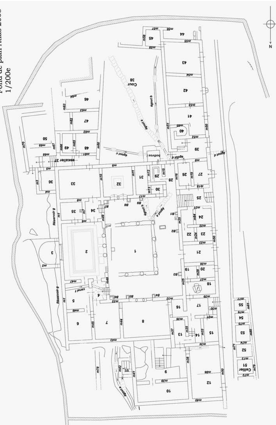
1. Plan de la Maison de Fourni. Fond de plan relevé en 2008, Atlas de Délos, EAD XLIII, ÉfA, 2015. Compléments et numérotation St. Zugmeyer et H. Wurmser.