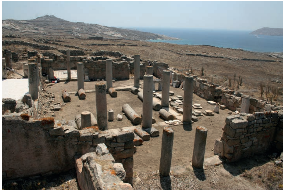
2. Vue générale du péristyle depuis le nord.

connaissances, dans les maisons hellénistiques, on en trouve un exemple fameux dans la Casa Romana de Cos, datée pour sa construction du milieu du II e s. apr. J.-C. 9 La disposition utilise à la fois les caractéristiques de la grande exèdre à colonnes, dont nous reparlerons, et celles du péristyle rhodien pour créer une forme nouvelle, tout à fait efficace dans les pièces de représentation et de prestige et dont l'exemple délien serait un précédent particulièrement précoce.