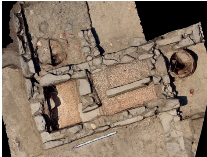
4. Photogrammétrie redressée de la zone sud en cours d'élaboration. Au premier plan, la cuve et son aire de foulage.

de stockage au moment de l'incendie 21 . Pour le moment, un quart seulement du pithos a été fouillé et nous n'en avons pas atteint le fond.