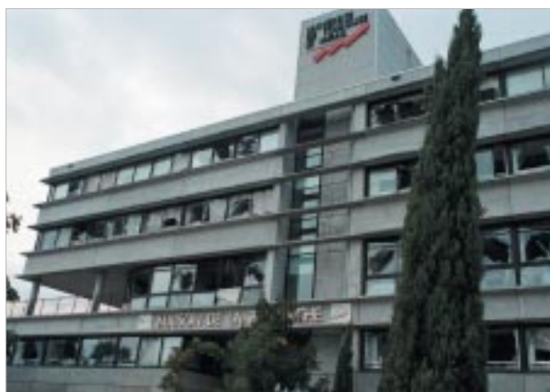
4. La Maison de la Recherche (Université du Mirail), bâtiment abritant le CIEU, auteur de l'article...

Justement, une grande partie du débat local se focalise sur le maintien ou non de la chimie dans la ville. Les associations les plus en pointe réclament un arrêt définitif de l'activité