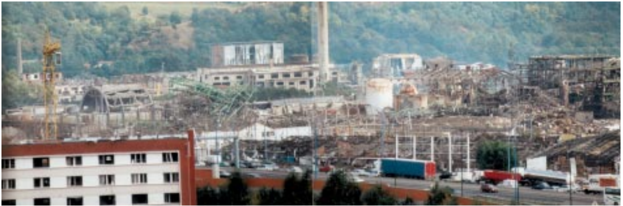
2. L'usine AZF le 23 septembre 2001, vue depuis le 14 e étage de la tour de Seysse (© Pierre Lacoste, architecte)

les écoles, alors que le préfet prenait au bout d'une heure (soit bien après la dispersion du nuage) une mesure de confinement de la population. Mesure peu applicable dans les quartiers les plus touchés, où toutes les vitres avaient été soufflées et où beaucoup craignaient l'écroulement des immeubles. Les consignes contradictoires d'évacuation ou de confinement observées dans les établissements accueillant du public en disent long sur l'impréparation et la confusion des esprits. La faillite des mesures de protection civile est patente ; fort heureusement, l'accident n'a donné lieu à aucune dispersion de produits toxiques dans l'atmosphère. Que se serait-il passé dans le cas contraire ?