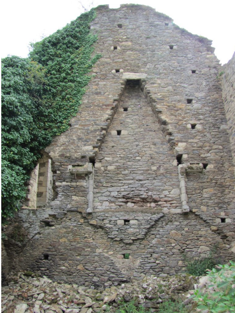
Cheminée du château de Châlucaud en Haute-Vienne.

Certaines tendances actuelles laissent par ailleurs quelque peu songeur l'historien de l'alimentation : les régimes locavores et végétariens privilégiant les produits locaux, le pain de céréales rustiques et les légumes de saison rappellent l'alimentation paysanne médiévale, fortement dévalorisée à cette époque qui valorisait au contraire la viande et les produits de provenance lointaine : une véritable inversion des valeurs ! Le lait d'amandes, remis au goût du jour par les régimes végétariens, était lui jadis un produit star des recettes culinaires et diététiques. Réminiscence médiévale ?