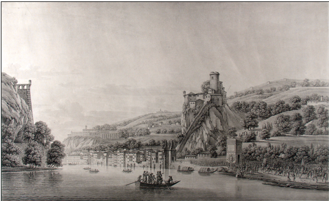
Figure 4 : Benedikt Piringer, Vue du fort de Pierre-Cise et de l'entrée solennelle d'Henri IV à Lyon en 1595 , 1819, gravure, Lyon, musées Gadagne, inv. N 103 b.

Dans les années qui suivent cette démolition, une certaine nostalgie transparaît dans les représentations iconographiques et littéraires. Quelques images du château, dessinées avant la Révolution, sont gravées et diffusées dans les années 1810. C'est le cas des vues de Jean-Pierre-Xavier Bidauld 36 et Joseph Fructus 37 . Plusieurs représentations à visée commémorative sont également réalisées au début du XIX e siècle. La plus représentative de ces images est une estampe publiée dans le Voyage pittoresque et historique à Lyon de François-Marie Fortis, qui est une reconstitution de l'entrée d'Henri IV à Lyon par la porte de Pierre-Scize en 1595 (fig. 4). Cet épisode historique est l'occasion de représenter les éléments fortifiés, porte et château, qui ont été rasés pendant la Révolution.