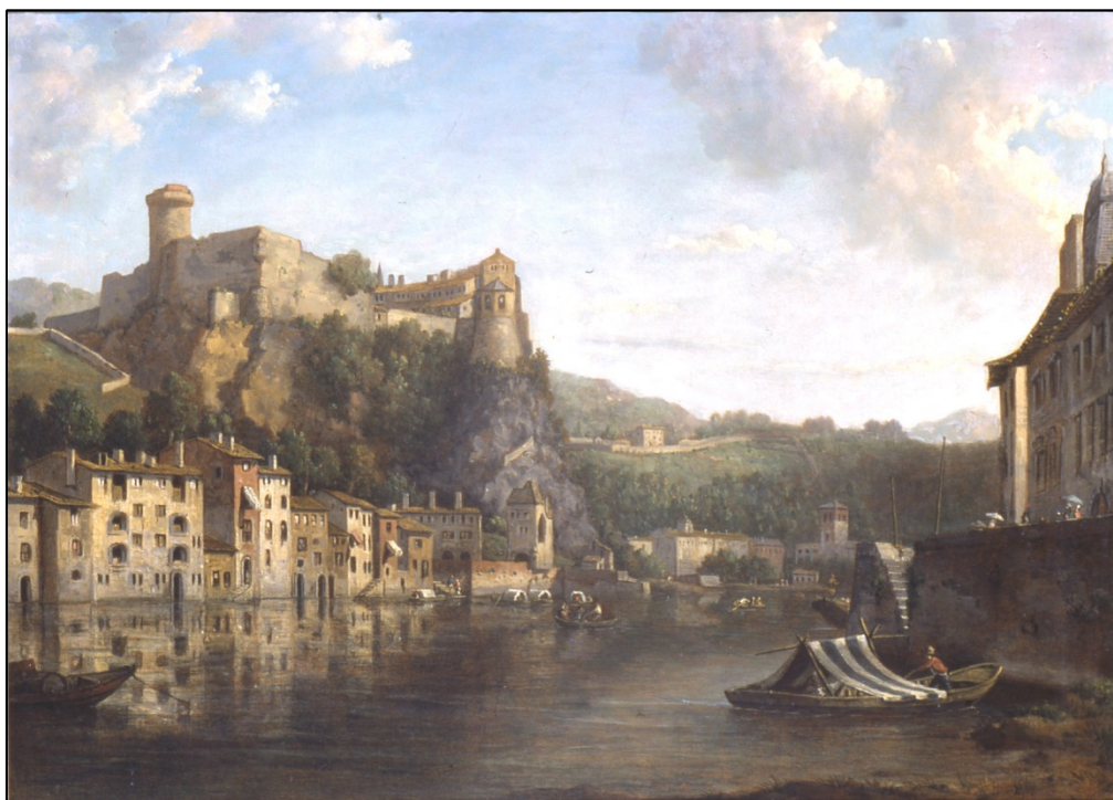
Figure 3 : William Marlow, Château de Pierre-Scize , fin XVIII e siècle, huile sur toile, 56,5 x 76,8 cm, musées Gadagne, inv. 98.6.

Pierre-Scize, en latin Petra excisa , est un rocher qu'Agrippa fit couper lorsqu'il construisit ces fameux chemins que les auteurs latins nomment voies militaires 34 .