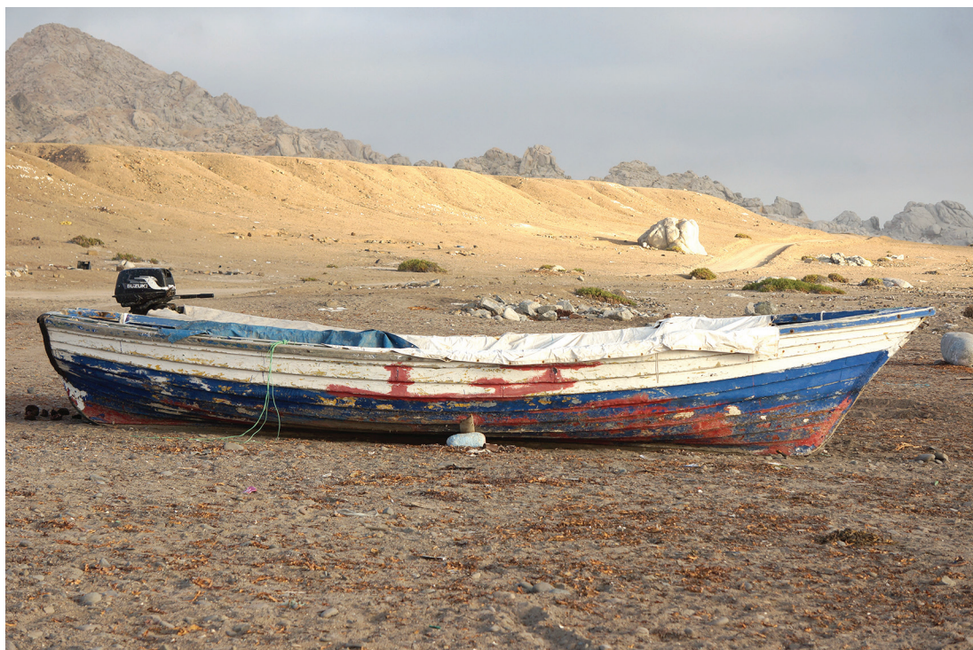
Figura 2. Bote de madera con motor 30 hp. Guanillos. Julio 2019.

Estos motores Yamaha o Suzuki son característicos de una “segunda motorización” ocurrida en el litoral chileno. La primera motorización, durante los primeros tercios del siglo XX, es siempre con motor fijo. Se motorizaron barcos, lanchones y botes con cubierta, pero siempre con un motor encastrado a la nave. A diferencia del motor fijo, que supone rediseñar el bote para acogerlo, protegerlo y sujetarlo a una columna suficientemente central y sólida, el motor fuera de borda está pensado para motorizar un parque náutico sin tener que reemplazar las embarcaciones existentes. A eso debe su éxito planetario. Mientras los motores fijos tendieron a uniformizar el parque de embarcaciones, los motores fuera de borda hicieron proliferar los híbridos: primitivas canoas amazónicas o polinési-