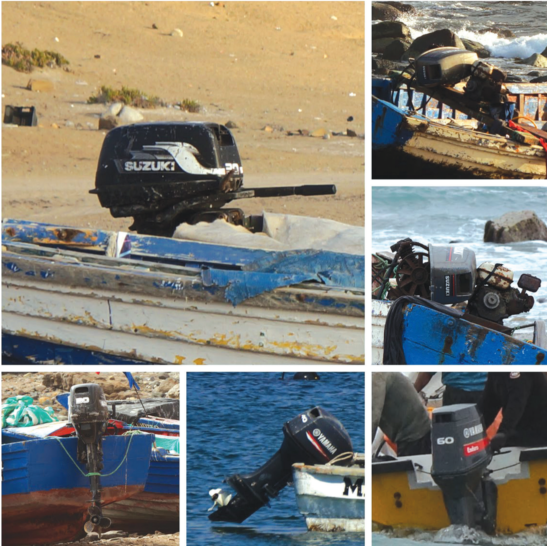
Figura 1. Motores fuera de borda. Taltal, Las Guaneras, Guanillos. Julio-agosto 2019.

el litoral del África occidental (Cormier-Salem 1995). Existen en efecto motores fuera de borda desde fines del siglo XIX pero con una escasa difusión, baja potencia, reservados generalmente a estuarios y lagos. Su masificación a gran escala se debe al desarrollo, en la década de 1970, de una nueva generación de motores de dos tiempos liderada por los fabricantes japoneses Yamaha, Suzuki, Kawasaki, Tohatsu, que también revolucionaron el