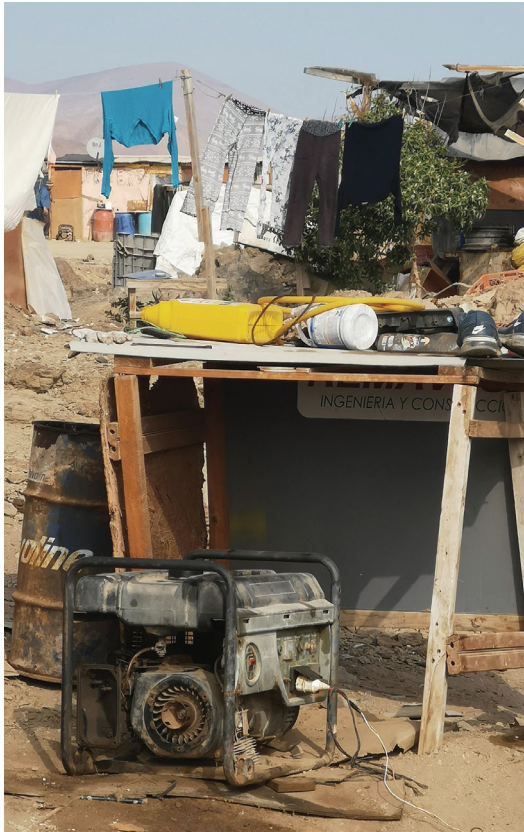
Figura 8. Moto-generador eléctrico de 2000 w, en reparación. Las Guaneras. Julio 2019.

eléctrica o el compresor de un congelador. Es un generador integrado, en el sentido que el motor y el generador están sujetos al mismo chasis metálico. Si no lo estuvieran, se vería que el motor es exactamente el mismo que el del compresor de aire para los buzos. En el caso de ser un generador Honda de 2000 w, sería un motor Honda GX de 160 cc y 5 hp. O sea, que hay en esta caleta dos veces el mismo motor, solo que integrado en dos objetos técnicos distintos, es decir realizando dos trabajos distintos.