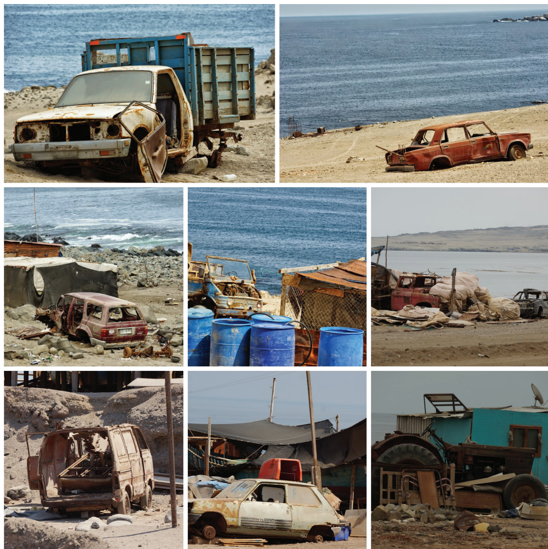
Figura 9. Carcasas mecánicas sobre el borde costero entre Paposo y Caleta El Cobre.

te de las caletas, son ante todo excelentes choferes. Tal individuo, rememorando la época en la que trabajaba mariscando en Caleta El Cobre, decía que sacar erizos era una tarea fácil frente al enorme desafío que significaba ir a venderlos: el viaje a Antofagasta, por una huella entre los barrancos del desierto, tomaba más de seis horas de lucha y varios neumáticos perdidos. Era injusto, decía, que solo lo trataran de buzo, porque lo que más orgullo le daba era haber sido durante veinte años el único capaz de remontar