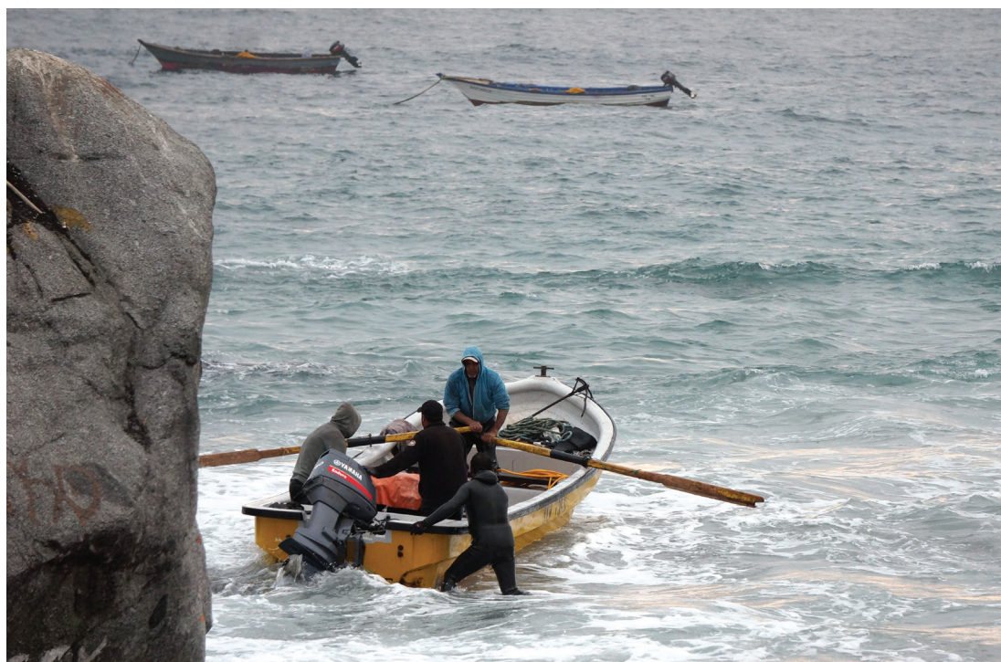
Figura 3. Bote de fibra de vidrio con motor de 60 hp. Guanillos. Julio 2019.

Los motores de 60 hp también presentes en la muestra, suponen, en cambio, un límite técnico. Si un motor muy potente empuja un bote muy pesado, lo más probable es que el punto de fijación, que en general es de madera, salte por los aires. Hay dos soluciones posibles a este problema. O bien se refuerza la fijación con pernos y chasis, arreglo que hace que el motor deje de ser fácilmente desmontable (como en el caso de las lanchas deportivas). Otra opción es alivianar la embarcación para reducir la tensión sobre el punto de fijación del motor. Esta última parece ser la solución preferida en el caso de los motores de 60 hp presentes en nuestra muestra, ya que solo empu-