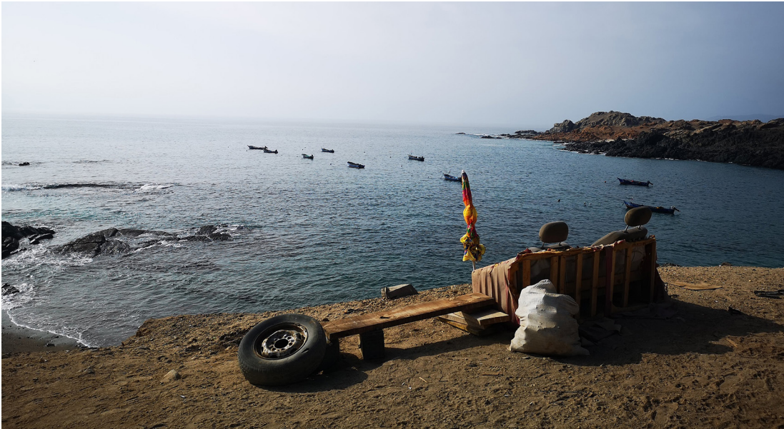
Figura 11. “El sillón de los lamentos”, asientos de una camioneta Toyota en caleta Las Guaneras.

los motores, los cables, los asientos, los alternadores, las luces, etc. ha sido reutilizado.