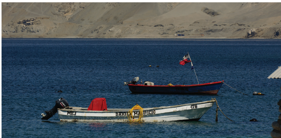
Figura 7. Botes de buceo con motor fuera de borda y compresor integrado. Mejillones, Punta Cuartel. Julio 2019.

accionaba la manivela. Si se lo compara a una foto actual (figura 7), uno de los tripulantes fue reemplazado por el pequeño motor de 5 hp que en adelante se ocupará del compresor. Como consecuencia de lo cual, un bote de buceo artesanal a partir de la década de 1980 es un bote más pequeño, no especializado, con motor fuera de borda y con solo dos tripulantes.