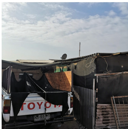
Figura 10. Caleta con solo camionetas Toyota.

cas que se acumula sobre el borde costero y que permitirían una arqueología mucho más detallada de estos motores terrestres de la caleta (figura 9). Son como naufragios al revés, restos de máquinas que la tierra botó al mar.