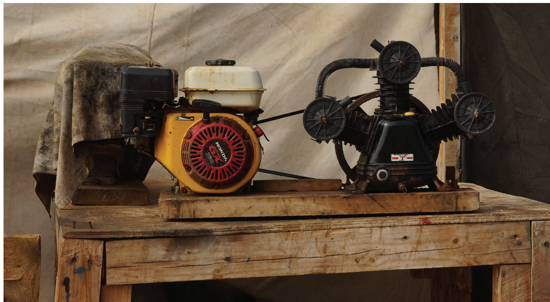
Figura 5. Compresor de aire artesanal: motor de 5 hp, correa y cabezal de compresión de 3 pistones sobre chasis de madera. Las Guaneras. Julio 2019.

integrado, que es el objeto de la figura 4, el mismo que fue repartido por el gobierno. Desde junio del 2018 este tipo de equipo es obligatorio para el buceo artesanal. Los antiguos compresores fueron todos, al menos teóricamente, jubilados (figura 5). Este compresor es comercializado por la empresa EMARESA como “Compresor de Pesca Artesanal Integrado de 90 Litros” diseñado para “Mariscador básico, 2 buzos a 20 m” (EMARESA s/f). Distintas maestranzas producen estos equipos. Los que entrega el gobierno son montados por la Maestranza Vulcano S.A. La razón de que estos compresores sean de marca EMARESA o VULCANO a pesar de que ni EMARESA ni VULCANO fabriquen motores ni cabezales de compresor, es que lo que se está vendiendo -además de la certificación de la Armada-, es el hecho de que las partes vengan integradas en un mismo chasis y sobre todo, que es lo que sí fabrican EMARESA y VULCANO, que disponga de un acumulador de acero seguro, que pueda limpiarse y esté bien