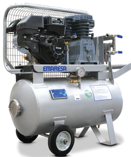
Figura 4. Compresor de Pesca Artesanal Integrado de 90 L para mariscador básico, 2 buzos a 20 m, marca EMARESA.

El segundo motor corresponde al pequeño motor estacionario que va sobre el bote y que acciona el cabezal del compresor de aire para los buzos (figura 4). De todos los motores de la caleta, éste es el más crítico en varios sentidos. Primero, porque cuando se echa a andar, es el responsable directo de mantener con vida a