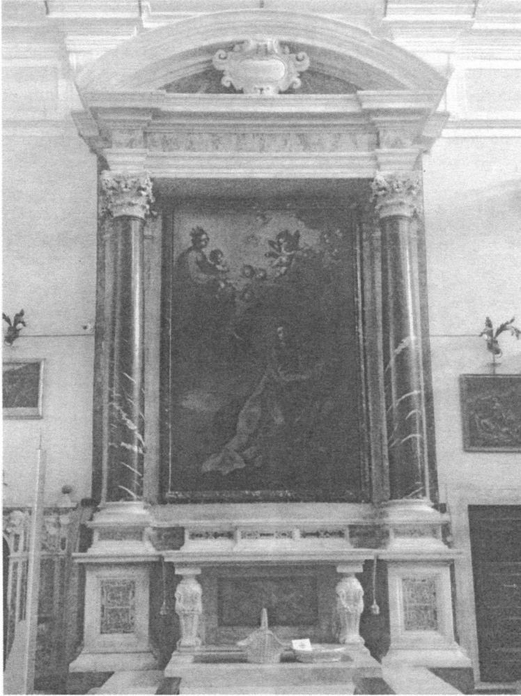
FIG. 1. Altare di San Giovanni Evangelista (detto «Altare dei Corsari»), chiesa della Madonna (1620-30), Livorno.

Pertanto, lungi dal limitarsi ai confini della città, la storia della chiesa della Madonna e della sua fondazione dà conto, più ampiamente, del contesto mediterraneo in epoca moderna, in particolare delle relazioni al tempo stesso ostili ed economicamente vantaggiose tra la Toscana e il Nord Africa ottomano – relazioni che i mercanti e i marinai corsi contribuirono largamente a modellare e a coltivare 7 . Attraverso questo altare e questo patronato collettivo, cercherò di studiare, in queste pa-