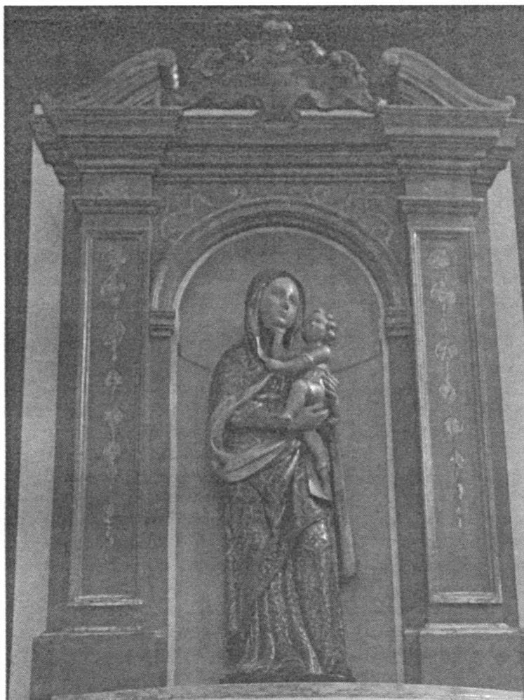
FIG. 3. La Madonna del Carmine, Livorno, chiesa della Madonna.

Una serie di rescritti del granduca Ferdinando ordinò infine la costruzione della chiesa e del convento dei francescani, i cui progetti furono affidati all'«architetto della Fabbrica di Livorno», Alessandro Pieroni, un allievo di Bernardo Buontalenti, a cui si devono il tracciato e le fortificazioni della Livorno moderna. Pieroni disegnò anche i progetti della sinagoga cittadina, fondata nel 1603, così come quelli della chiesa dei greci «uniti» (cattolici di rito bizantino), eretta a partire dal 1606.