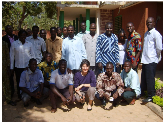
Forum « Patrimoines africains: réussir ensemble notre nouvelle coopération culturelle » Projet : « Copie et rapatriement des archives sonores du Burkina Faso », Paris, Institut Français, 04 juillet 2019

La demande de l'État français de restituer les œuvres culturelles ajoute un paramètre supplémentaire. Des enregistrements réalisés lors de mission de recherche avec l'accord oral des participants mais sans accord écrit sont-ils considérés licites ou non ? Comment connaître le contexte d'une collecte faite il y a 50 ans ? Ce projet de restitution met en lumière de nouveaux défis, tant en matière de coopération interculturelle qu'en matière d'infrastructures nécessaires pour la pérennisation des données et pour un partage plus équitable.