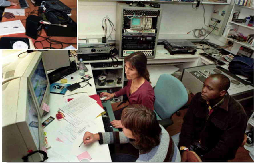
Collections « PEULS » du Burkina Faso, stage 2007