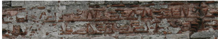
Fig. 9 : Inscription de la tour 55

. . . Λέον]τος καὶ Κωνσταντίνου. . . βασιλέω]ν ? πολὰ τὰ ἔτ[η] ...de Léon et Constantin...basileis. Nombreuses années.