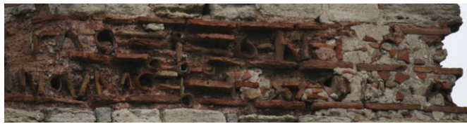
Fig. 6 : Inscription de la tour 45

[+ Νικᾶ ἢ τ]ύχη Λέοντος [καὶ Κωνσ]ταν[τ]ίνου μεγάλ[ω]ν [βασι]λέ[ων] Triomphe la fortune de Léon et de Constantin, les grands basileis.