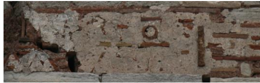
Fig. 5-2 : Inscription de la tour 25

+ [Λέοντος καὶ Κωνσταν]τίνου + + μ[ε]γάλων [βασιλέων καὶ αὐτοκρατόρων] πολλὰ τὰ ἔτη +