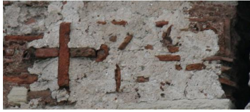
Fig. 5-1 : Inscription de la tour 25