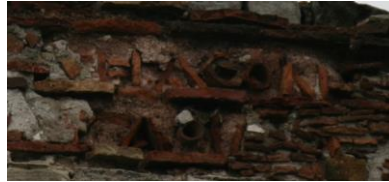
Fig. 7 : Inscription de la tour 48

Νι[κᾶ ἢ τύχ]η Λέοντ[ος καὶ Κωνστα]ντίνου μεγά]λον [βασιλέων καὶ αὐτ]οκ[ρ]α[τ]ορ[ων] Triomphe la fortune de Léon et Constantin, grands basileis (?) et autokratôres.