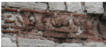
Fig. 10 : Inscription de la tour 56

+ Λέων καὶ Κ[ωνσταντῖνος] . . . ἐ]ν θεῶ νικ[ηφόροι] ? (Tour de) Léon et Constantin...Dieu, vainqueurs... ?