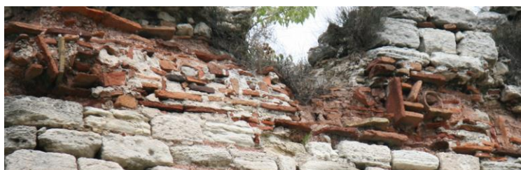
Fig. 12-2 : Inscription de la tour 63

-- -]E . / [ . 3 . ] VONOE . . Χ . KAI | ΘΕΥ_Ο [ . . . 9 . . . ] . Ο [ . . . ] . . .]καὶ Θεοδο[ . . . ]