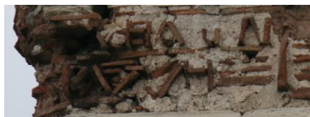
Fig. 4 : Inscription de la tour 18

Ἰησοῦς Χριστὸς νικᾷ. Λέ[ο]ντος [κ]αὶ Κων[σ]ταντίνου [με]γάλ[ον βασιλέ]ον καὶ αὐτοκ[ρ]ατώρον, πολλ[ὰ τὰ ἔτη.]