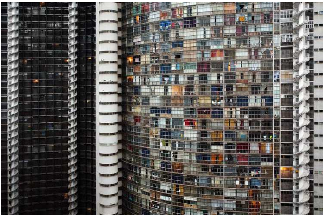
Photo 7 Immeuble du centre de São Paulo