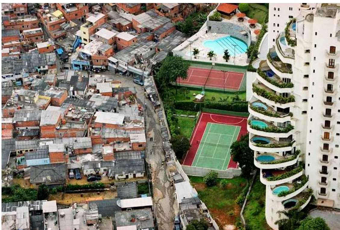
Photo 1 Inégalité