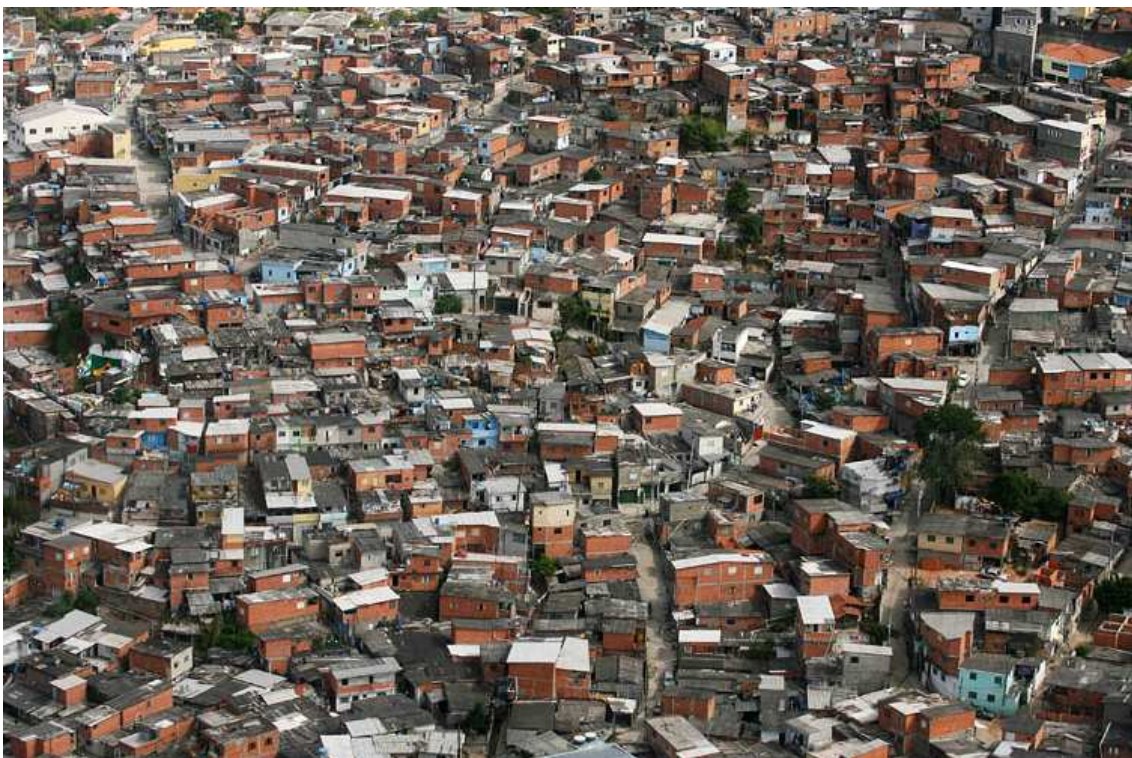
Photo 5 Favela de São Paulo