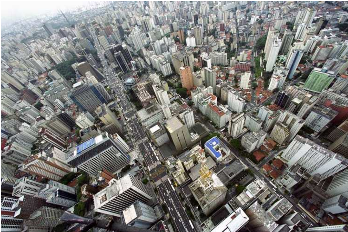
Photo 6 L'Avenida Paulista, au centre de São Paulo