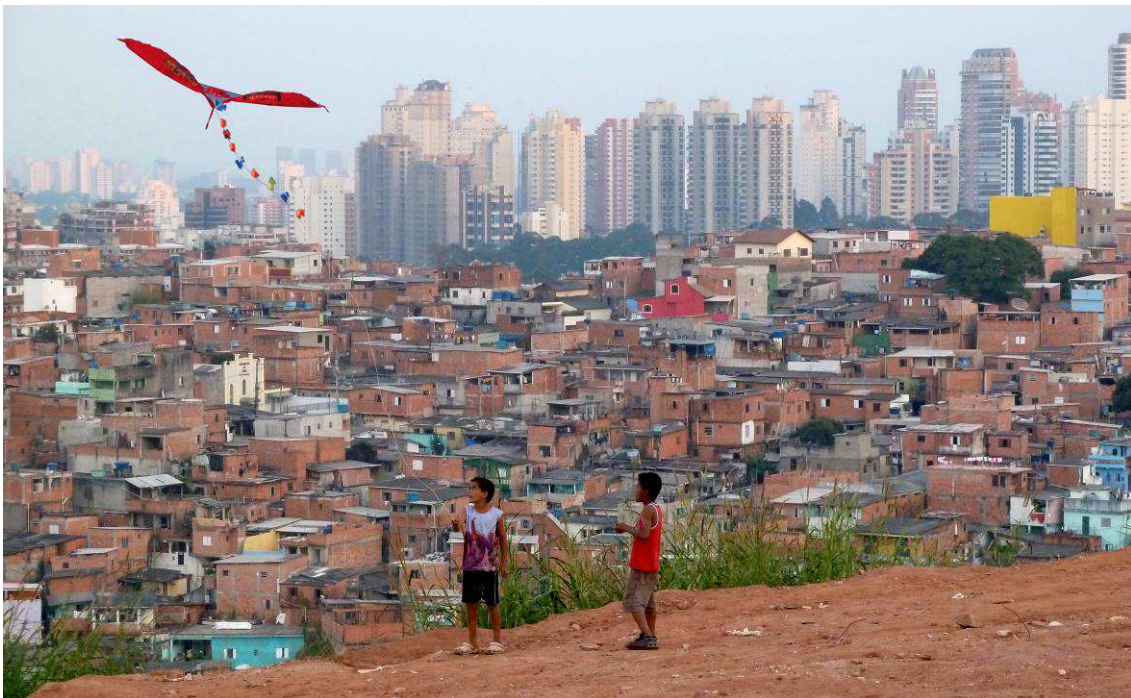
Photo 4 Enfants de Paraisópolis

Paraisópolis est devenue une référence pour qui étudie les favelas (ou les slums , umjondolo , shammasa , iskwatres , villas miserias , barriadas ou pueblos jóvenes , comme sont appelés les bidonvilles selon les différents pays). Rien qu'en mars 2008, selon le site de la mairie de São Paulo 4 , Paraisópolis a reçu des délégations internationales venues de Lagos (Nigeria), Ekurhuleni (Afrique du Sud), Le Caire (Égypte), Manille (Philippines), Mumbai (Inde), Rio de Janeiro (Brésil), La Paz (Bolivie), du Chili, Île-de-France et du Ghana.