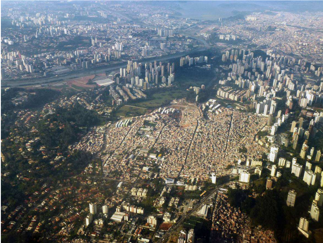
Photo 2 Paraisópolis