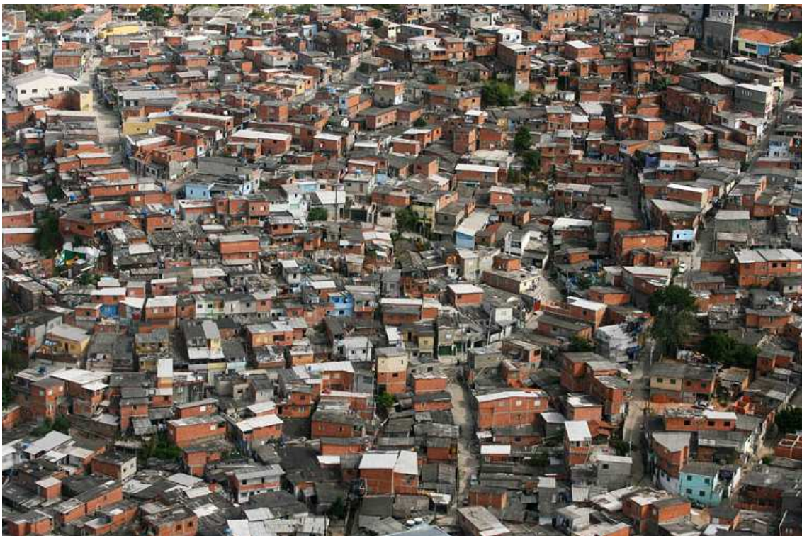
Photo 5 Favela de São Paulo

http://www.tucavieira.com.br