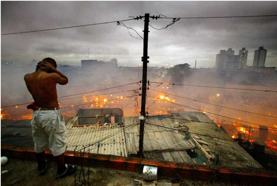
Photo 8 Incendie de favela à São Paulo