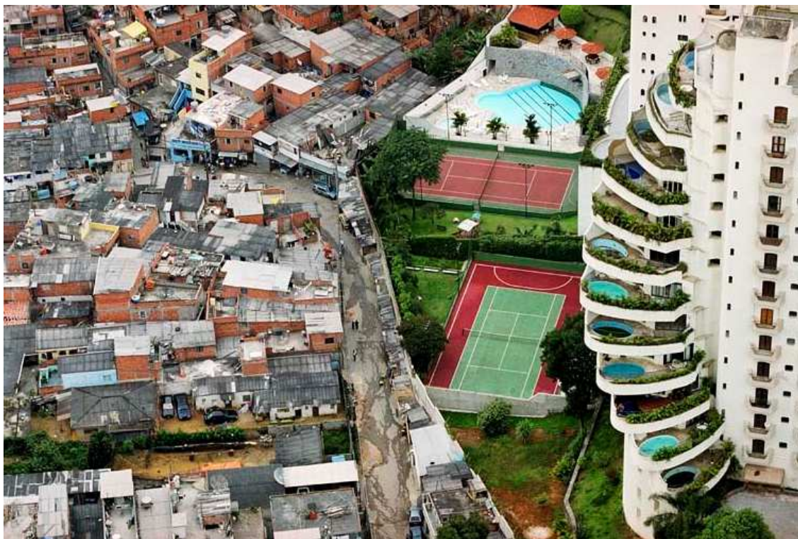
Photo 1 Inégalité