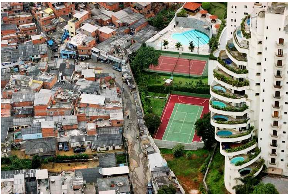
Photo 1 Inégalité