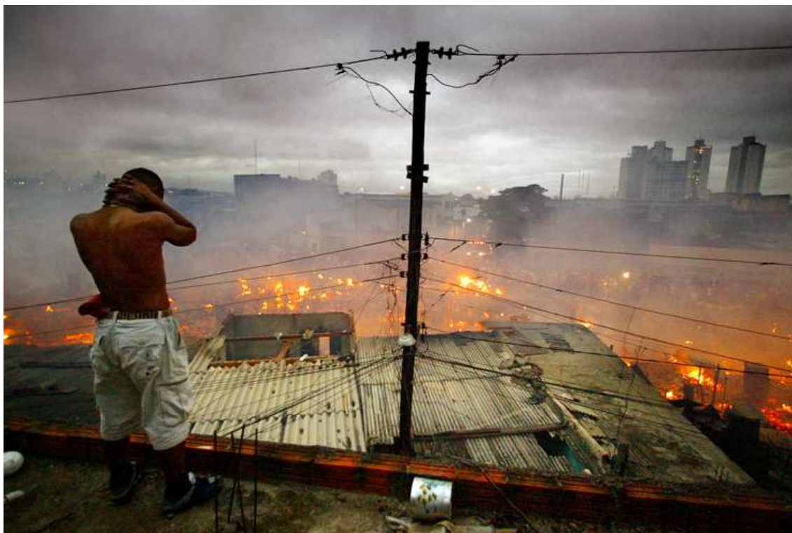
Photo 8 Incendie de favela à São Paulo