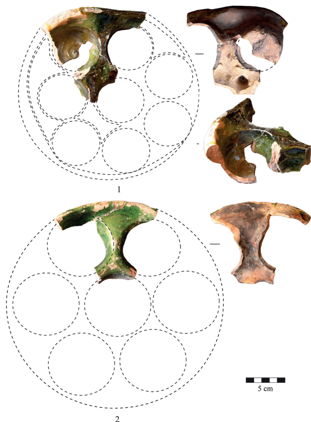
Fig. 2. Plats mamelouks à compartiments pour la cuisson des œufs, fouille de la citadelle d'Alep.