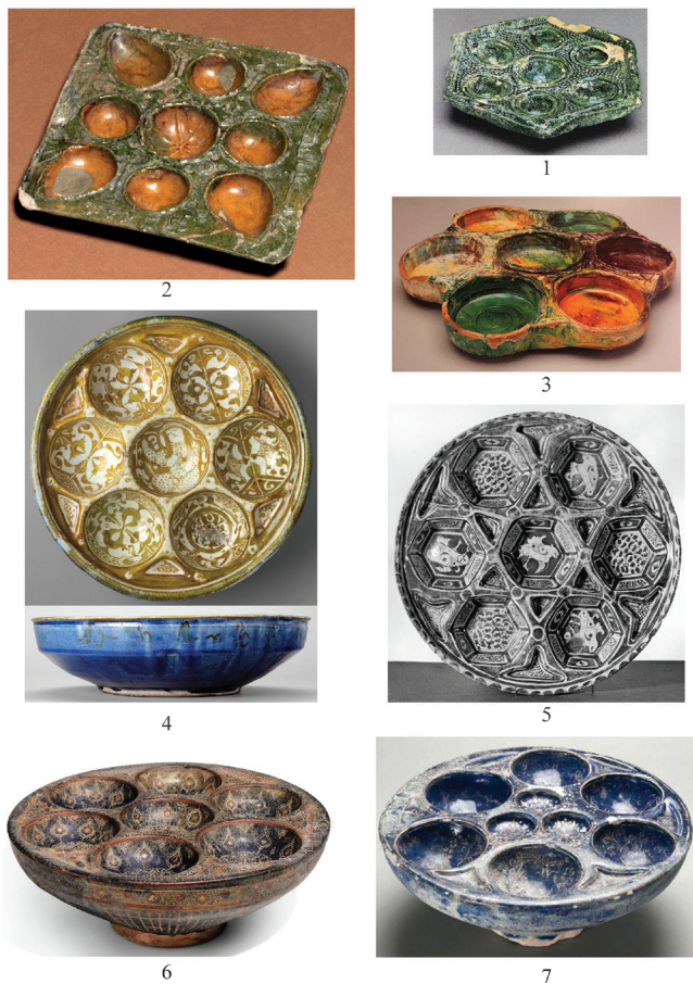
Fig. 1. Plats à compartiments: 1 – Iran oriental, VIII e siècle (d'après Watson, 2004); 2 – Egypte, IX e siècle (d'après Shovelton, 2020); 3 – Iran oriental, X e siècle (d'après Watson, 2004); 4, 5 – Iran, XII e -début XIII e siècle ; 6, 7 – Iran, XIII e – début XIV e siècle.