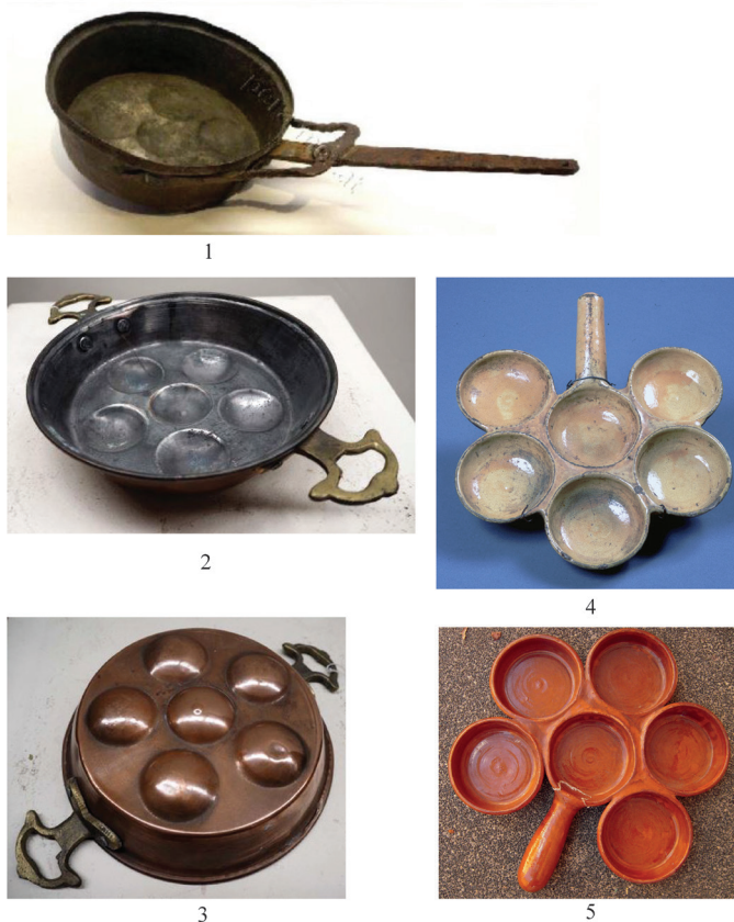
Fig. 5. 1 – Poêle à œufs ottoman, Aydin; 2, 3 – yumurta tabesi , XIX e siècle; 4, 5 – cocottes de Biot et Vallauris, XIX e siècle (d’après Amouric, Vallauri, Vayssettes, 2009).

Рис. 5. 1 – османская сковорода для приготовления яиц, Айдын; 2, 3 – yumurta tabesi (сковорода для яиц), XIX в.; 4, 5 – кокотницы Biot et Vallauris, XIX в. (по Amouric, Vallauri, Vayssettes, 2009).