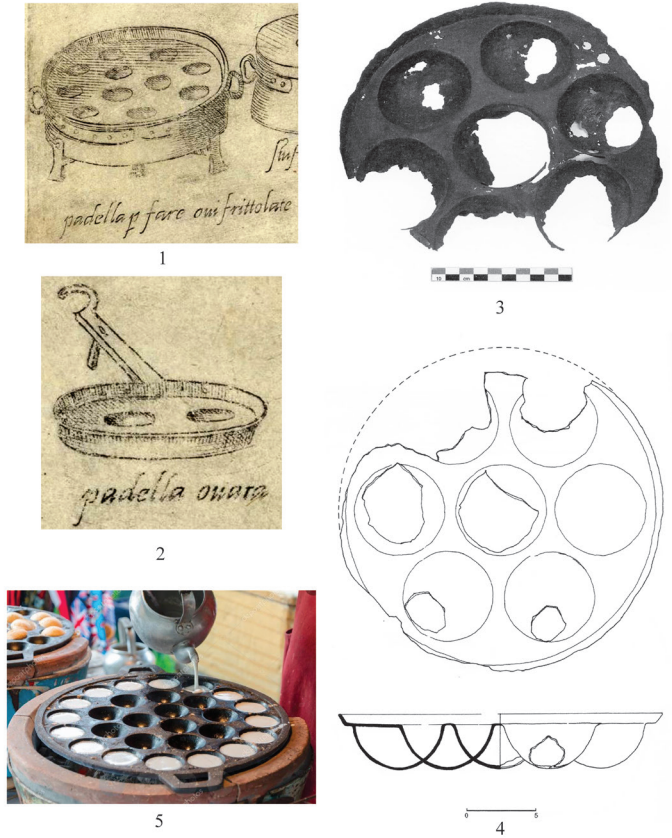
Fig. 4. 1, 2 – Plats pour la cuisson des œufs, Venise, 1570 (d’après Scappi, 1570); 3, 4 – plat vénitien en cuivre vers 1567 (d’après Bezak, 2014); 5 – mode de cuisson dans les plats métalliques à cavités en Thaïlande.

Рис. 4. 1, 2 — блюдо для приготовления яиц, Венеция, 1570 г. (по Scappi, 1570); 3, 4 – венецианская медная тарелка, около 1567 г. (по Bezak, 2014); 5 – способ приготовления в металлическом блюде с секциями в Таиланде.