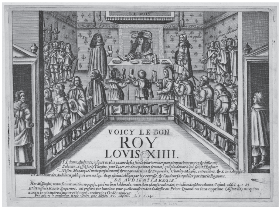
Figure 1. — Anonyme, Voici le bon Roy Louis XIII , 1668 (BNF, Collection Michel Hennin, Estampes relatives à l'histoire de France, t. 49, pièces 4466-4531).