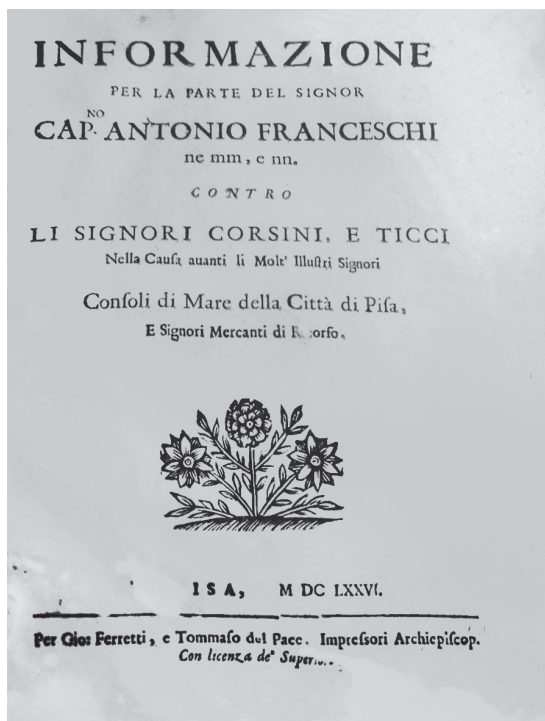
Figure 3. — Page de titre de l'information en faveur des capitaines corses, Pise, 1676 (ASP, Consoli del Mare , « Suppliche », 982, n° 229, fol. 659).

dans le mémoire, ainsi que plusieurs extraits copiés des écritures produites pour sceller le prêt. Est joint ensuite un mémoire imprimé, de onze pages, toujours en faveur de « Corsini e Ticci », qui répond en fait à un long mémoire, lui aussi imprimé, produit par les capitaines et armateurs corses (fig. 3) 32 . Les mémoires sont imprimés à Pise et ne donnent que peu de précisions sur le moment de leur rédaction, hormis l'année 1676. Ce plaidoyer en faveur de la compagnie toscane souligne le caractère « vrai » et « indubitable » de leurs « justes prétentions » : loin de mobiliser des autorités juridiques ou la jurisprudence, il évoque la « vérité du fait » ( verità del fatto ) et, a contrario , les réclamations considérées comme vaines