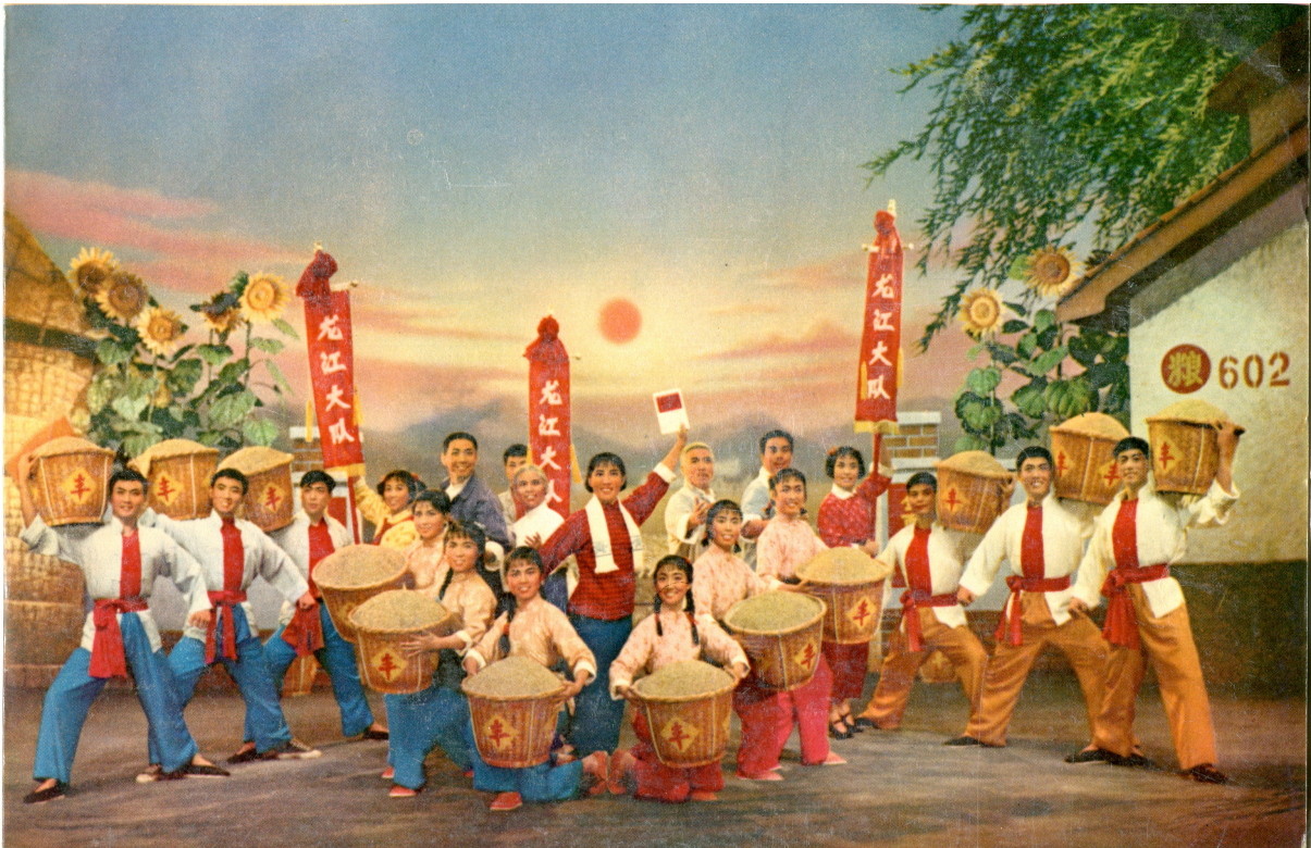
Figure 1 Opéra de Pékin contemporain 现代京剧 Longjiang song 《龙江颂》 (Thrène du Fleuve du Dragon)

l'Occidental distingué (Haski 2013) se distingue mal de l'ex-maoïste reconverti dans la publicité, le journalisme, la charpente ou la diplomatie qui veut faire oublier son aveuglement en ricanant du kitsch du ballet contemporain Hongse niangzi jun 红色娘子军 (Le détachement féminin rouge). 7