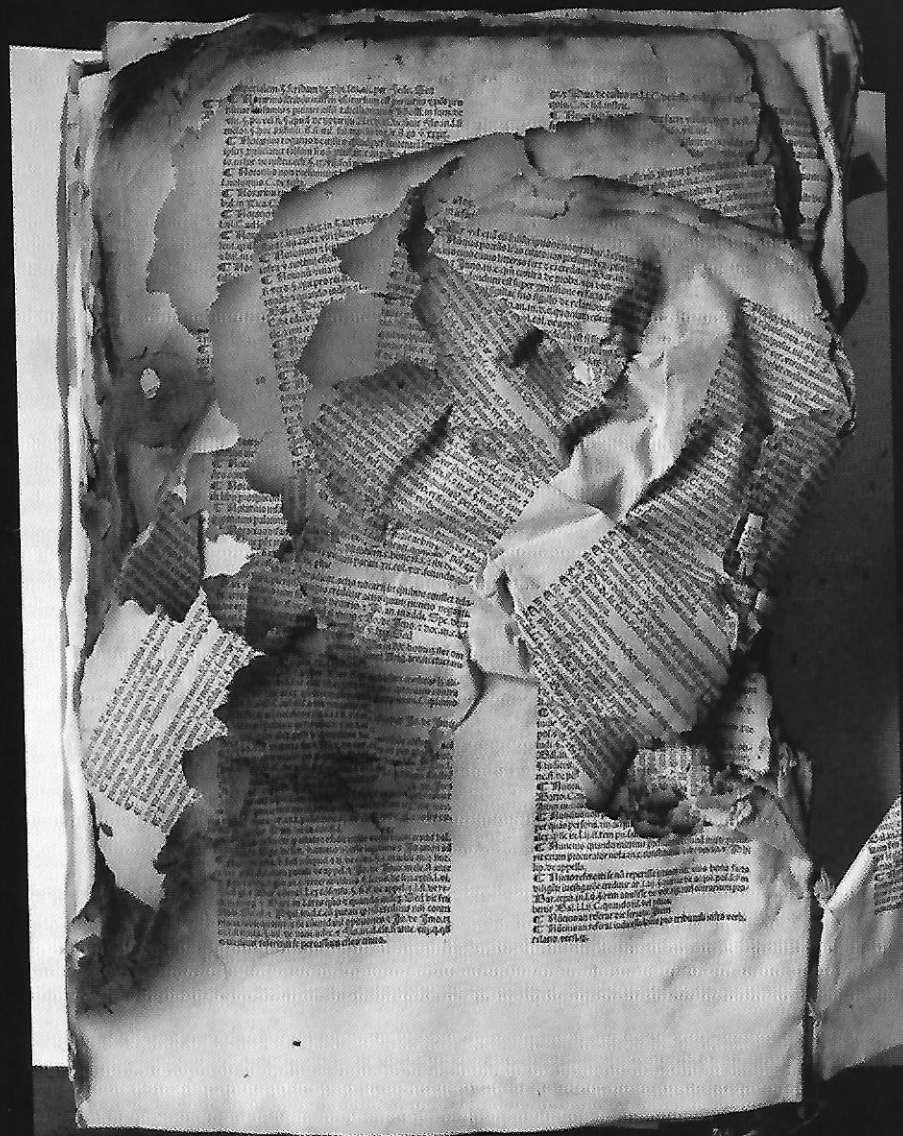
Padoue, bibliothèque du Séminaire épiscopal. Incunable endommagé par les bombardements en 1944