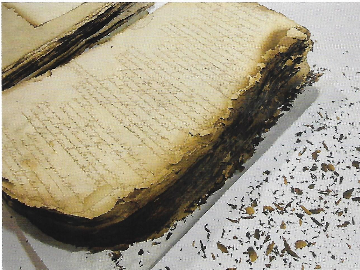
Chartres, médiathèque L'Apostrophe. Manuscrit en papier endommagé par le feu en 1944