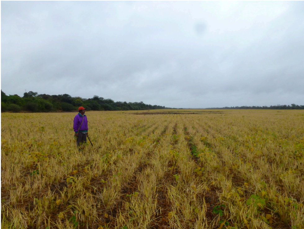
Photo 1. L'avancée du soja sur les territoires des Wichis