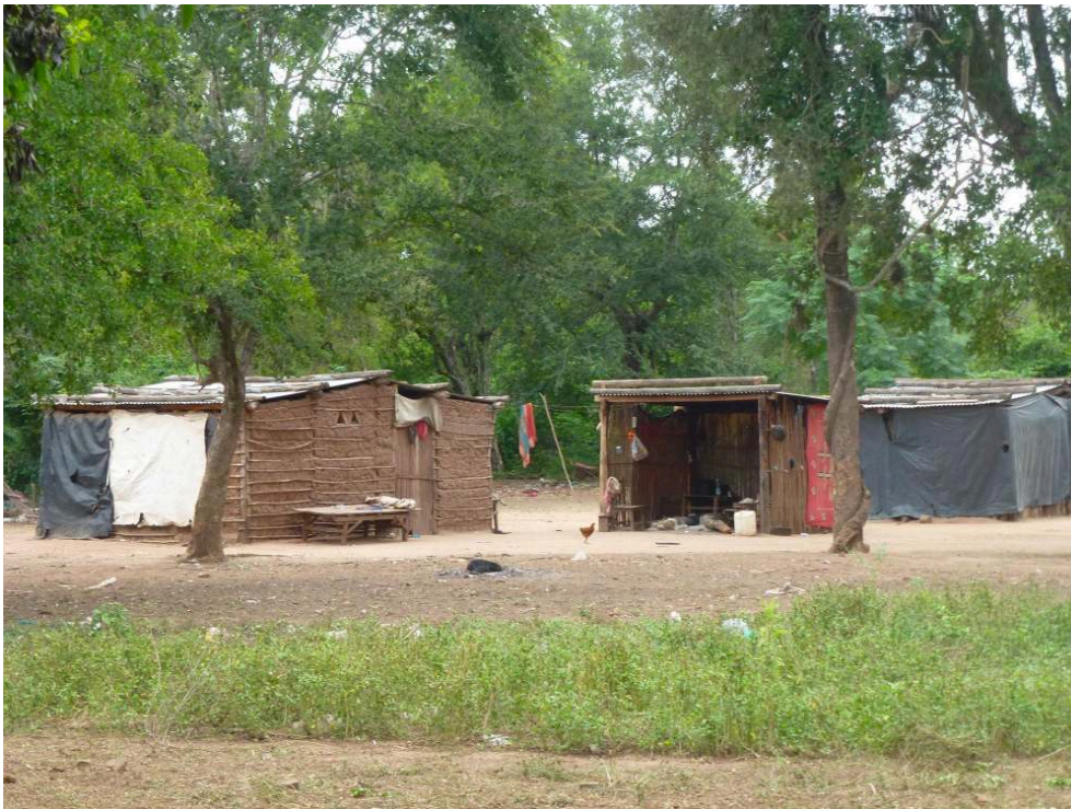
Photo 2. Habitat précaire dans les faubourgs de Tartagal