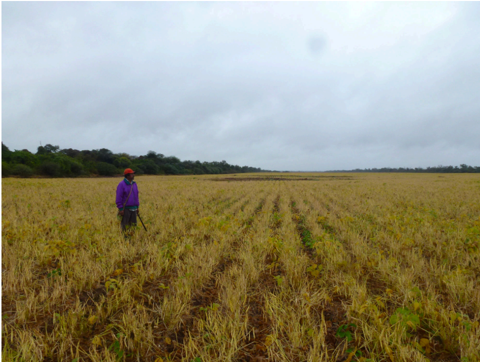
Photo 1. L'avancée du soja sur les territoires des Wichis