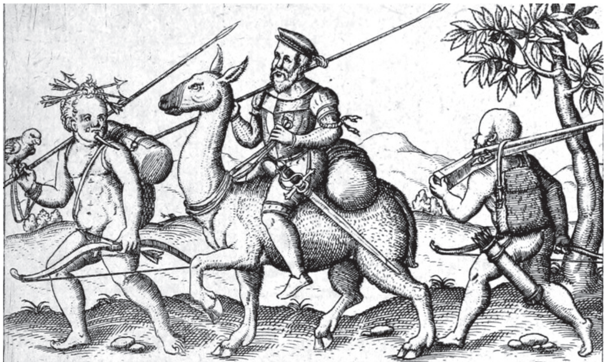
ILUSTRAÇÃO 101 - GUANACO DO CHACO 2 (SCHMIDEL, 1903 [1567])