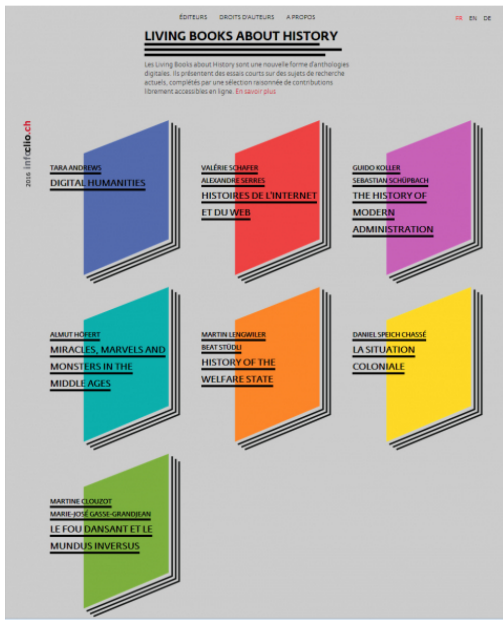
La collection Living Books about History – http://www.livingbooksabouthistory.ch/fr/ – et son premier volume, Digital Humanities Infoclio.ch