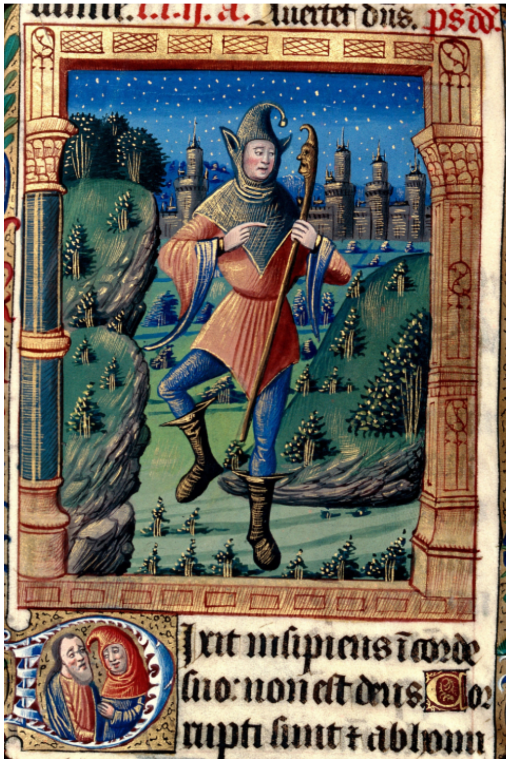
Bréviaire à l'usage de Besançon, avant 1498 – Besançon, Bibliothèque municipale, ms. 69, p. 55 – http://www.culture.gouv.fr/Wave/savimage/enlumine/irht5/IRHT_083399-p.jpg Cliché CNRS-IRHT, bibliothèque municipale de Besançon

Ces nombreuses démarches furent longues et probablement assez inutiles, si l'on rappelle que toutes les images en question sont dans le domaine public, et au regard du volume de la correspondance échangée. Mais elles furent indispensables à ce stade de la réutilisation des données du Net qui commence à s'organiser. Elles révélèrent des positions très diversifiées vis-à-vis de cette question et surtout une véritable prise de conscience des potentialités du Net et du travail collaboratif lié. Certains dépôts confessèrent leur retard en matière numérique. Ils rappe-