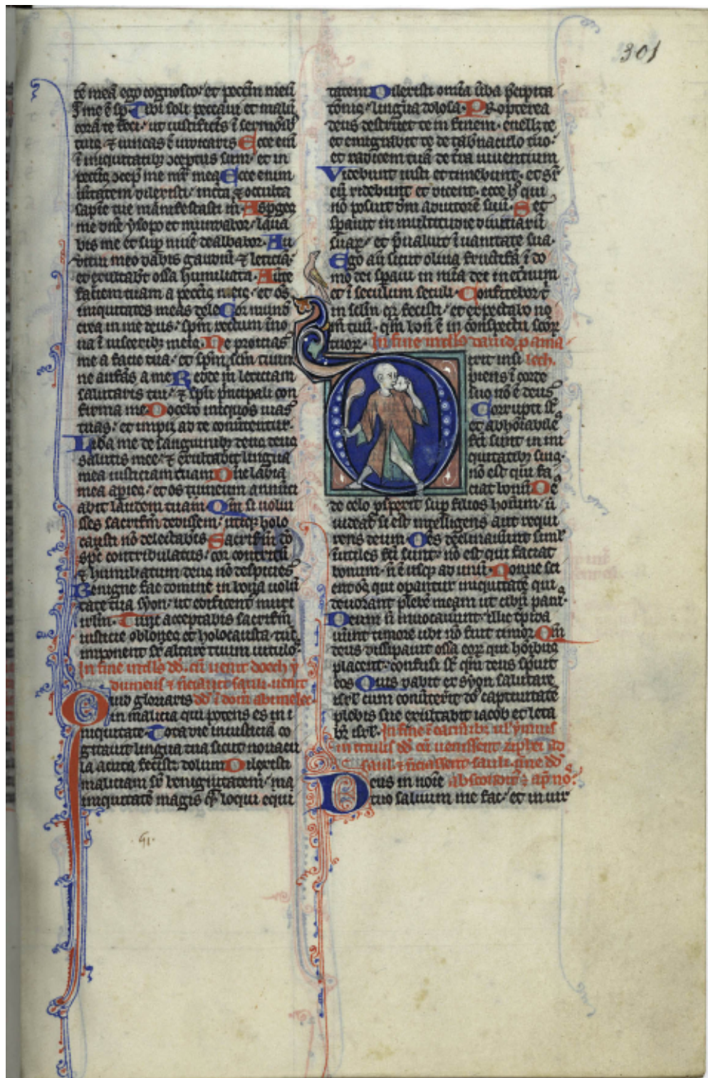
Bible, 1250-1275 – Orléans, Bibliothèque municipale, ms. 7, fo 301 – http://www.culture.gouv.fr/Wave/savimage/enlumine/irht2/IRHT_051589-p.jpg

9 De la même façon, plusieurs autres potentialités du Net retiennent notre attention : les possibilités de sélection et de tri d'images, la variété des affichages, les galeries de vignettes, la documentation multiforme (avec menus, au survol, en lien), les possibilités de recadrage et de téléchargement des images, l'option de commentaire. Outre cet usage facilité des images en ligne que nous pratiquons chaque jour, nous avons été