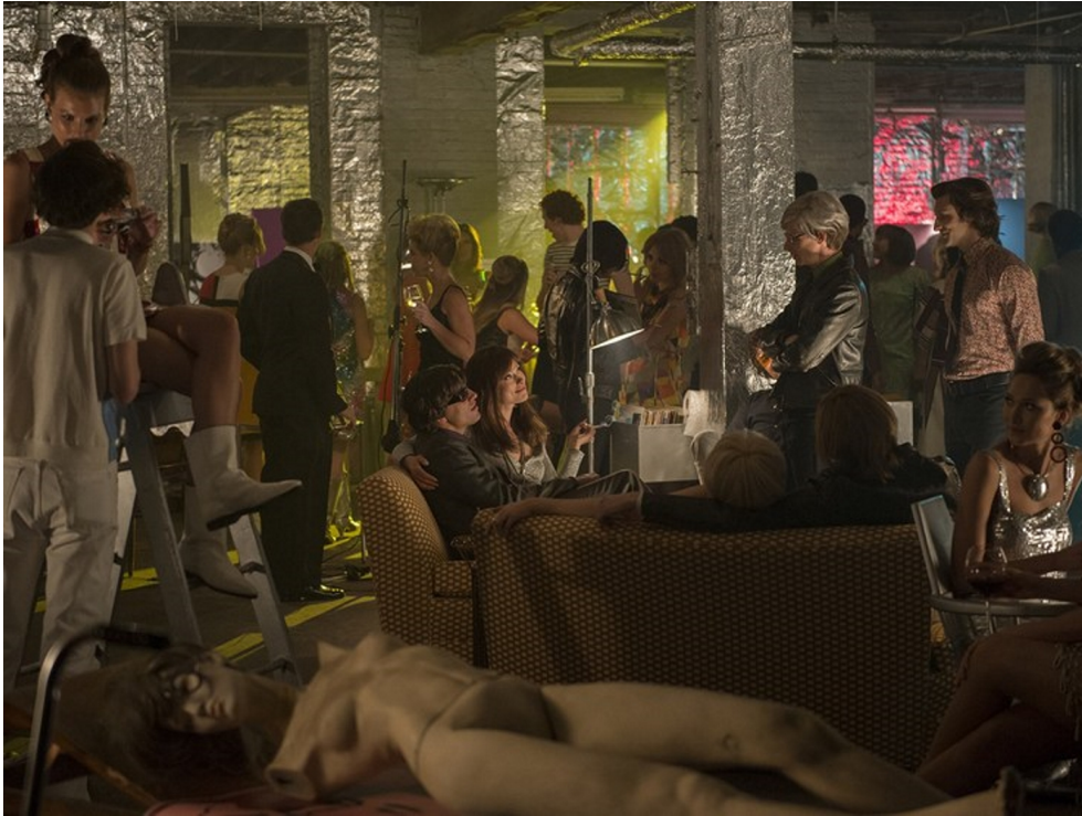
fig. 7 : La reconstitution de la Factory, avec le Velvet Underground en bande sonore et le personnage de Warhol intégré à l'intrigue de Vinyl 73 .