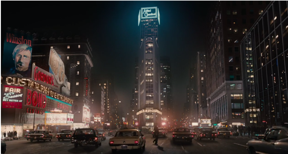
fig. 10 : Times Square 70's reconstitué dans le pilote de The Deuce 94

fonction de la rendre transparente et convaincante. Le « réalisme » est là, et, comme l'écrivait André Bazin, il vise « la satisfaction complète de notre appétit d'illusion par une reproduction mécanique dont l'homme est exclu 93 ».