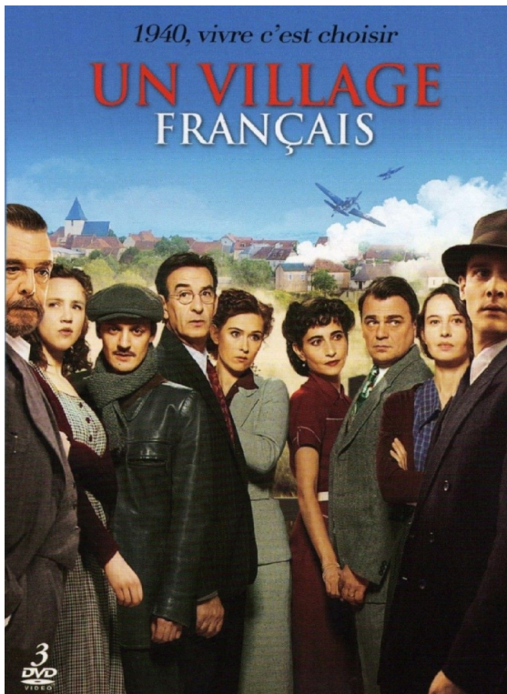
fig. 1 : L'affiche d' Un village français 8 .