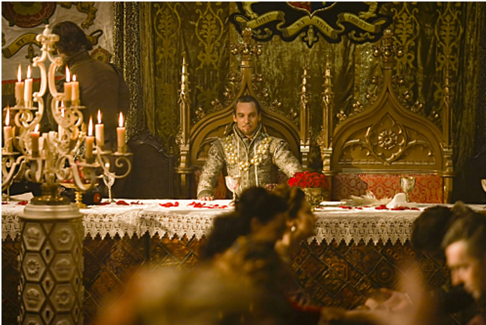
fig. 9 : Jonathan Rhys-Meyers, un Henri VIII peu fidèle dans The Tudors 92 .