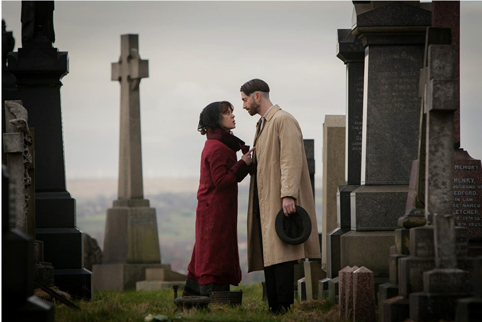
fig. 3 : Polly confronte Freddie Thorne, syndicaliste communiste reconnu et amant de sa nièce Ada Shelby, dans Peaky Blinders 43 .