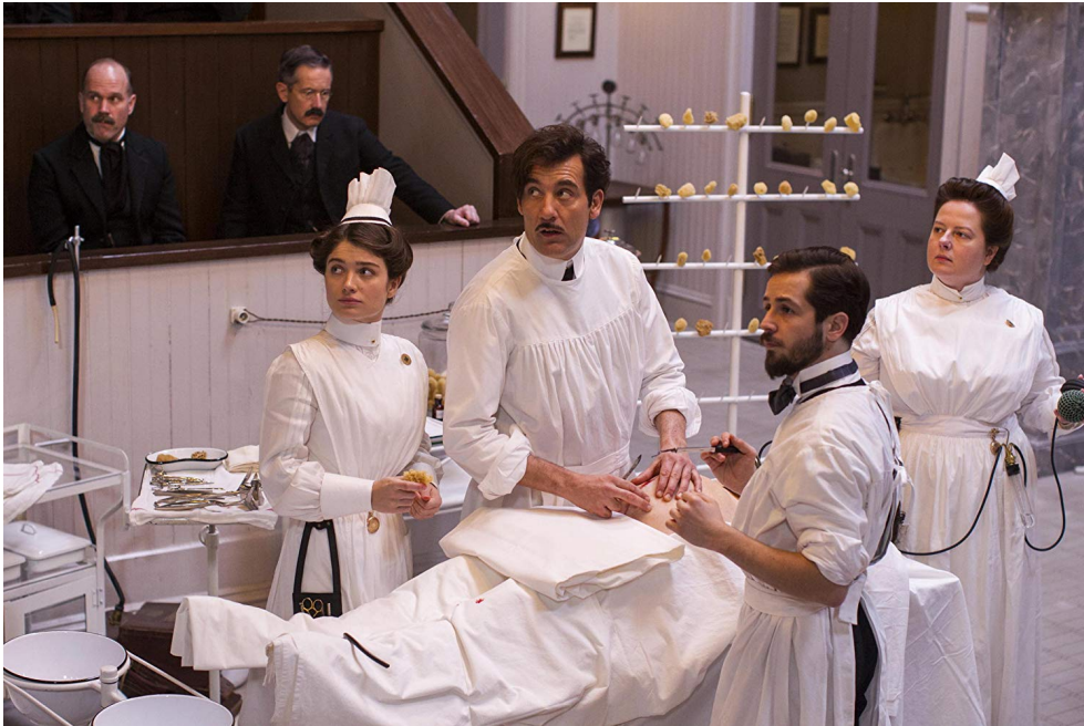
fig. 8 : La mise en scène des progrès empiriques de la médecine dans The Knick 78 .

difficulté du personnage principal, John Thackery, inspiré du D r William S. Halsted, à l'incarner sans dommage. Drogué, obsédé par son travail et ses découvertes, humainement souvent exécrable, et mégalomane, Thack dit bien qu'être en avance sur son temps produit des effets psychologiques aussi éprouvants que ceux des personnages qui à l'inverse ne parviennent pas à être de leur temps. Il se condamne d'ailleurs lui-même à ne pas voir le monde médical qu'il aura contribué à faire naître.