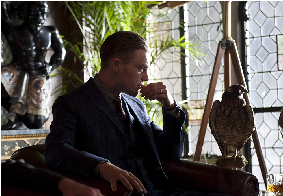
fig. 6 : Jimmy Darmody (Michael Pitt) dans Boardwalk Empire 68 .