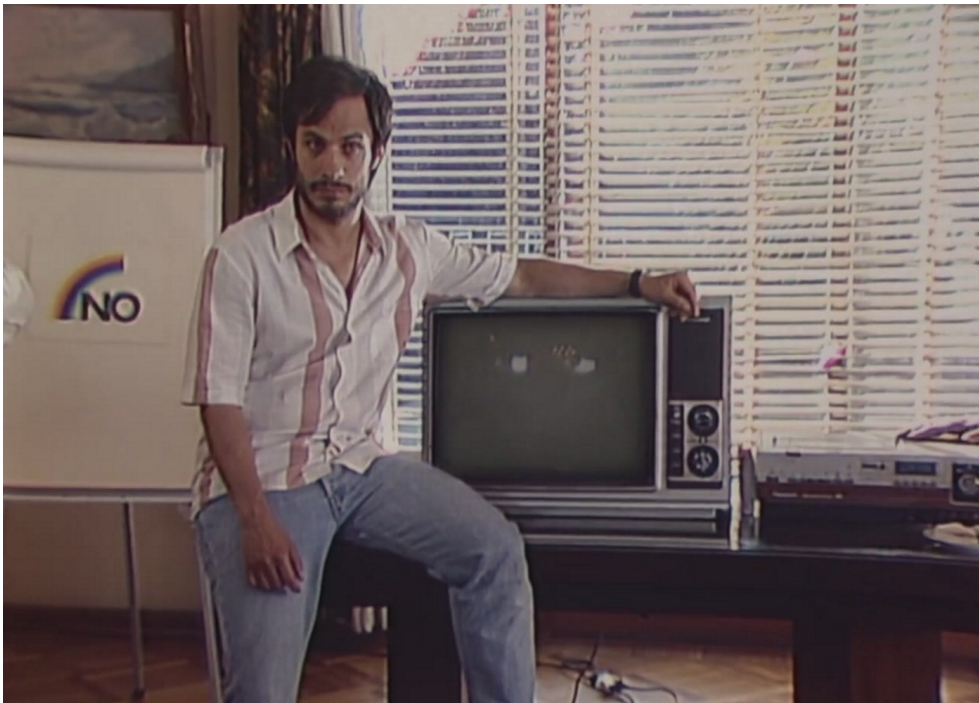
fig. 5 : No , le grain d'image de la fin des années 80 au Chili 57 .