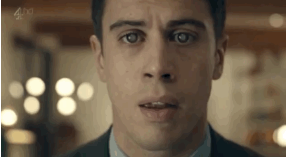
Gif 2 : Black Mirror 84 .