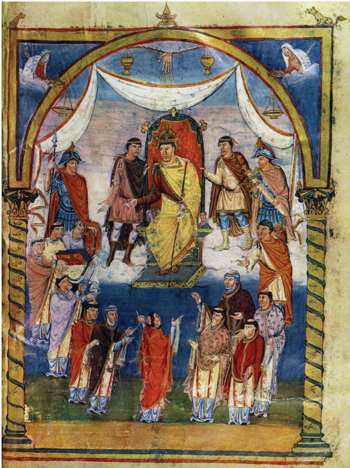
Fig. 8 – Ms. lat. 1, fol 423r.