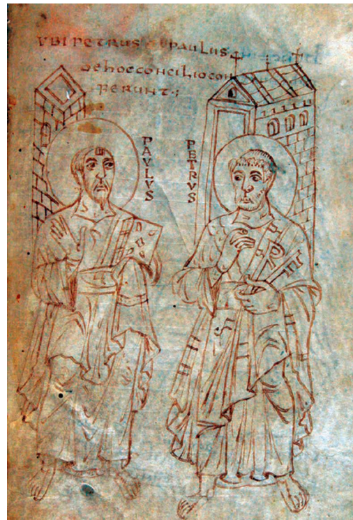
Fig. 3 – Ms. 165, fol. 3r.