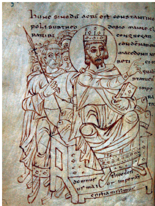
Fig. 4 – Ms. 165, fol. 3v (cl. Bibliothèque capitulaire de Verceil).