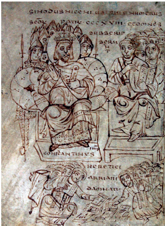
Fig. 2 – Ms. 165, fol. 2v.