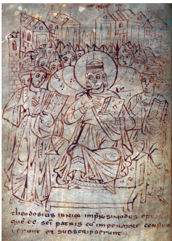
Fig. 6 – Ms. 165, fol. 4v.

Sur le folio en vis-à-vis, la Maiestas Domini trône dans une mandorle, entourée de deux anges qui tiennent des rouleaux (fig. 7). Le Christ a été peint dans sa double nature : imberbe, auréolé du nimbe crucifère, son visage est encadré par le double trigramme IHS XPS, rappel du titulus de la Crucifixion (Jn 19, 19) 14 .