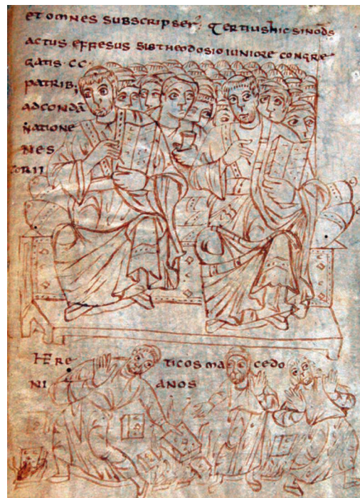
Fig. 5 – Ms. 165, fol. 4r.