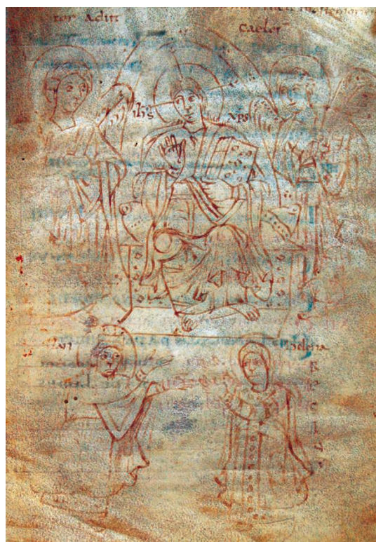
Fig. 7 – Ms. 165, fol. 5r.