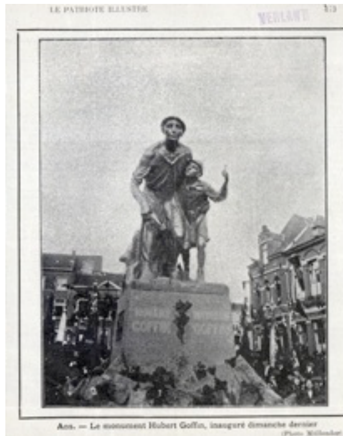
Ann. — Le monument Hubert Goffin, inauguré dimanche dernier