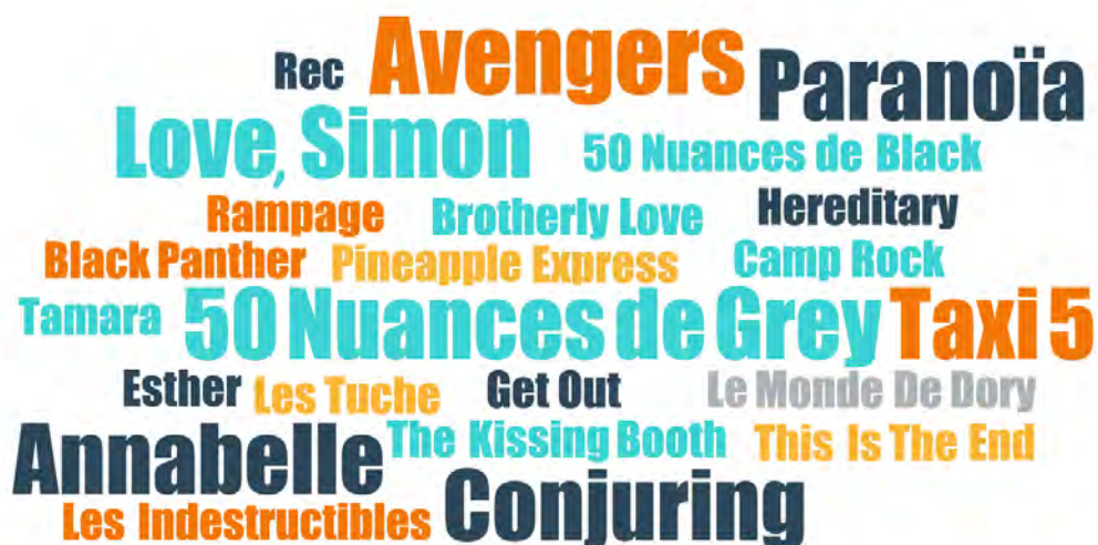
FIGURE 5. TITRES DE FILMS CITÉS PAR LES ADOLESCENT·E·S EN ENTRETIEN

La taille des titres reflète la fréquence de citation en entretien : Avengers est cité 3 fois ; Paranoïa , Love, Simon , Taxi 5 , 50 nuances de Grey , Annabelle et Conjuring sont cités 2 fois. Les films d'une même franchise ont été réunis ( Avengers 2 et Avengers 3 ; Conjuring et Conjuring 2 ).