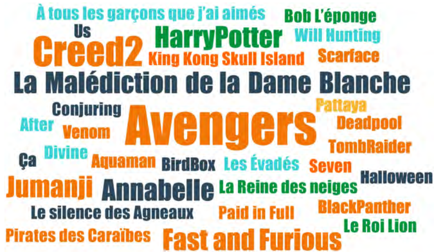
FIGURE 4. TITRES DE FILMS CITÉS PAR LES ADOLESCENT·E·S DE VILLEJUIF EN ENTRETIEN

La taille des titres reflète la fréquence de citation en entretien : la plupart des titres sont cités une fois ; Avengers est cité 5 fois ; Creed 2 3 fois ; Fast and Furious , Harry Potter , La Malédiction de la Dame Blanche , Jumanji et Annabelle 2 fois.