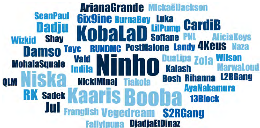
FIGURE 2. ARTISTES CITÉS PAR LES ADOLESCENT·E·S DE VILLEJUIF PENDANT LES ENTRETIENS

La taille du nom des artistes reflète la fréquence de citation en entretien : la plupart ont été cités une fois ; Ninho est cité 9 fois ; Booba 7 fois ; Koba La D, Niska et Kaarie 6 fois ; Dadju, Damso, RK, Jul et Cardi B 3 fois, etc.