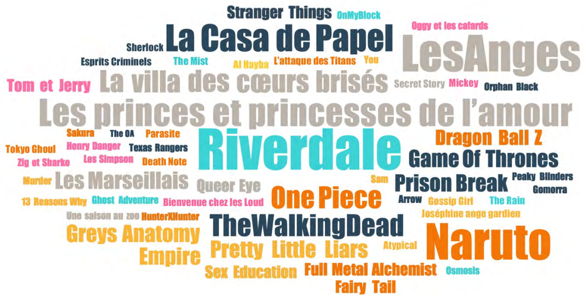
FIGURE 4. TITRES DE SÉRIES CITÉS PAR LES ADOLESCENT·E·S DE BOURGOIN-JALLIEU EN ENTRETIEN

La taille des titres reflète la fréquence de citation en entretien : Riverdale est citée 8 fois ; Les Anges et Naruto 7 fois ; Les princes et princesses de l'amour 6 fois ; La Casa de Papel 5 fois ; La villa des cœurs brisés , The Walking Dead et One Piece 4 fois ; Les Marseillais , Game of Thrones et Prison Break 3 fois, etc.