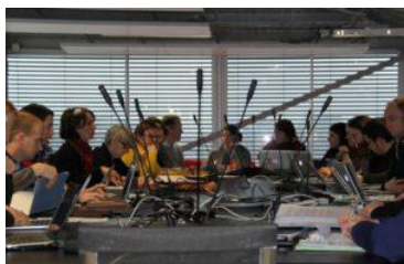
Séance de travail inter-équipes AAU-Crenau/AAU-Cresson

D'autres formations autour des données de la recherche sont envisagées, notamment en collaborant à nouveau à l'accueil de l'Inist qui projette de nouveaux "tours" .