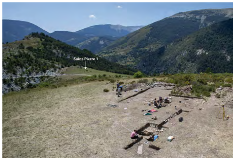
Fig. 16 – THORAME-BASSE, Saint-Pierre II. Vue depuis le nord-ouest de la zone de fouille, avec au second plan le site de Saint-Pierre 1.

• Pour l'état 5, aucun vestige, ni mobilier céramique des périodes médiévale et moderne n'a été identifié. Cette absence pourrait être due à d'importants phénomènes d'érosion liés à un faible couvert forestier (absence d'opération de reboisement en vue d'une stabilisation des sols