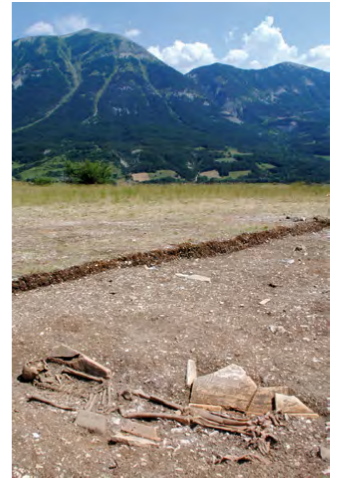
Fig. 17 – THORAME-BASSE, Saint-Pierre II. Vue depuis le nord du défunt de la SP1 (coffrage composite bois et tegulae ).

Alexia Lattard, Florence Mocchi, Yoann Quesnel et Minoru Uehara