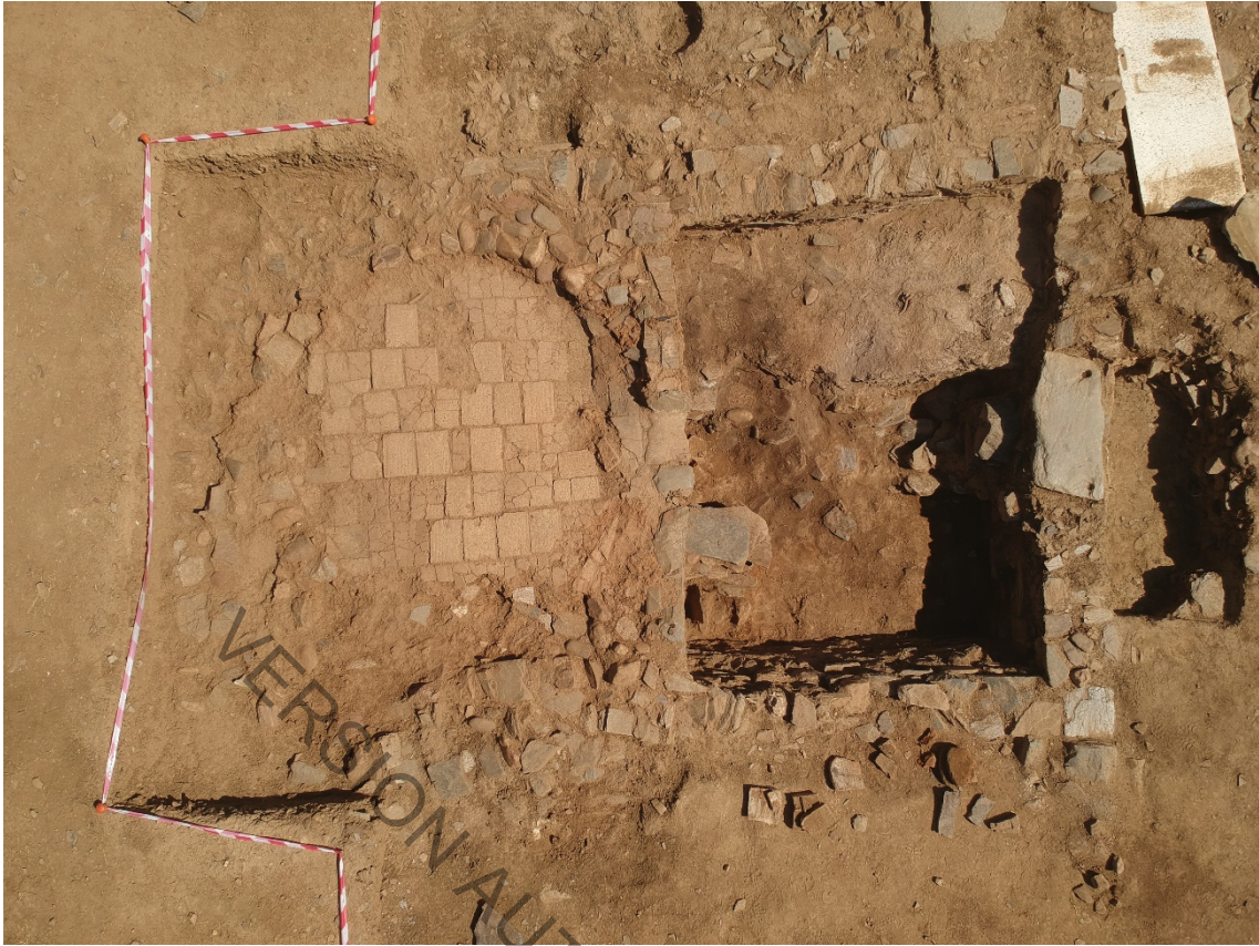
Fig. 7. Horno de gran tamaño para la cocción de alimentos, precedido por su espacio de trabajo, edificio C-17.