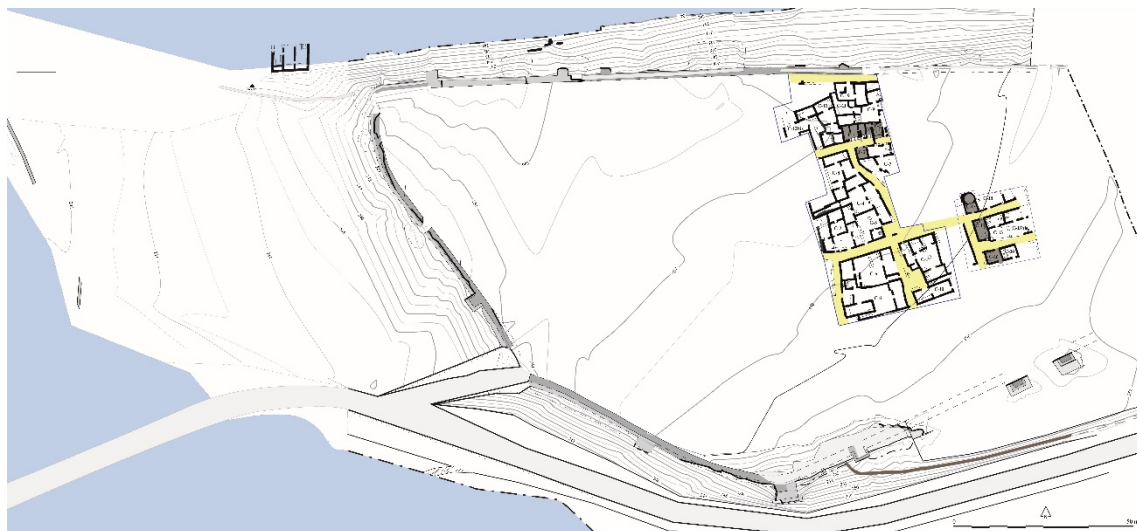
Fig. 1. Plano general del yacimiento de Albalat con los vestigios descubiertos. En amarillo las calles, en gris los espacios dedicados a las actividades artesanales y comerciales.