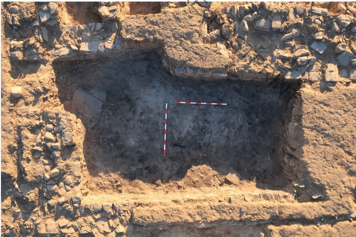
Fig. 6. Detalle de la estancia C enfrente del horno en curso de excavación, edificio C-15.