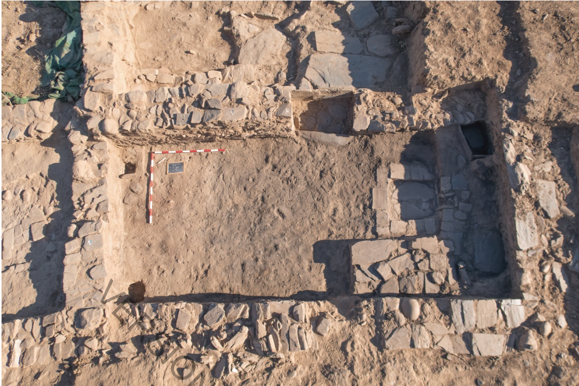
Fig. 10. Vista cenital de la cocina B8 del edificio C-12bis.