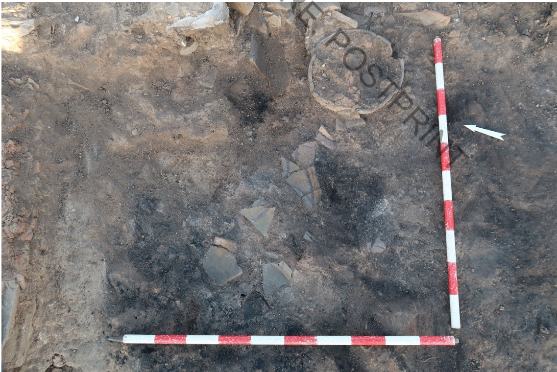
Fig. 8. Aparición de atafiores (uno de ellos sin vidriar) en el nivel de incendio de la estancia principal del edificio C-6.