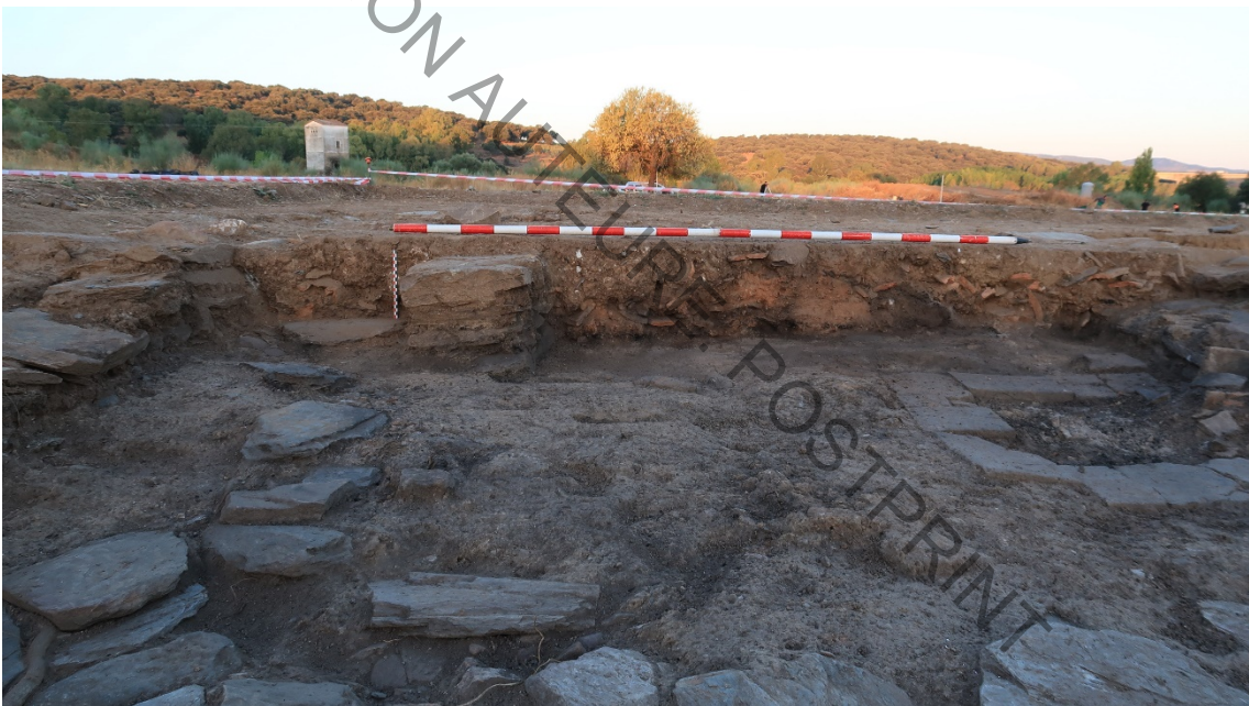
Fig. 4. Perfil oeste (testigo) dentro del taller de industria ósea, en el cual se aprecian los niveles de derrumbe de tejado y de incendio.