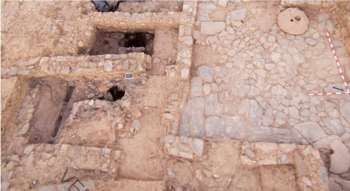
Fig. 3. Vista general del taller metalúrgico 2, que linda con el patio del edificio C-9.