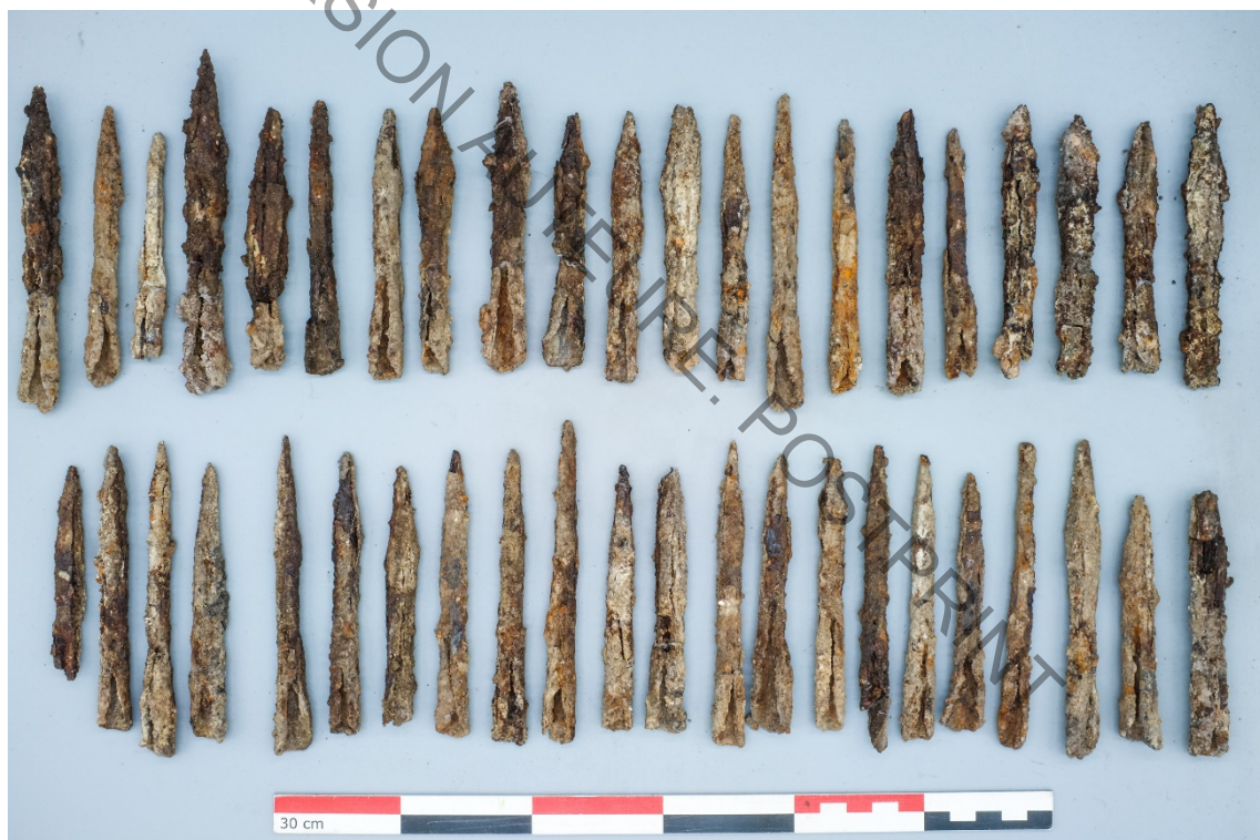
Fig. 2. Conjunto formado por unos cuarenta dardos hallados en la esquina de una estancia, parcialmente excavada, edificio C-12bis.