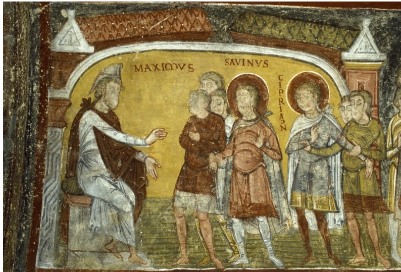
FIG. 3. Peintures murales de la passion des saints Savin et Cyprien (3 e comparution et condamnation au supplice de la roue et des lions) dans la crypte de l'église abbatiale de Saint-Savin-sur-Gartempe (Vienne).