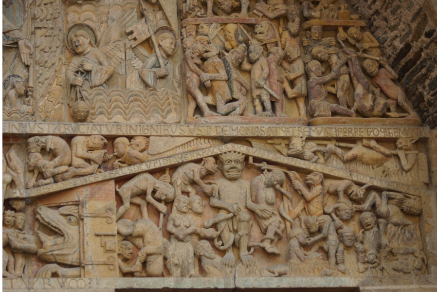
FIG. 1. Le blanc sous les pieds des damnés au tympan de l'église abbatiale de Conques (Aveyron). Détail.