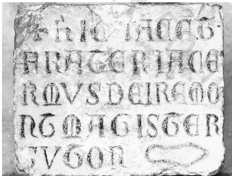
FIG. 8. Inscription funéraire du frère Jacerne Deiremont, maître cordonnier à l'abbaye de Hautecombe (Savoie).