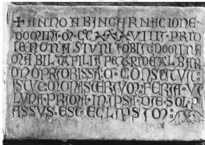
FIG. 10. Inscription funéraire de Mabile, fondatrice de l'abbaye de Fours-lès-Pujaut (Gard), morte en 1239.