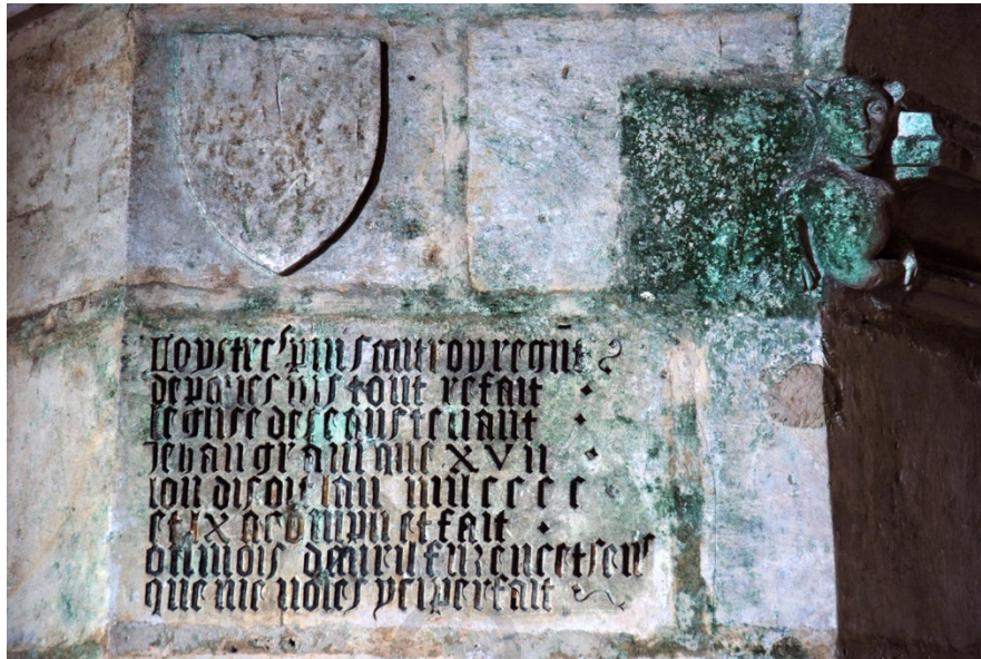
FIG. 11 : Inscription pour la réfection d'un pilier dans la crypte de Sainte-Eutrope à Saintes (Charente-Maritime).