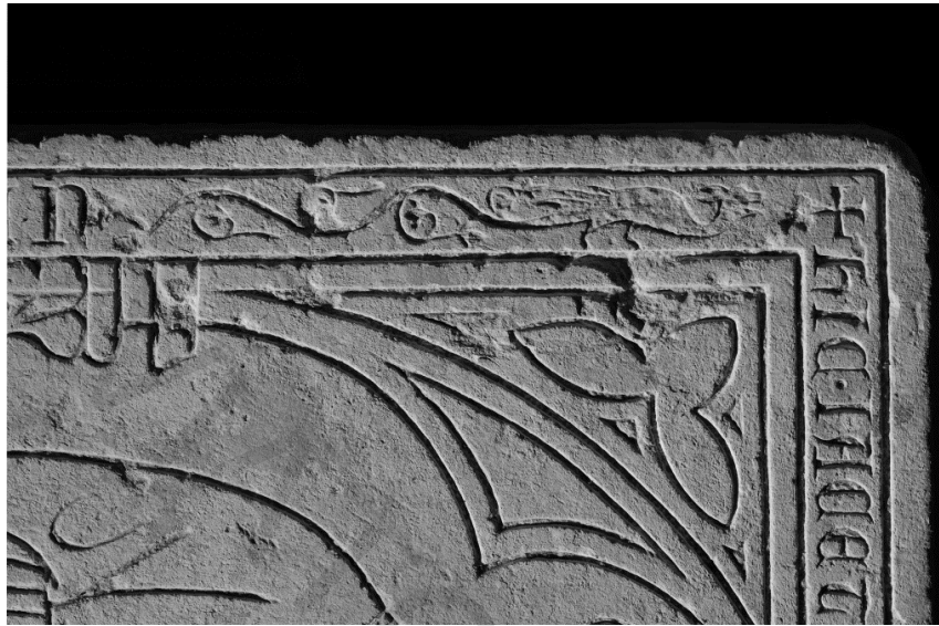
FIG. 7. Plate-tombe de l'abbé Hugues de Faye à l'abbaye de Nieul-sur-l'Autise (Vendée), détail.