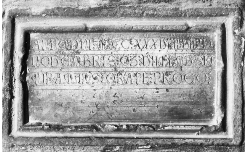
FIG. 5. Inscription obituaire de Guillaume de Miramars dans le cloître de Saint-Trophime d'Arles (Bouches-du-Rhône).