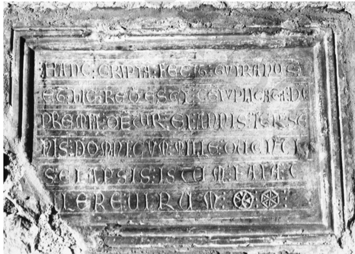
FIG. 6. Inscription funéraire pour Guiran dans le cloître de Saint-Paul de Mausole à Saint-Rémy-de-Provence (Bouches-du-Rhône).