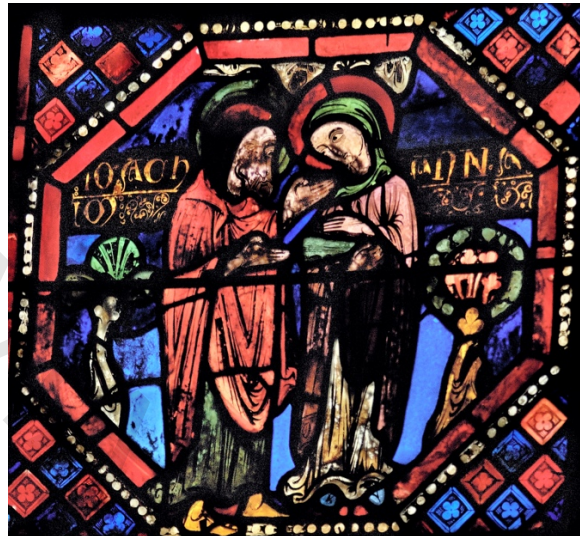
FIG. 9. Vitrail de saint Jean l'Évangéliste ( Corpus vitrearum baie 22, 2 e registre, Anne et Joachim) à la cathédrale Saint-Étienne de Bourges (Cher).