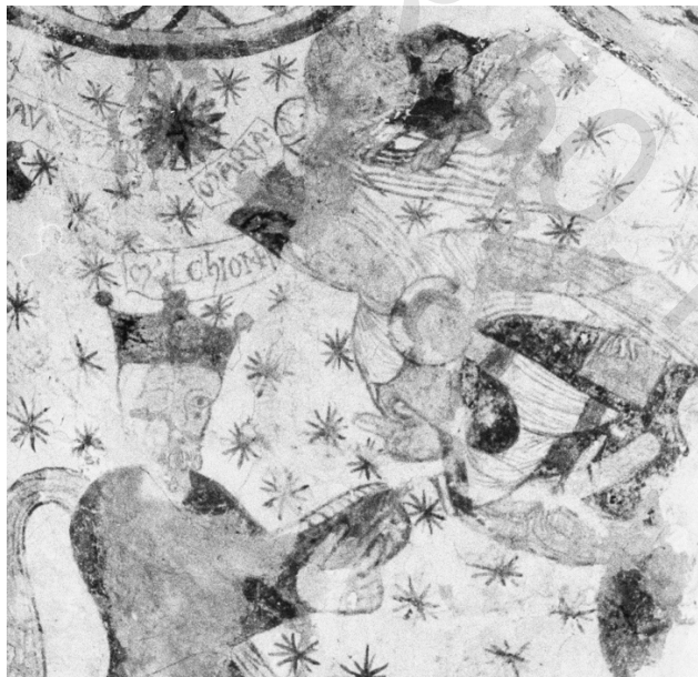
FIG. 4. Peintures murales de l'Adoration des mages réalisées dans l'église de Sainte-Marie-aux-Anglais (Calvados).