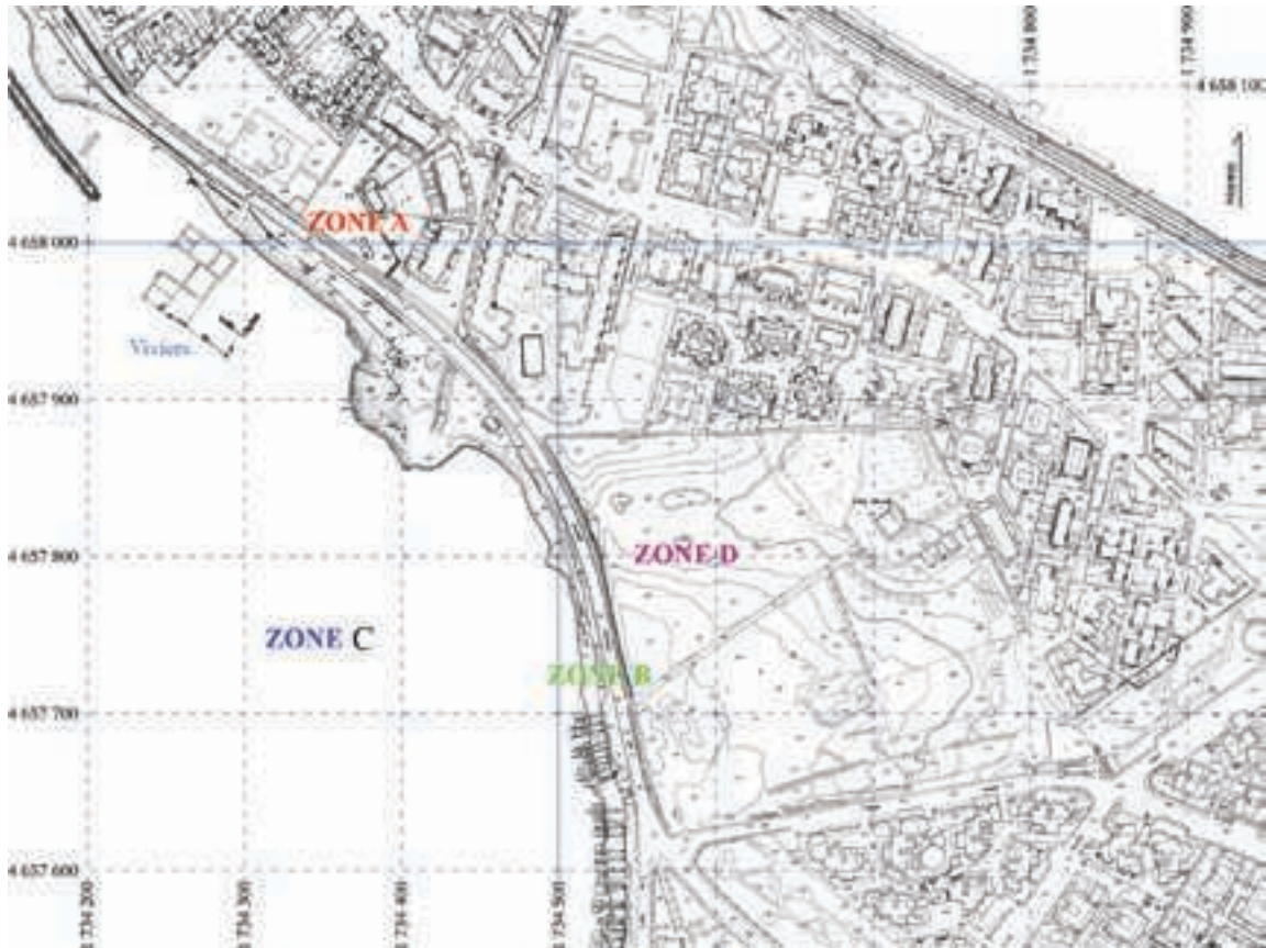
Fig. 2 – Plan aérophotographique du site de Castrum Novum – commune de Santa Marinella. V. Picard, CNRS IRAA USR 3155 du CNRS, UPPA.