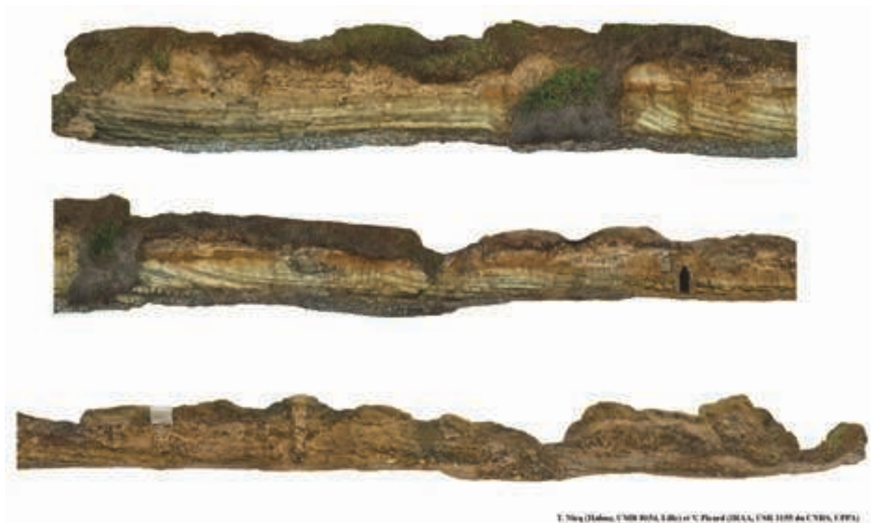
Fig. 8 - Vue photogrammétrique des trois quarts nord de la partie romaine (secteur 2) de la coupe stratigraphique.

Elle a été rapidement étudiée par P.A. Gianfrotta, mais n'a jamais été analysée comme document spécifique de manière scientifique 17 .