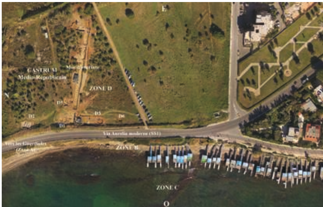
Fig. 3 – Vue zénithale de l'ensemble des zones B et D du site de Castrum Novum . G. Poccardi.