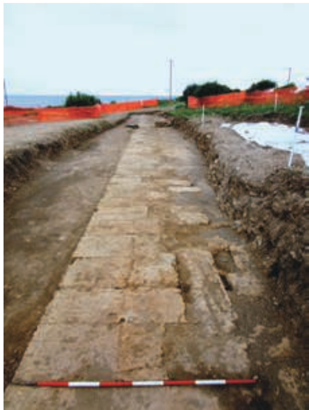
Fig. 5 – La partie méridionale de l'enceinte médio-républicaine depuis l'est.

soit 4 × 2 × 2 pieds romains) et disposés en assises horizontales alternant des panneresses et des boutisses. Large de 2,80 m, il a été fouillé, sur sa partie méridionale, sur une longueur de 105 m. pour 120 m. estimés (fig. 5). À l'occasion de la dernière campagne, en septembre 2017, l'angle sud-est de l'enceinte du castrum a été mis au jour. Du fait de la petite taille de ce castrum , l'enceinte ne possédait pas d' agger , c'est-à-dire de levée de terre renforçant le système défensif comme dans les autres castra connus comme Ostie, Minturnes ou Pyrgi : ici, l'habitat venait s'accoler directement à la partie interne des remparts. La découverte de plusieurs sépultures placées immédiatement à l'extérieur des remparts montre que la muraille, au moins à partir du II e siècle apr. J.-C., avait perdu ses fonctions 13 .