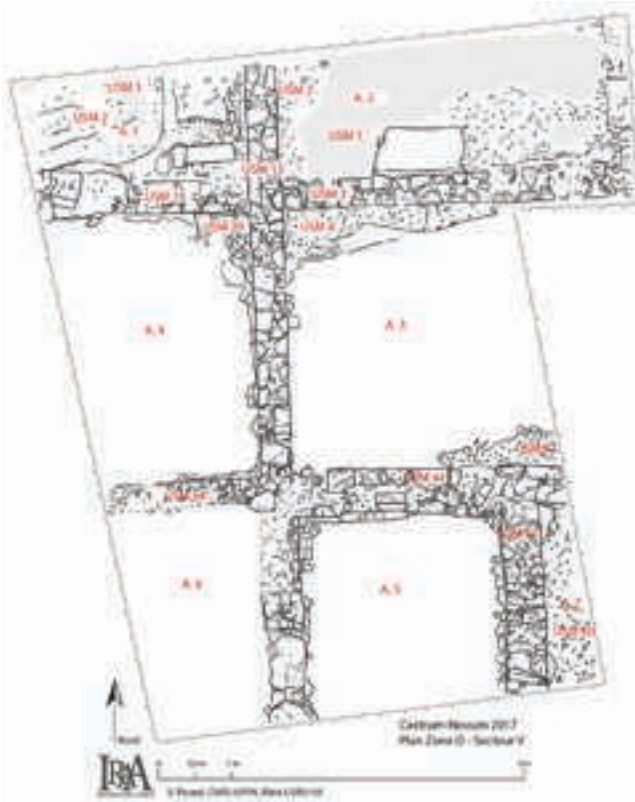
Fig. 7 – Plan du sondage 5. V. Picard, CNRS IRAA USR 3155 du CNRS, UPPA.

rentes fonctions. On note la présence des tuiles et briques portant des timbres, épigraphiques et anépigraphiques qui datent des II e et III e siècles 15 . Même si les éléments dont nous disposons sont peu nombreux, le plan de l'édifice fouillé pendant la campagne 2015 pourrait se rapporter au scenarium , mentionné dans une inscription de Castrum Novum (CIL XI, 3583).