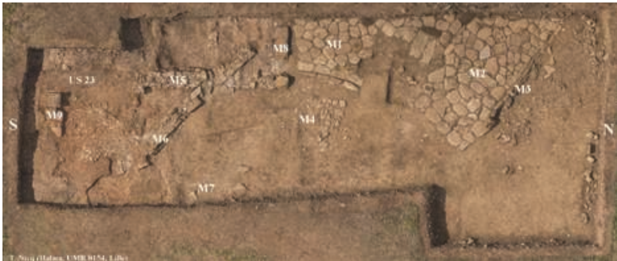
Fig. 9 – Vue zénithale du sondage D3.

lière du dallage et la présence d'un édifice dont le seuil bute contre sa marge méridionale, cet aménagement ne semble pas correspondre à une véritable voie. Son orientation différente par rapport au maillage urbain mis au jour jusqu'à présent conforterait cette interprétation (fig. 9). Cette aire de circulation piétonne, située à quelques mètres seulement du tronçon sud-est de l'enceinte républicaine, a été délaissée au cours de l'époque impériale, comme l'indiquent les épais niveaux de remblais remaniés contenant essentiellement du mobilier de cette période (amphores, sigillées africaines, monnaies d'époques médio- et tardo-impériales). La composition du mobilier (céramiques, faune, petits fragments d'éléments d'architecture en marbre, balsamiques en verre, stylets en os) est cohérente avec le mobilier découvert dans les niveaux plus récents et d'abandon du castrum .