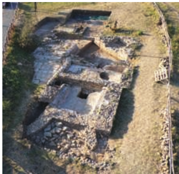
Fig. 4 - Vue du balneum de Le Guardiole. F. Enei.

Il semble que ce complexe ait fonctionné entre le II e et le V e siècle, chronologie établie en particulier grâce aux estampilles sur bipedales qui couvraient un des canaux de chauffe, comportant le texte CN(aei) DOMIT(i) APRILIS (milieu du I er et début du II e siècle) 7 et au fragment d'un tuyau de plomb, portant une inscription très mutilée [- - -]DI[- - -] L(V)NENSIS [- - -]. Seul le cognomen « Lunensis » est lisible, ce qui laisse envisager plusieurs hypothèses, parmi lesquelles celle