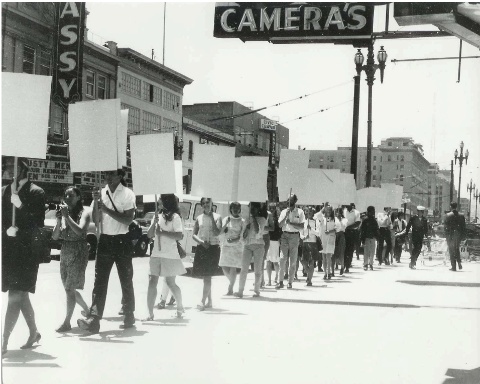
Blank Placard Dance (1967) d'Anna Halprin dans les rues de San Francisco Californie Avec l'aimable autorisation d'Anna Halprin