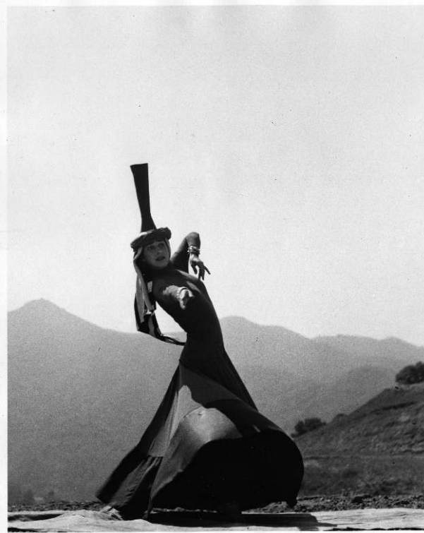
Anna Halprin dansant Prophetess , 1947