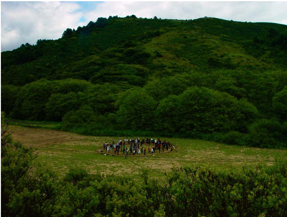
Planetary Dance d'Anna Halprin au Mont Tamalpais, Californie, 2005

Avec l'aimable autorisation d'Anna Halprin