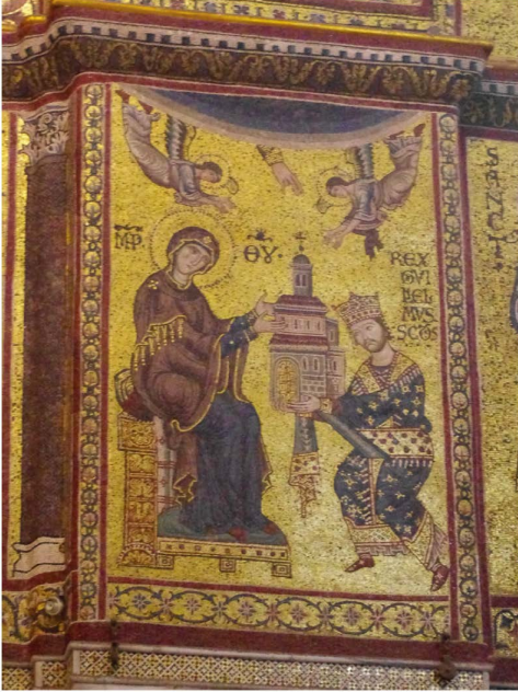
Fig. 3 b — Monreale (Italie, Sicile) : mosaïque ; d'après Queyrel (2014), fig. 4.