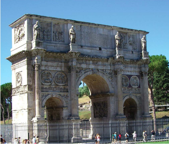
Fig. 5 a — Rome : arc de triomphe de Constantin ; photo H.-P. Francfort.