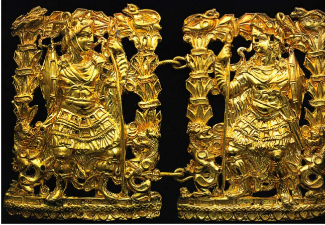
Fig. 6 — Tillyatépa (Afghanistan, Bactriane) : broche représentant un guerrier en tenue « macédonienne » ; d'après Sarianidi, V. I. (1985), L'or de la Bactriane . Fouilles de la nécropole de Tillia-tepe en Afghanistan septentrional, Léninegrad.