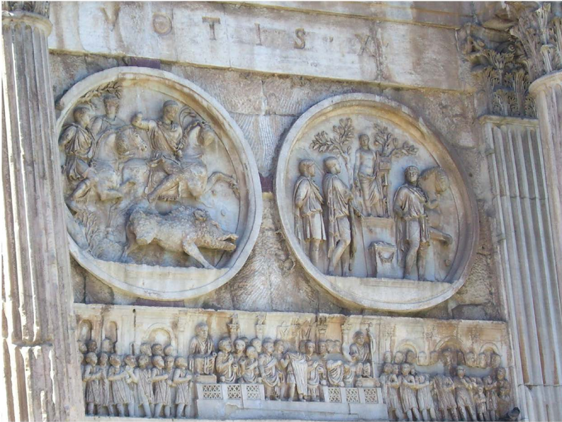
Fig. 5 b — Rome : arc de triomphe de Constantin (détail des reliefs) ; photo H.-P. Francfort.