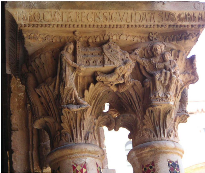
Fig. 3 a — Monreale (Italie, Sicile) : chapiteau du cloître ; photo H.-P. Francfort.