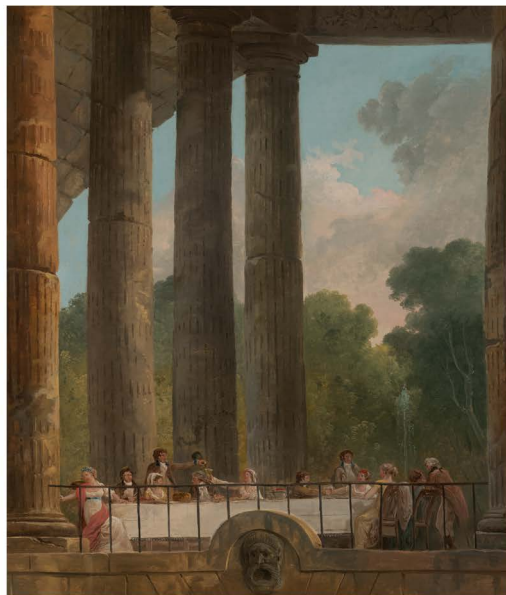
Fig. 10 — Hubert Robert, Banquet dans des ruines (1795), photo Yale University Art Gallery.