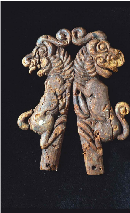
Fig. 7 — Berel' (Kazakhstan) : pièce de harnachement de cheval en bois ; photo H.-P. Francfort MAFAC.