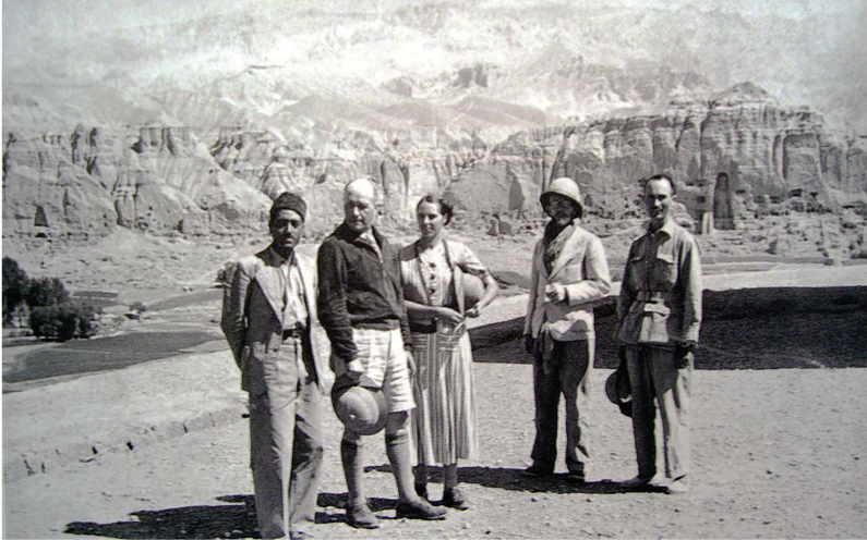
Fig. 8 a — Membres de la DAFA à Bamiyan (1936) ; photo Ella Maillard.