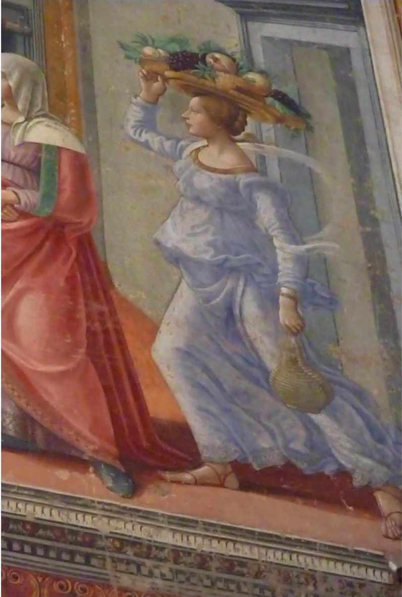
Fig. 9 — Ghirlandaio : servante (Florence, Santa Maria Novella) ; photo H.-P. Francfort.