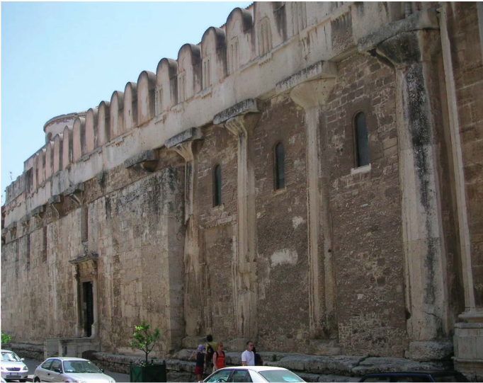
Fig. 4 — Syracuse (Italie, Sicile) : mur nord de la cathédrale avec colonnes doriques antiques ; photo H.P. Francfort.