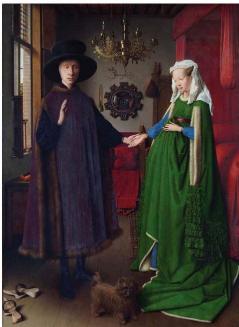
Fig. 1a — J. van Eyck, portrait Arnolfini : Londres, National Gallery ; https://upload.wikimedia.org/wikipedia/commons/333/Van_Eyck_-_Arnolfini_Portrait