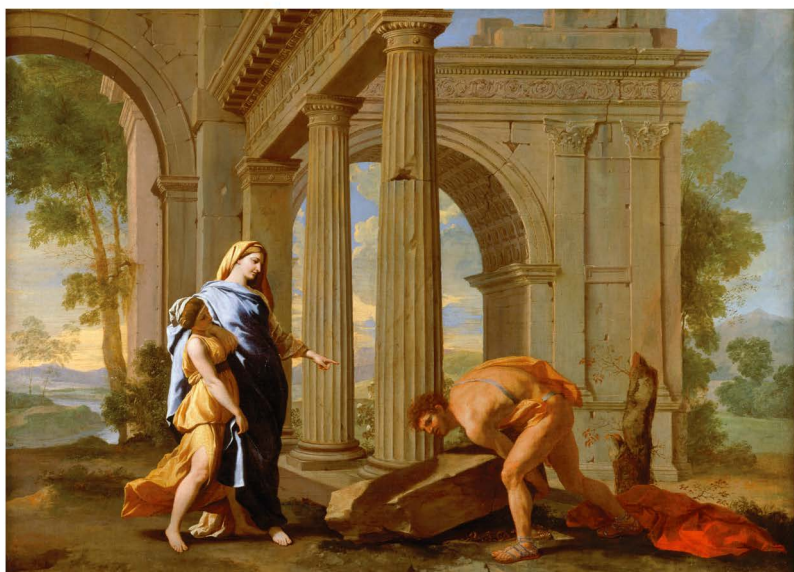
Fig. 11 — Nicolas Poussin, Thésée retrouve l'épée de son père : Musée Condé, Chantilly ; https://commons.wikimedia.org/wiki/File:Th%C3%A9s%C3%A9e_retrouve_l%27%C3%A9p%C3%A9e_de_son_p%C3%A8re_-_Poussin_-_c1638.jpg