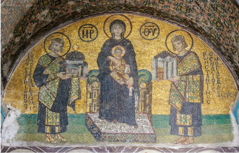
Fig. 2 — Sainte-Sophie, mosaïque de l'entrée sud-ouest ; https://fr.wikipedia.org/wiki/Sainte-Sophie_(Constantinople)#/media/File:Hagia_Sophia_Southwestern_entrance_mosaics_2.jpg .