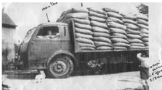
FIGURE 5 Photographie d'un employé de l'usine du CMMP au volant d'un camion transportant les sacs d'amiante (années 1950)

Ainsi, si les souvenirs de chacun, voire dans notre cas leurs collectes et leurs retranscriptions, participent à la construction d'une mémoire collective, on observe parfois un décalage entre les deux: entre ce qu'un individu retient d'un événement et ce que la mémoire collective de ce même événement retiendra. Le témoignage d'un ancien riverain sur le transport des minerais de l'usine, recueilli par le Collectif des riverains, l'illustre: «Alors, c'était très joli ce camion qui partait avec le mica, parce que le mica, comme ça volait, ça faisait de belles petites couleurs». Le souvenir individuel ne retient que la beauté de la dispersion des paillettes de mica dans l'air, tandis que la mémoire collective est focalisée sur l'absence de mesures permettant d'empêcher la dispersion de substances cancérigènes lors de leur transport. Il convient de préciser ici que l'amiante était transporté dans les mêmes conditions que le mica (figure 5).