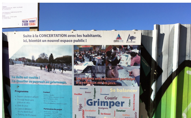
FIGURE 4 Panneau présentant la concertation avec les habitants et les écoliers autour du devenir du site du CMMP | Source: Prost, 2018

qui s'est obstiné, des décennies durant, à lutter pour la justice et la prévention.