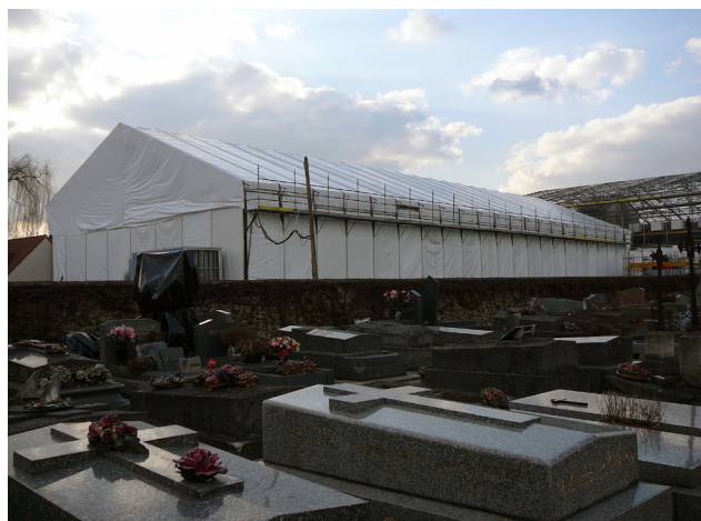
FIGURE 3 Enveloppe autour du bâtiment B (ancien atelier d'amiante de l'usine du CMMP)

curage superficiel du sol recouvert d'une couche de béton armé sur l'ensemble des 6 140 m 2 de la parcelle. Comme dans les étapes précédentes, plusieurs années se sont écoulées entre, d'une part, le signalement de la contamination (cette fois des horizons inférieurs du sol) pourtant affirmée dès le début du chantier par les associations, compte tenu de leur connaissance de la configuration du site et de ses archives, et, d'autre part, la mise en place de la mesure préventive, là encore, issue d'un rapport de force entre les associations et les pouvoirs publics.