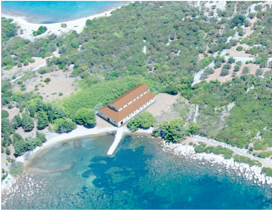
Sl. 4 Prijedlog 3D rekonstrukcije ranokršćanske crkve otkrivene na otočiću Sveti Petar kod Ilovika (D. Vuillermoz, prema S. Bully i M. Čaušević-Bully)

Izgradnja bazilike takvih dimenzija vezana je uz postojanje velike pomorske vile, smještene na nekoliko stotinjaka metara od bazilike. Vila je zasigurno pripadala akvilejskoj senatorskoj porodici u Ranom Carstvu, kako to možemo pretpostaviti na temelju nadgrobnog natpisa Gaja Kornelija, akvilejskog kvatuorvira s kraja 1. st. pr. Kr., 44 no koja je bila u funkciji i tijekom kasne antike, sudeći prema nalazima keramike pronađene prilikom njenog rekognosciranja. No veza s antičkom vilom, koliko god ona prestižna mogla biti, nije dovoljna da bi objasnila veličinu same bazilike, koja dimenzijama ravnima velikim gradskim bazilikama nadilazi skromne dimenzije otočića Sv. Petar. Uzmemo li u obzir širi kontekst u kojem se ovaj lokalitet nalazi, shvatit ćemo moguć razlog zašto je tomu tako. U nedavnoj smo objavi 45 sugerirali da su otoci Ilovik i Sveti Petar imali funkciju značajne pomorske postaje na glavnom plovnom putu istočnom jadranskom obalom između Salone i Akvileje, s ulogom posrednika u organizaciji prijevoza i trgovine unutar kvarnerskog otočja, odnosno prema riječkom zaljevu i Senju, pa time i kontinentalnim provincijama.