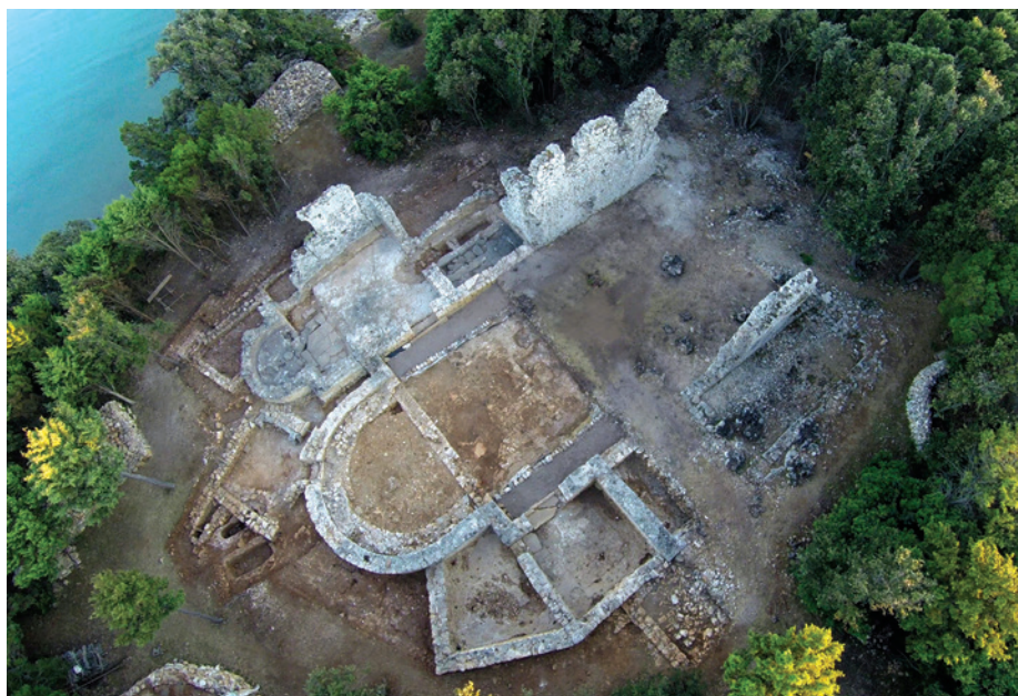
Sl. 3 Zračna snimka crkve u uvali Martinšćica na Punta Križi, otok Cres po dovršetku istraživanja 2017. g. (slikao M. Vuković u okviru sustavnih istraživanja pod vodstvom M. Čaušević-Bully i S. Bully)

“Crkveni sklop” koji se nalazi u uvali Martinšćica na Cresu blizak je onom otkrivenom na položaju Cickini kod Malinske na otoku Krku. Razdvaja ih samo činjenica da je prva izgrađena uz more, dok je potonja, kako smo to već objasnili, izgrađena dalje od mora, u uskoj vezi s kopnom otočnom prometnicom. Crkva u Martinšćici nalazi se na poluotoku Punta Križa, koji je u antičko vrijeme zasigurno pripadao ageru grada Osora ( Apsorus ), a u kasnoj antici osorskoj dijecezi. Uvala u kojoj se smješta ovo crkveno zdanje nalazi se uz plovni kanal kojim se plovilo uz otoke Cres i Lošinj, na putu za Kvarnerić, plominski, pa riječki zaljev (Sl. 3).