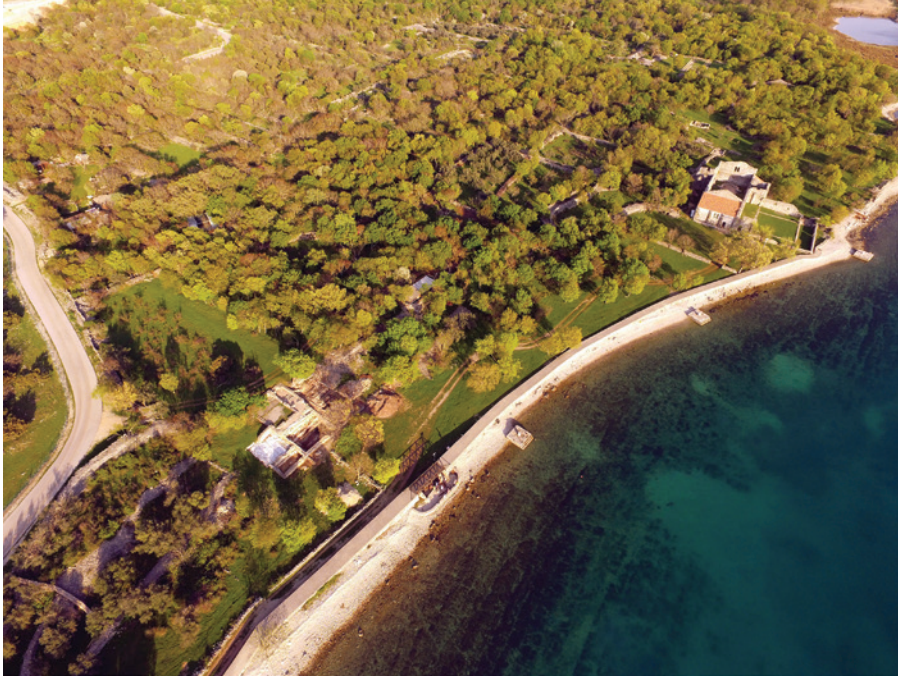
Sl. 2 Zračna snimka "crkvenog sklopa" na Mirinama (lokalitet Fulfinum – Mirine, Omišalj, otok Krk) (slikao Kaducej d. o. o. u okviru sustavnih istraživanja pod vodstvom M. Čaušević-Bully i S. Bully)

Slučaj ranokršćanske crkve na Mirinama u Omišlju na otoku Krku posebno je složen. Crkva se smješta na skutovima rimskog municipija Fulfina osnovanog u 1. st. po. Kr., najkasnije sredinom 5. st., u trenutku u kojem grad, iako još uvijek naseljen, opada, da bi bio u potpunosti napušten tijekom 7. stoljeća (Sl. 2). 20