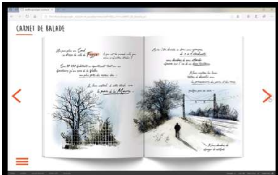
Pages webdoc du groupe CRBA 2018-2019