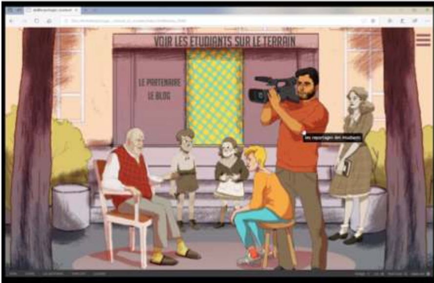
Page webdoc du groupe CHRD 2017-2018