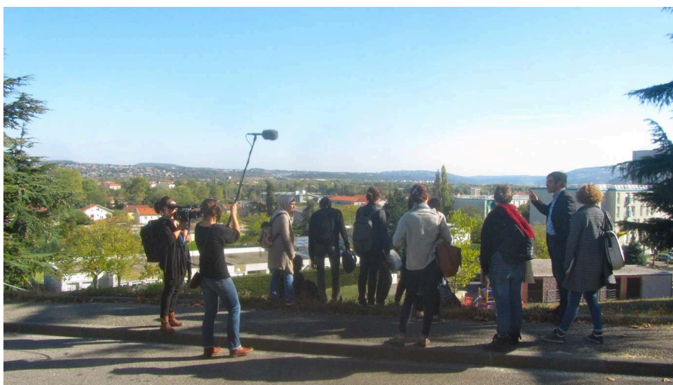
Journée de terrain à Givors, octobre 2017