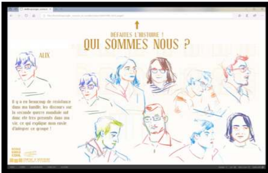
Pages webdoc du groupe CHRD 2018-2019