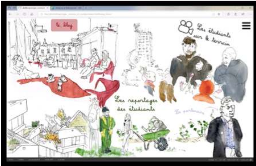
Page webdoc du groupe Givors 2017-2018