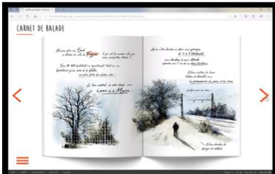
Pages webdoc du groupe CRBA 2018-2019