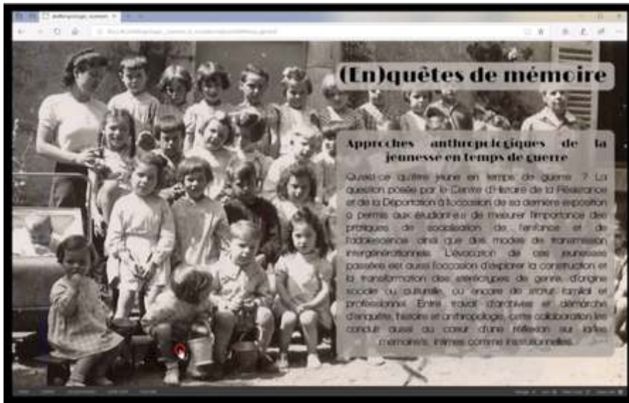
Page webdoc du groupe CHRD 2017-2018