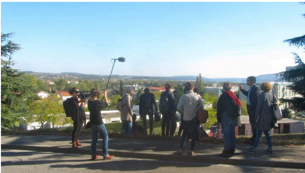
Journée de terrain à Givors, octobre 2017