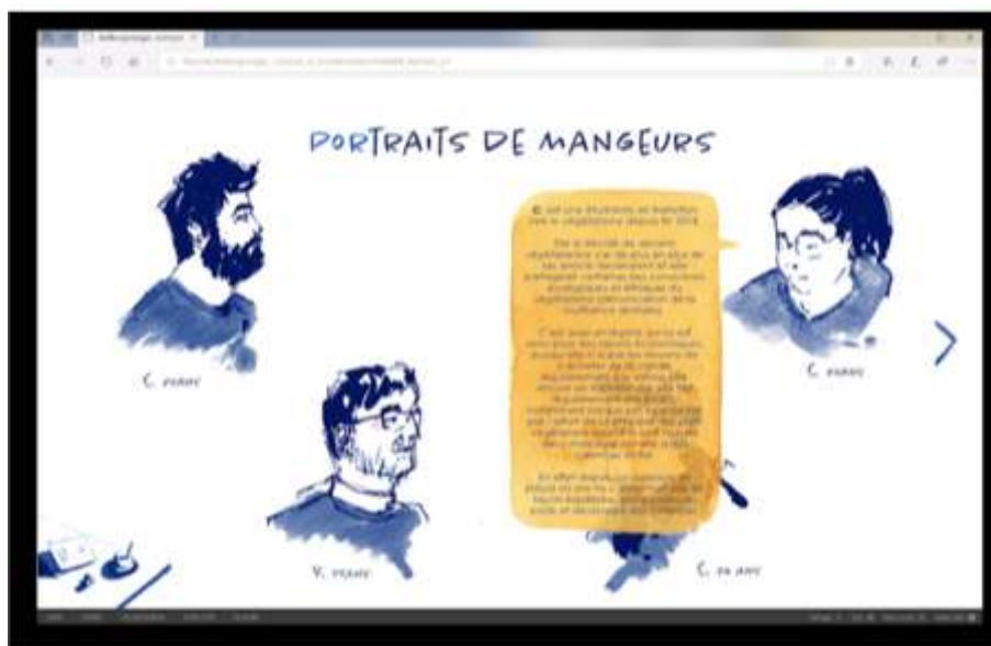
Pages webdoc du groupe IPB 2018-2019