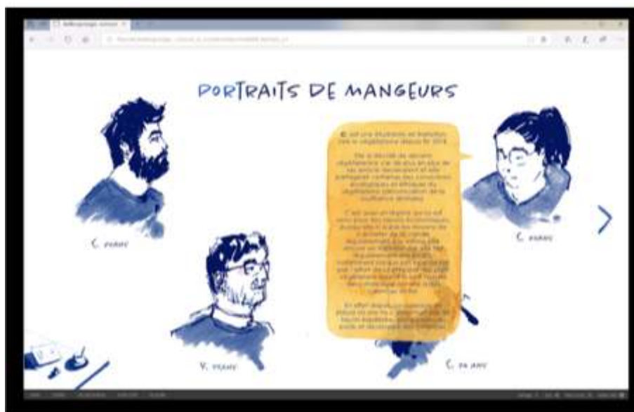
Pages webdoc du groupe IPB 2018-2019