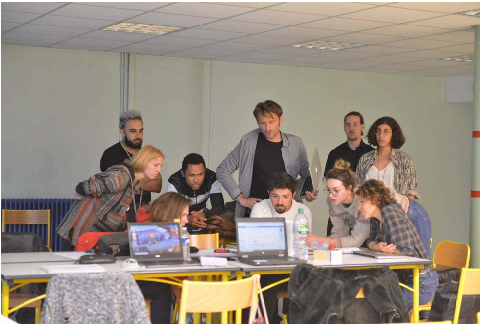
Séance de cours à l'université, avril 2019