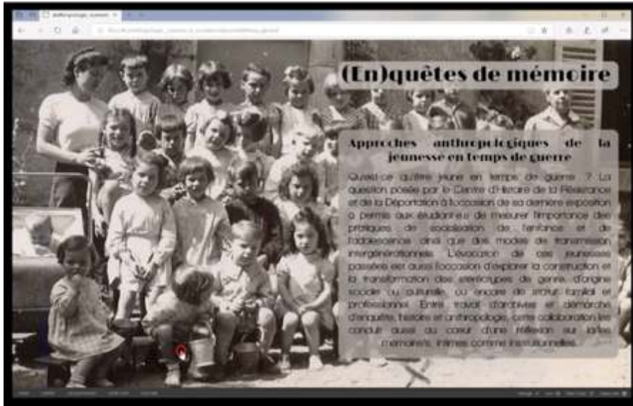
Page webdoc du groupe CHRD 2017-2018