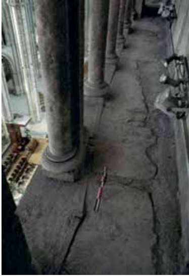
Fig. 4 – Chaînage au sol du triforium du chœur de la cathédrale de Bourges (Maxime L'Héritier).

entre 5 et 7 kg 18 . Seules les pièces servant à fermer le chaînage se démarquent ici de leurs dimensions 19 . À la cathédrale de Beauvais (milieu du XIII e s.), les éléments du chaînage retrouvés dans les combles reprennent ce dernier cas de figure 20 (fig. 5). Dans les trois cas, on constate donc que les dimensions de la grande majorité de ces barres de fer ne sont assurément pas liées à des contraintes architecturales.