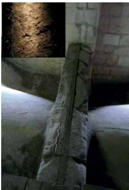
Fig. 7 – Tirant ancré sur un mur diaphragme au-dessus des voûtes du bas-côté sud de la cathédrale de Bourges avec marque de soudure relevée en lumière rasante sur ce tirant (Maxime L'Héritier).

ont été découverts dans les combles des collatéraux intérieurs 22 . Ils pèsent entre 40 et 47 kg chacun (tableau 1). De nombreuses traces de forge et les marques de soudures assez régulièrement espacées ont pu y être observées en lumière rasante (fig. 7), révélant