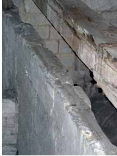
Fig. 5 – Chaînage ancré sur un mur diaphragme au-dessus des voûtes du chœur de la cathédrale de Beauvais (Maxime L'Héritier).

L'étude de fers architecturaux plus grands vient corroborer cette analyse. Le chaînage inséré dans la corniche du mur gouttereau de la nef à l'abbatiale de Saint-Denis est constitué de pièces mesurant environ 110 cm pour une masse dépassant 10 kg 21 . Mais les pièces étudiées portent systématiquement une marque de soudure dans leur partie médiane (fig. 6), révélant que ces éléments ont été forgés à partir de deux modules plus petits, proches des 5 kg. À la cathédrale de Bourges, d'immenses tirants mesurant près de 4,5 m de long