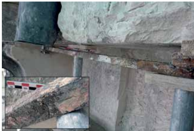
Fig. 6 – Chaînage inséré dans la corniche au sommet du mur gouttereau de la nef de la basilique de Saint-Denis avec marque de soudure relevée sur ce chaînage (Maxime L'Héritier).

ont été découverts dans les combles des collatéraux intérieurs 22 . Ils pèsent entre 40 et 47 kg chacun (tableau 1). De nombreuses traces de forge et les marques de soudures assez régulièrement espacées ont pu y être observées en lumière rasante (fig. 7), révélant