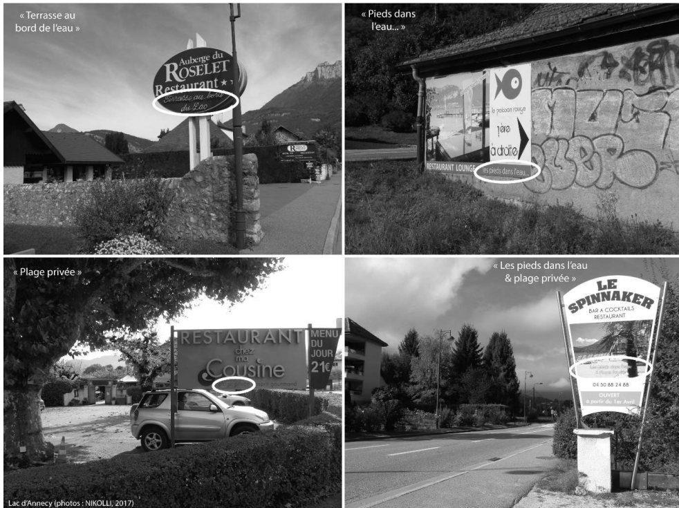
Planche photographique 3. La mise en valeur visuelle de l'accès exclusif au lac dans la communication web