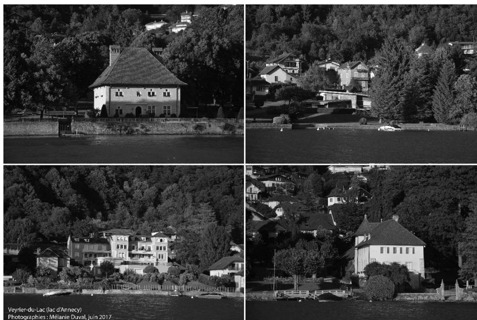
Planche photographique 4. Quand les croisières lacustres donnent à admirer les usages privés des rives

Ces photographies ont été prises un samedi de juin 2017 lors d'une excursion en « bateau privé » proposée par un prestataire touristique local. Elles illustrent la première partie de la visite du lac, intitulée « Sur les rives du lac » sur le site web du prestataire, qui donne à admirer les propriétés riveraines du lac de la commune de Veyrier, dont le littoral est occupé à 80% par des villas « pieds dans l'eau ».