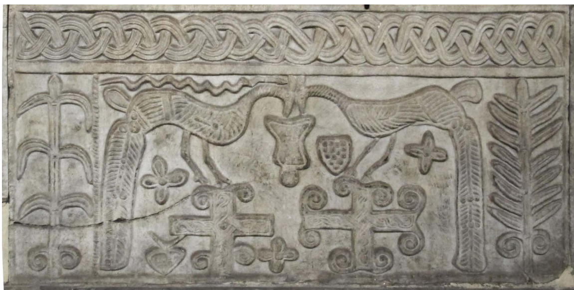
Figure 1. Plaque de chancel, fin VIII e siècle

Rome, Vestibule de Santa Maria in Trastevere. Source : https://commons.wikimedia.org/wiki/File:Santa_maria_in_trastevere,_epigrafi_nel_portico_02_pavoni_che_bevono_a_un_vaso,_IX_sec.JPG (Sailko, CC BY 3.0)