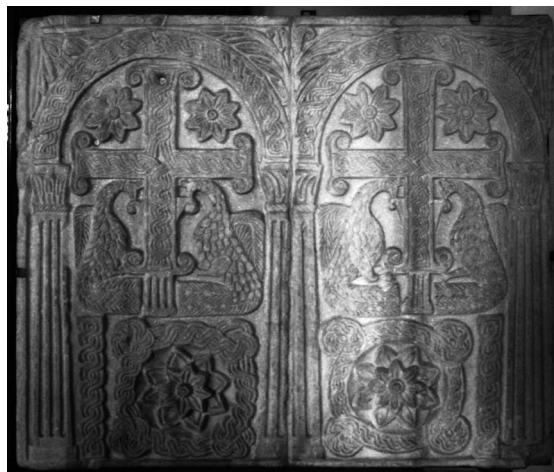
Figure 3. Devant d'autel, milieu IX e siècle Rome, Santa Maria in Ara Coeli, actuellement conservé au musée du Haut Moyen-Âge à Rome, inv. 2162.

L'estompement de la frontière entre visible et invisible par l'intermédiaire de l'image est sensible dans le traitement des corps des paons et du griffon dont les marques corporelles révèlent leur structure intérieure et les relient, par là même, à la structure globale. Ils s'inscrivent dans un même ensemble régi par l'ordre divin, ils dévoilent leur structure pour révéler leur appartenance à un univers créé par Dieu. Les figures géométriques donnent naissance aux arbres-fontaines qui abreuvent les paons au sein d'un univers renouvelé par le sacrifice du Christ. Les limites du végétal, du minéral et de l'animal s'atténuent, se fondent et se confondent pour souligner la vitalité de cet univers dont la structure est donnée à voir au fidèle lorsqu'il se rapproche du chœur 14 . Le chancel délimite l'espace du sanctuaire et en protège l'accès, mais l'image permet au fidèle de franchir symboliquement cette frontière pour se rapprocher de Dieu. Les paons gardiens de cet Arbre de Vie démultiplié invitent le fidèle à communier et à s'abreuver de la vitalité du Verbe de Dieu. Il en est de même sur ce devant d'autel provenant de l'église Santa Maria in Ara Coeli à Rome (fig. 3).