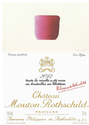
figure 2 – Etiquette Château Mouton Rothschild, 2013

Que voyons-nous ou plutôt que ressentons-nous ? L'artiste invite ici à dépasser la figuration sans passer pour autant par l'abstraction, ce qui est le propre de la Figure, selon Deleuze. À charge pour l'artiste, de rendre visibles des forces invisibles 1 , par exemple, en libérant la forme du tracé, en jouant du rythme et des vibrations des plages colorées avec la lumière ou l'intensité. Pas de lecture symbolique donc, attachée à une signification ou une convention culturelle, mais une plongée dans le figural, pour s'immerger à la fois dans la Figure et se libérer à travers elle, selon un mouvement diastole-systole : « le monde qui me prend moi-même en se fermant sur moi, le moi qui s'ouvre au monde, et l'ouvre lui-même » (2002, p.46).