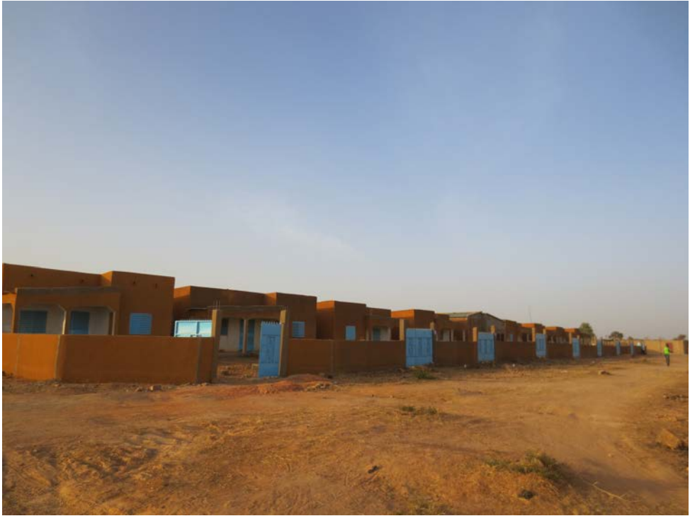
Maisons individuelles construites par la CBH selon un modèle de type F3 (2 chambres, salon, cuisine, douche WC internes). Site de Bassinko, Ouagadougou.

Inspirées de l'exemple du Sénégal, ces coopératives s'adressent aux ménages les plus modestes, dans la perspective de développer l'accès formelle à la propriété foncière et immobilière via des crédits bancaires adaptés. Dans le dernier programme public de construction de logements, il est attendu des coopératives qu'elles produisent 12,5 % des 40 000 nouveaux logements prévus, soit 5 000 logements.